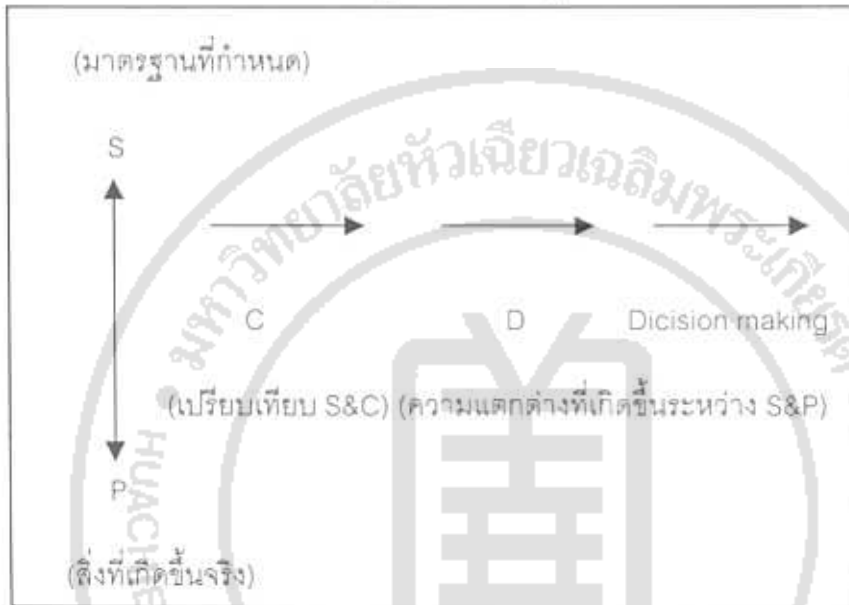
ภาพที่ 2.2 แสดงรูปแบบการประเมินของโพรวิส

1.3 รูปแบบของโพรวิสหรือรูปแบบการประเมินผลความคลาดเคลื่อนของโพรวิส (Provus Discrepancy Evaluation Model) เป็นการตรวจสอบว่าการดำเนินงานตามหลักสูตรได้ผลตรงหรือคลาดเคลื่อนไปจากมาตรฐานที่ได้กำหนดไว้หรือไม่ วิธีการประเมินใช้วิธีเปรียบเทียบการกระทำและผลของการกระทำกับมาตรฐานซึ่งก็คือวัตถุประสงค์ที่กำหนดไว้