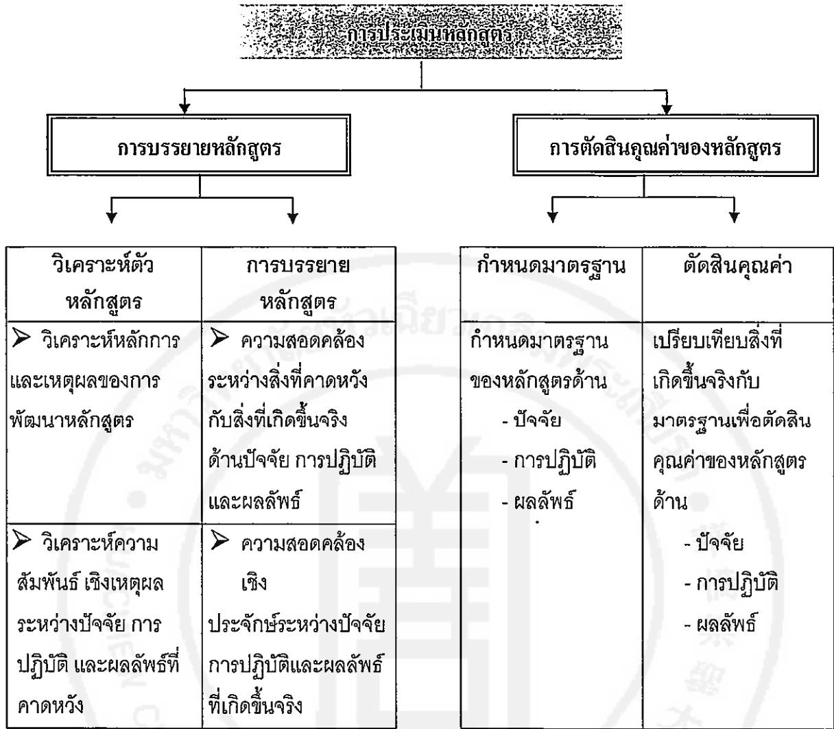
ภาพที่ 2 การประยุกต์โมเดลการประเมินของ Stake สำหรับใช้ประเมินหลักสูตร