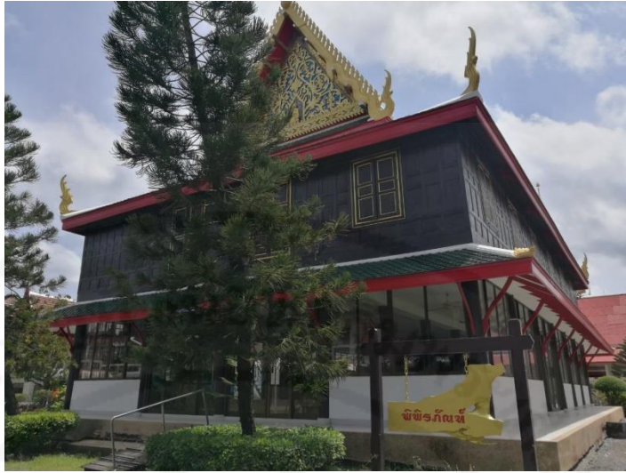
รูปภาพ : พิพิธภัณฑสถานวัดบัวโรย

เป็นสถานที่รวบรวมศิลปวัตถุ ของวัดและชุมชนวัดบัวโรยแห่งนี้เป็นอาคาร 2 ชั้น เดิมเป็น หอฉัน หอสมุดมนต์ อาคารชั้นล่าง นอกจากจะเป็นหอฉันแล้วยังเป็นอาคารแสดงภาพถ่ายในอดีต อีกด้วย ส่วนอาคารชั้น 2 ใช้แสดงโบราณวัตถุ ครุภัณฑ์ต่างๆที่ทรงคุณค่า พิพิธภัณฑสถานแห่งนี้ก่อตั้ง ขึ้นเมื่อวันที่ 25 กันยายน พ.ศ.2552 โดยความเห็นชอบจาก หลวงพ่อพระครูโกมุทธรรณธาดา (เจ้าอาวาสรูปที่ 6) เพื่ออนุรักษ์ และเก็บรักษาโบราณวัตถุต่างๆและยังเป็นแหล่งการเรียนรู้ที่ สำคัญของชุมชนอีกด้วย พิพิธภัณฑสถานแห่งนี้ได้รับการยกย่องว่าเป็นพิพิธภัณฑสถานต้นแบบที่ดีใน จังหวัดสมุทรปราการอีกด้วย