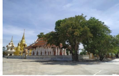
รูปภาพ: พระอุโบสถ วัดบัวโรย