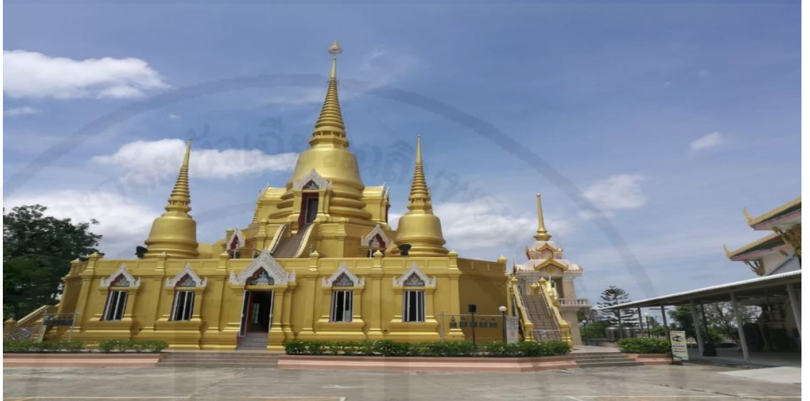
รูปภาพ : พระมหาเจดีย์ศรีบัวโรย

ธนบุรี เมื่อปี พ.ศ 2456 หนึ่งเดียวในสมุทรปราการ ที่มีความศักดิ์สิทธิ์เป็นที่เลื่องลือของคนบัวโรย มาช้านาน โดยเฉพาะในเรื่องโชคลาภ