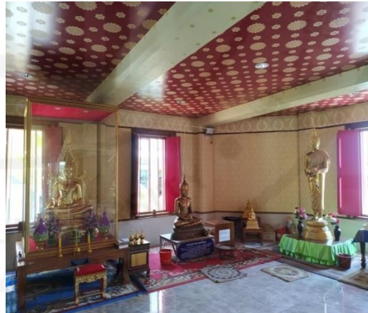
รูปภาพ: หลวงพ่อเพชรและพระพุทธรูปต่างๆในพระมหาเจดีย์ศรีบัวโรย