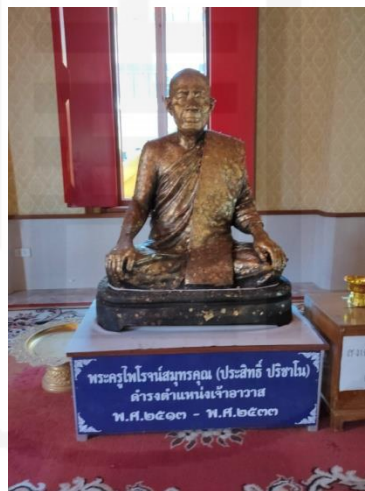
รูปภาพ: พระครูไพโรจน์สมุทรคุณ หรือหลวงพ่อหล่อ

ร.9 ภูมิลำเนาบ้านคลองไทรตามาก ตำบลศรีษะจรเข้ชั้น้อย อำเภอบางพลี(ปัจจุบันคืออำเภอบางเสาธง) จังหวัดสมุทรปราการ พระอธิการเฉลิม ทสฺนธมฺโม (เรื่องรอง) ท่านได้รับยกย่องจากพระเถรานุเถระหลายรูปว่าเป็นพระหนุ่มนักพัฒนา เนื่องจากท่านได้รับแต่งตั้งเป็นเจ้าอาวาสเพียงอายุ 26 ปีท่านได้พัฒนาวัดบัวโรยให้เจริญก้าวหน้าขึ้นเป็นอย่างมาก ได้ก่อสร้างถาวรวัตถุภายในวัด และชุมชน โดยเฉพาะเรื่องการศึกษาท่านได้สร้างโรงเรียนทั้งโรงเรียนประชาบาลและโรงเรียนพระปริยัติธรรมสำหรับภิกษุสามเณร อีกทั้งยังสร้างสะพาน ศาลาพักร้อน ศาลาทำน้ำ ห้องน้ำ เชื้อนหน้าวัดและอื่นๆอีกมากมาย ท่านเป็นพระที่ประพฤติชอบ ประกอบไปด้วยคุณธรรม เมื่อท่านว่างเว้นจากกิจการพระศาสนา ท่านมีการจาริกไปยังสถานที่ต่าง ๆ นำสาระธรรมดี ๆ คติธรรมมาบอกเล่า สั่งสอน อธิบายเผยแผ่สาธุชนอุบาสิก และลูกศิษย์