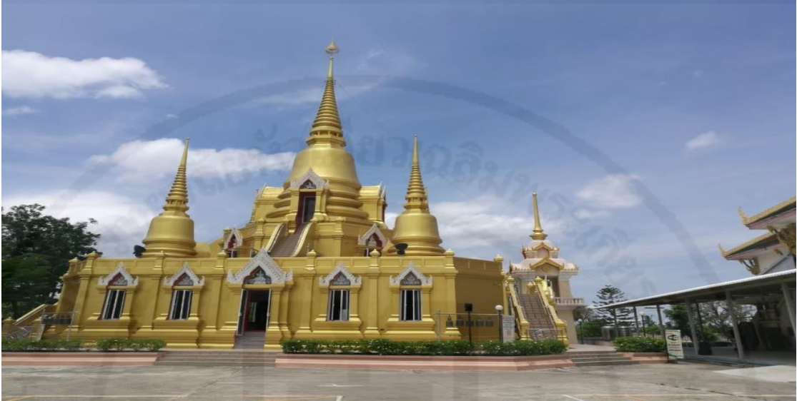
รูปภาพ : พระมหาเจดีย์ศรีบัวโรย

ชุมชน บ้านบางประกอก ฝั่งธนบุรี เมื่อปี พ.ศ 2456 หนึ่งในเดียวในสมุทรปราการ ที่มีความศักดิ์สิทธิ์ เป็นที่เลื่องลือของคนบัวโรยมาช้านาน โดยเฉพาะในเรื่องโชคลาภ