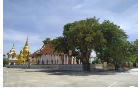
รูปภาพ: พระอุโบสถ วัดบัวโรย