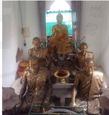
รูปภาพ: พระมณฑป

มหาเจดีย์ศรีบัวโรย สร้างขึ้นเมื่อปี พ.ศ. 2557 เป็นมหาเจดีย์ที่ทาสีทองเหลืองอร่ามสวยงามเป็นที่สะดุดตาของผู้ที่สัญจรไปมา สร้างโดยอดีตเจ้าอาวาสได้ให้นามไว้ว่า “มหาเจดีย์ศรีบัวโรย” และภายในเจดีย์ได้ประดิษฐานพระพุทธรูปศักดิ์สิทธิ์พระนามว่า “หลวงพ่อเพชร” ซึ่งมีพุทธลักษณะเป็นปางจกรม จีวรลายดอกพิกุลและเป็นปางที่ไม่ปรากฏในพื้นที่อื่น เชื่อว่าเป็นพระพุทธรูปที่มีเพียงองค์เดียวในประเทศไทย เป็นศิลปะรัตนโกสินทร์ตอนต้น สร้างถวายโดย นาย