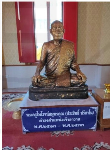
รูปภาพ: พระครูไพโรจน์สมุทรคุณ หรือหลวงพ่อหล่อ

พระครูไพโรจน์สมุทรคุณ หรือหลวงพ่อหล่อ (ประสิทธิ์ ปรีชาโน รักษาธรรม) ดำรงตำแหน่งตั้งแต่พุทธศักราช 2513-2533 รวม 20 ปี ในรัชสมัยพระบาทสมเด็จพระบาทสมเด็จพระเจ้าอยู่หัวภูมิพลอดุลยเดช ร.9 ภูมิลำเนาบ้านคลองไทรตามาก ตำบลศรีษะจรเข้ชั้น้อย อำเภอบางพลี(ปัจจุบันคืออำเภอบางเสาธง) จังหวัดสมุทรปราการ พระครูไพโรจน์สมุทรคุณ (ประสิทธิ์หรือทองหล่อ (ปรีชาโน) รักษาธรรม) ท่านเป็นพระอุปัชฌาย์ อาจารย์ที่ใจดี จึงมีคำเรียกท่านว่าฤๅษี