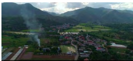
ภาพที่ 1 หมู่บ้านภาคเหนือในภาพยนตร์เรื่องส้มป่อย