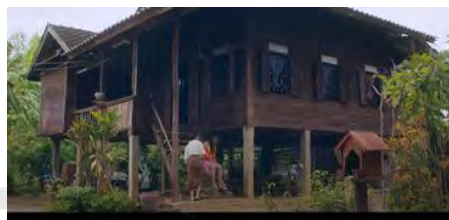
ภาพที่ 2 บ้านเรือนของตัวละครเอกฝ่ายหญิงส้มป่อยใน ภาพยนตร์เรื่องส้มป่อย

จากตัวอย่างรูปภาพสะท้อนให้เห็นคนชนบททางภาคเหนือมักจะอยู่รวมกันเป็นหมู่บ้านสภาพบ้านเรือนส่วนใหญ่จะปลูกง่าย ๆ ตามสภาพความเป็นอยู่ที่ยเรียบง่าย บ้านเรือนของตัวละครที่เป็นคนชนบททางภาคเหนือเป็นบ้านใต้ถุนสูงและมีบันได หลังคาทรงสูงลาดเอียง และเป็นเรือนไม้ ตัวบ้านเป็นรูปสี่เหลี่ยม ประกอบด้วยห้องต่าง ๆ หลังบ้านมีป่าไม้ ในบริเวณบ้านมีการเลี้ยงสัตว์ปีกด้วย สะท้อนให้เห็นว่าสภาพชีวิตความเป็นอยู่ของคนชนบททางภาคเหนือมีความเป็นอยู่ที่เรียบง่าย การดำเนินชีวิตประจำวันขึ้นอยู่กับธรรมชาติ ซึ่งใช้วัสดุสร้างบ้านเรือนที่เหมาะสมกับลักษณะของชนบทภาคเหนือที่มีป่าไม้จำนวนมาก บ้านเรือนมักสร้างอยู่ใกล้ธรรมชาติ ล้อมรอบไปด้วยต้นไม้