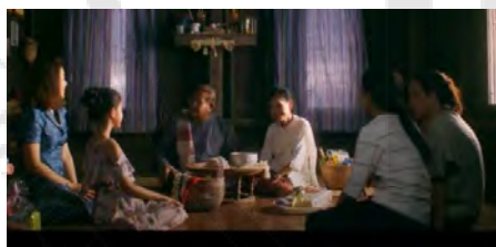
ภาพที่ 3 การแต่งกายของกลุ่มผู้ใหญ่ภาคเหนือใน ภาพยนตร์เรื่องส้มป่อย (ที่มา : https://www.netflix.com/th/title/81511310 )

ภาพยนตร์เรื่องส้มป่อยแสดงให้เห็นถึงลักษณะการแต่งกายของชาวเหนือ ตัวละครที่เป็นชาวเหนือต่างวัยมีการแต่งตัวที่ไม่เหมือนกัน ดังตัวอย่างตามรูปภาพ