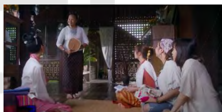
ภาพที่ 4 การแต่งกายของชาวดอก ส้มป่อยและ วัยรุ่นทั่วไปในภาพยนตร์เรื่องส้มป่อย