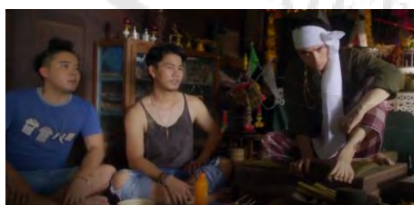
ภาพที่ 5 การแต่งกายของแซ่ปเมือเป็นคนทรงเจ้าและ เพื่อนที่เป็นวัยรุ่นทั่วไปในภาพยนตร์เรื่องส้มป่อย