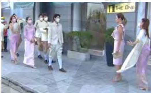
ภาพที่ 7 การแต่งกายในพิธีสู่ขอเจ้าสาว

4.1 การแต่งกายที่มีการผสมผสานทางวัฒนธรรม ในละครซีรีส์เรื่องนี้ ตอน เราและนาย...ตลอดไป ได้นำเสนอภาพงานพิธีการสู่ขอของลูกบ๊วยที่มีการแต่งกายแบบการผสมผสานทางวัฒนธรรม โดยลีนุงผ้าโจงกระเบนแบบไทยและใส่ชุดแบบตะวันตก ส่วนออยแต่งกายตามแฟชั่นทันสมัย ในขณะที่แม่ของลีและเพื่อน ๆ ของออยใส่ชุดไทย ดังภาพที่ 7