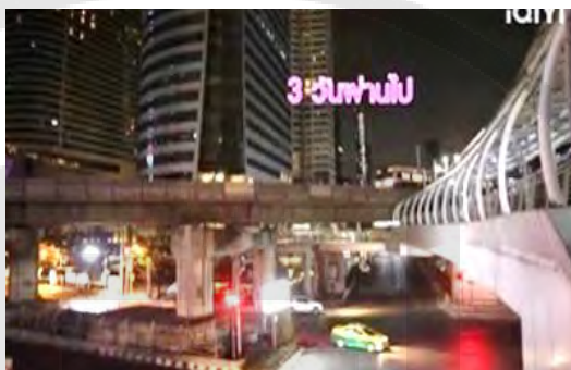
ภาพที่ 6 เส้นทางรถไฟฟ้า และเส้นทางสกายวอล์คและสะพานลอยคนข้าม

2.2 การเดินทางด้วยบริการสาธารณะ ในละครซีรีส์เรื่องนี้ ตอน คอลเลคชั่นใหม่ คอลเลคชั่นเก่า ได้นำเสนอถึงภาพการคมนาคมในใจกลางเมืองกรุงเทพมหานคร ได้แก่ เส้นทางสกายวอล์คและสะพานลอยคนข้าม ทางรถไฟฟ้า และรถแท็กซี่ที่วิ่งสัญจรรับผู้โดยสารอยู่บนท้องถนน ดังภาพที่ 6