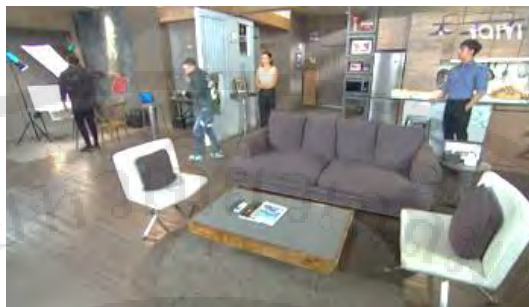
ภาพที่ 1 ลักษณะห้องชุดของตัมกับชาตรี

ได้นำเสนอที่อยู่อาศัยของตัวละครเป็นห้องชุดในคอนโดมิเนียมของตัมกับชาตรี และห้องชุดของเอ็งเอยในตอน คอลเลกชันใหม่ คอลเลกชันเก่า ห้องชุดของออย ในตอน ชนะ VS แม่ผัว ดังภาพที่ 1