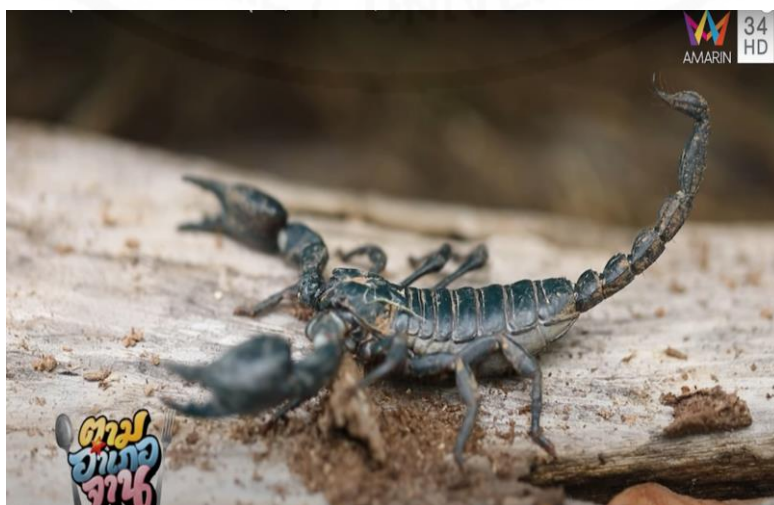
ภาพที่ 33 แมงป่องข้าง

(“ตามอำเภอจาน” : ตอนที่ 32 ตามหาวัตถุบิจากสัตว์มีพิษ “แมงป่องข้าง” ออกอากาศ 15 ส.ค. 63)