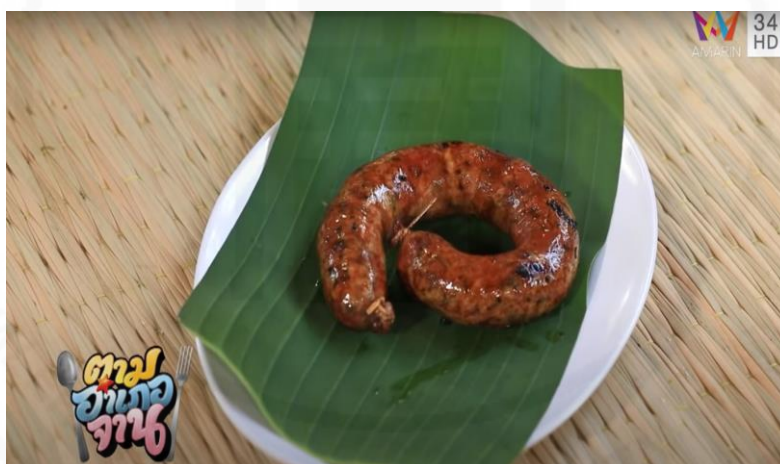
ภาพที่ 17 ไส้อ้วไบซาเห็ดหอม