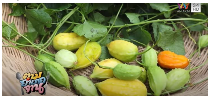
ภาพที่ 6 ผักแมะและลูกแมะ

(“ตามอำเภอจาน” : ตอนที่ 27 ลุยหา “ตัวเวียด” แมลงยามค้ำคีน ออกอากาศ 11 ก.ค. 63)