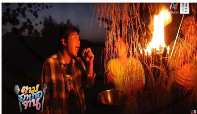
ภาพที่ 39 ท่าทางการอ้าปากของพิธีกร

(“ตามอำเภอจาน” : ตอนที่ 27 ลุยหา “ตัวเวียด” แมลงยามคำคืน ออกอากาศ 11 ก.ค. 63)