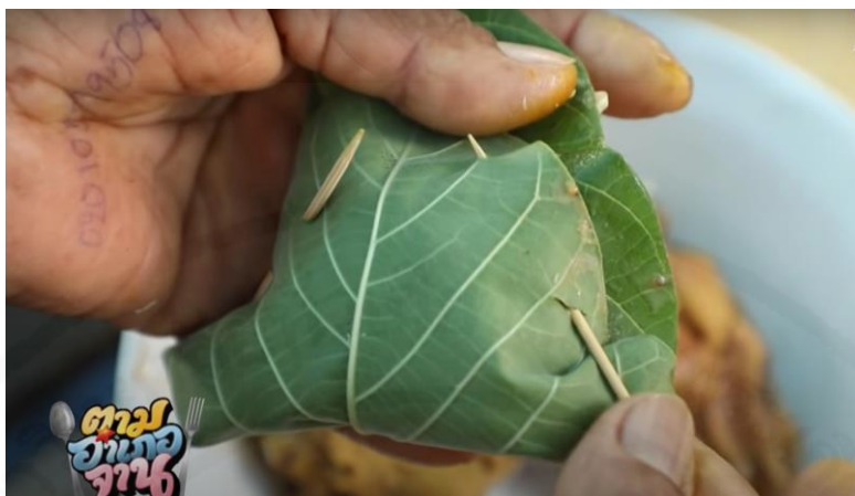
ภาพที่ 15 ชาวบ้านใช้ใบโพทะเลทำไข่หอยเม่นอย่าง