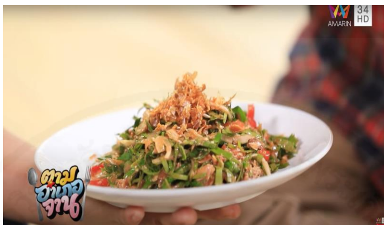
ภาพที่ 16 ยำใบเมี่ยง