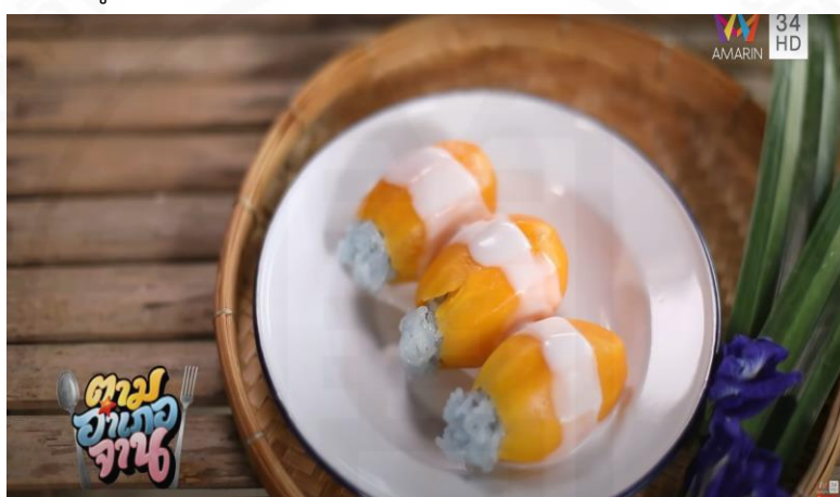
ภาพที่ 22 ข้าวเหนียวมูนมะยมขิด

(“ตามอำเภอจาน” : ตอนที่ 13 เก็บ “มะยมขิด” ออกอากาศ 4 เม.ย. 63)