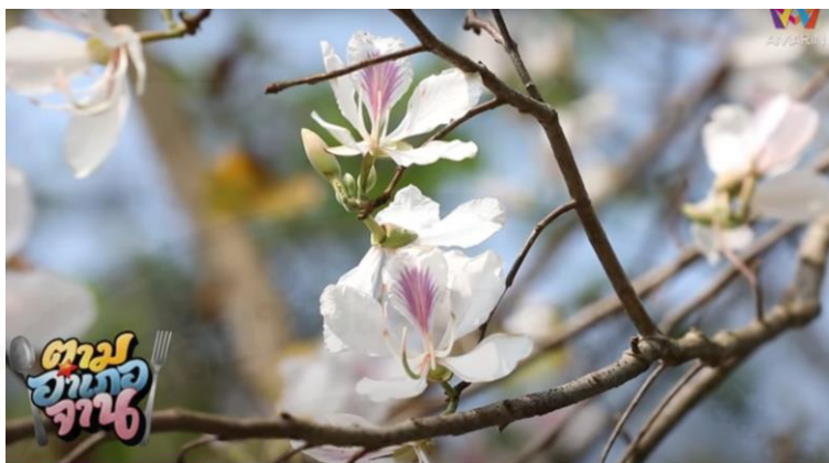
ภาพที่ 7 ดอกเสี้ยวตามป่าเขา