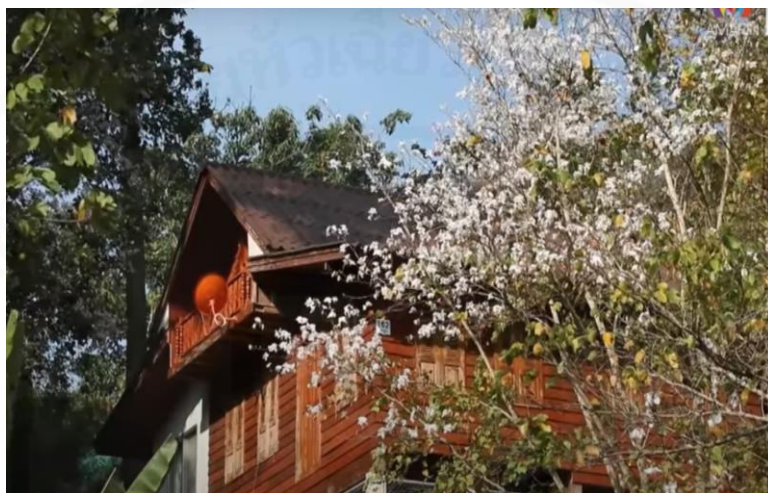
ภาพที่ 45 ดอกเสี้ยวในจังหวัดลำปาง

สำหรับโฮสเทลที่นี้เนาะ ก็ติดต่อมาทางชุมชนได้เลยนะครับ ก็ที่นี้ ยินดีต้อนรับเนาะ (“ตามอำเภอจางน” : ตอนที่ 12 เข้าสวนเก็บ “ดอกเสี้ยว” ออกอากาศ 28 มี.ค. 63)