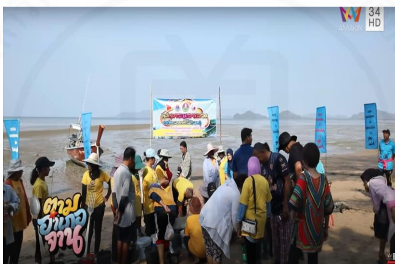
ภาพที่ 20 เทศกาลยอนหอยหลอด

(“ตามอำเภอใจงาน” : ตอนที่ 3 ยอนหอยหลอด ออกอากาศ 25 ม.ค. 63)