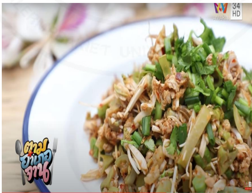
ภาพที่ 13 ยำดอกเสี้ยว

(“ตามอำเภอจาน” : ตอนที่ 12 เช้าสวนเก็บ “ดอกเสี้ยว” ออกอากาศ 28 มี.ค. 63)