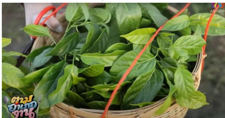
ภาพที่ 8 ผักเชียงดาปลอดสารพิษที่ชาวบ้านปลูกในสวน

(“ตามอำเภอจาน” : ตอนที่ 2 เมนูเด็ดจาก “ผักเชียงดา” ออกอากาศ 18 ม.ค. 63)