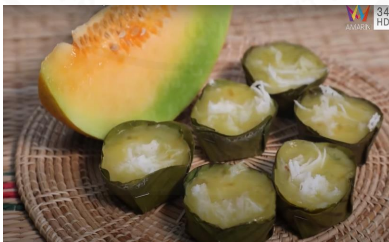
ภาพที่ 23 ขนมแตงไทย

(“ตามอำเภอจาน” : ตอนที่ 26 เข้าสวนเก็บแตงไทย บ้านลาดใต้ ออกอากาศ 4 ก.ค. 63)