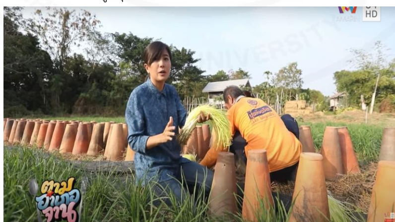
ภาพที่ 26 กระถางดินเผาที่ใช้ปลูกกุ๋ยช่วยชาว

(“ตามอำเภอจาน” : ตอนที่ 28 ส่องสวน กุ๋ยช่วยชาว ออกอากาศ 18 ก.ค. 63)