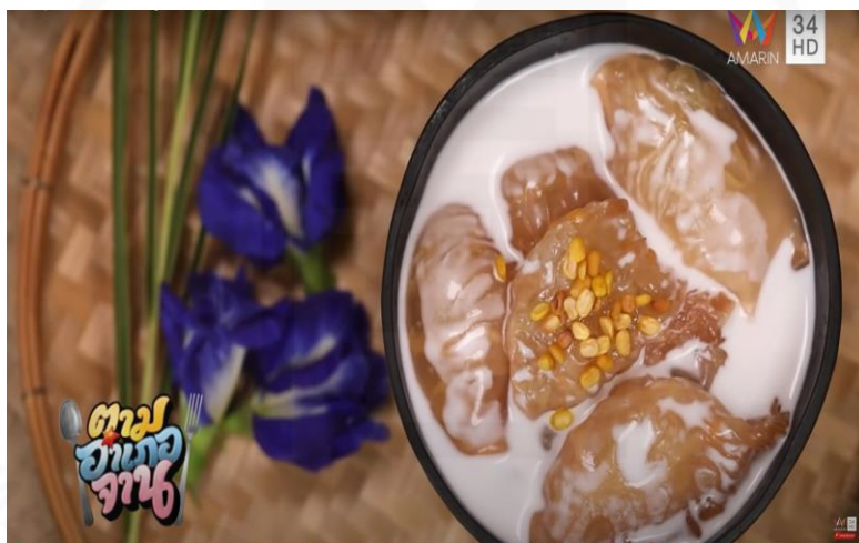
ภาพที่ 18 ปากหม้อกะทิสด

(“ตามอำเภอจัน” : ตอนที่ 10 ลงน้ำลุยป่าตามหา “ต้นสาकु” ออกอากาศ 14 มี.ค. 63)