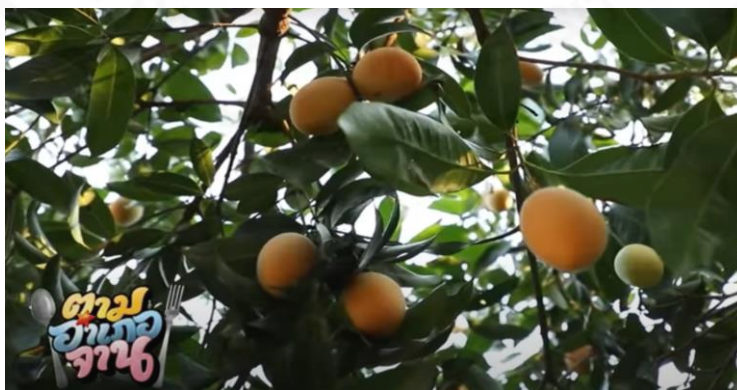
ภาพที่ 11 ต้นมะยงชิด

(“ตามอำเภोजาน” : ตอนที่ 13 เก็บ “มะยงชิด” ออกอากาศ 4 เม.ย. 63)