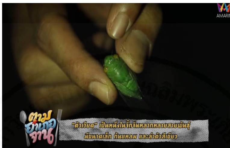
ภาพที่ 31 ตัวเวียด