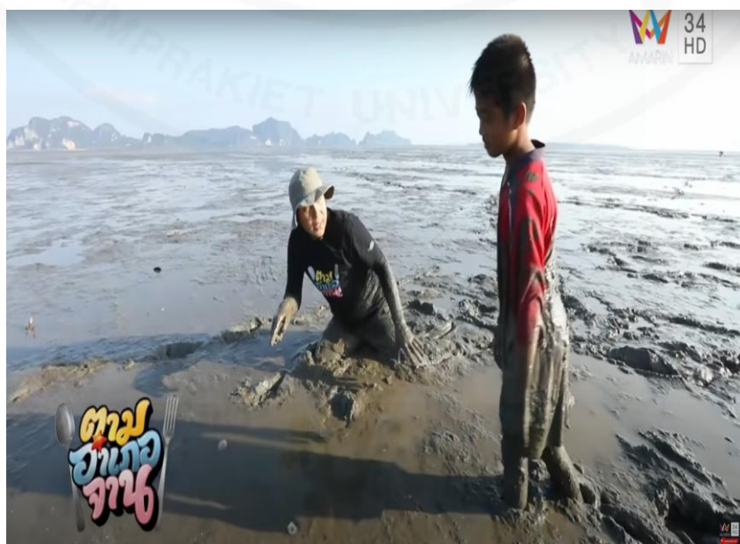
ภาพที่ 42 พิธีกรกับเด็กท้องถิ่นจับหอยวงช้าง

(“ตามอำเภอจาน” : ตอนที่ 1 ลุยหา “หอยวงช้าง” ออกอากาศ 11 ม.ค. 63)