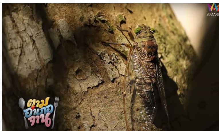
ภาพที่ 32 ตัวवाद