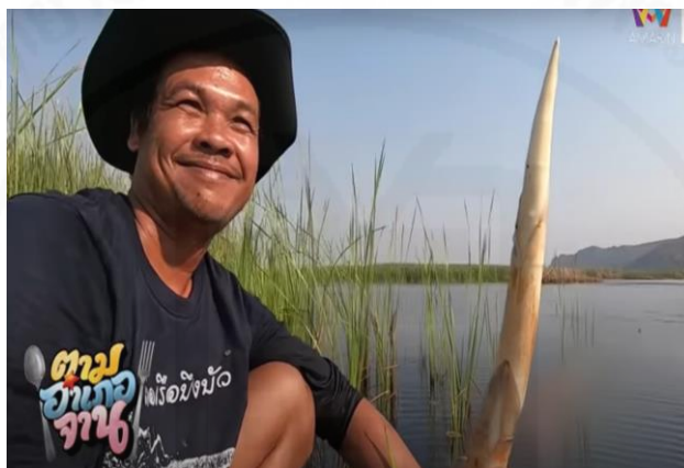
ภาพที่ 5 หน่อฐูปฤษีที่หาได้ในบึงสามร้อยยอด

(“ตามอำเภอจาน” : ตอนที่ 8 ลงเรือตามหา “หน่อฐูปฤษี” ออกอากาศ 29 ก.พ. 63)