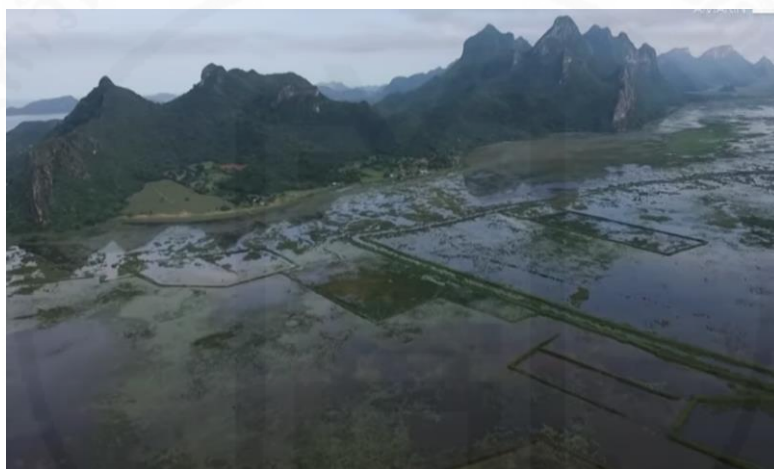
ภาพที่ 44 บึงสามร้อยยอดที่จังหวัดประจวบคีรีขันธ์

(“ตามอำเภอจาน” : ตอนที่ 8 ลงเรือตามหา “หน่อธูปฤๅษี” ออกอากาศ 29 ก.พ. 63)