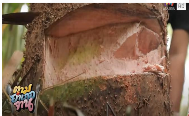
ภาพที่ 4 ต้นสาเหตุที่ขึ้นตามธรรมชาติ

(“ตามอำเภอจาน” : ตอนที่ 10 ลงน้ำลุยป่าตามหา “ต้นสาเหตุ” ออกอากาศ 14 มี.ค. 63)