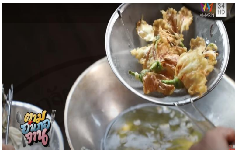
ภาพที่ 14 ดอกเสี้ยวทอด