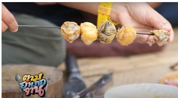
ภาพที่ 3 บักซี่เบาที่ผ่าออกมา