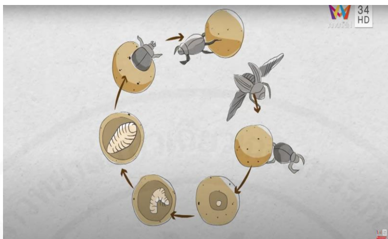
ภาพที่ 30 ระยะเวลาการเติบโตของบักขี้เถ้า