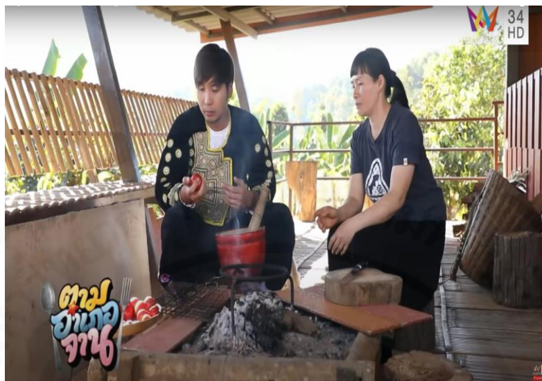
ภาพที่ 35 พิธีกรใส่ชุดชาวม้ง