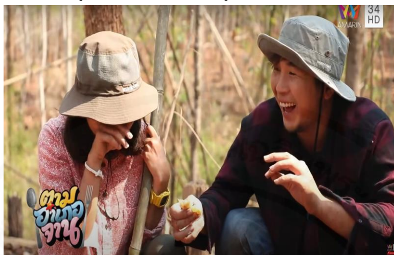
ภาพที่ 37 ท่าทางของพิธีกรผู้ชายเอาบักชี่เข้าให้พิธีกรผู้หญิงชิม