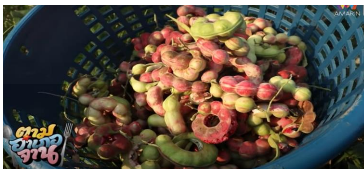
ภาพที่ 10 มะขามเทศ

(“ตามอำเภอจาน” : ตอนที่ 6 ตามรอย “มะขามเทศ” ออกอากาศ 15 ก.พ. 63)