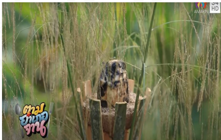
ภาพที่ 25 คบเพลิงที่ใช้จับเวียด

(“ตามอำเภอจาน” : ตอนที่ 27 ลุยหา “ตัวเวียด” แผลงยามคำคืน ออกอากาศ 11 ก.ค. 63)