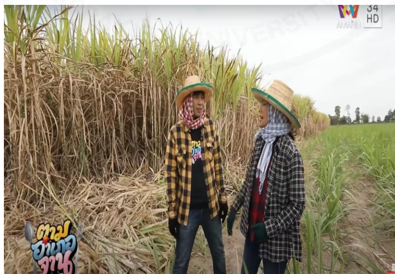
ภาพที่ 36 ชุดตัดอ้อย