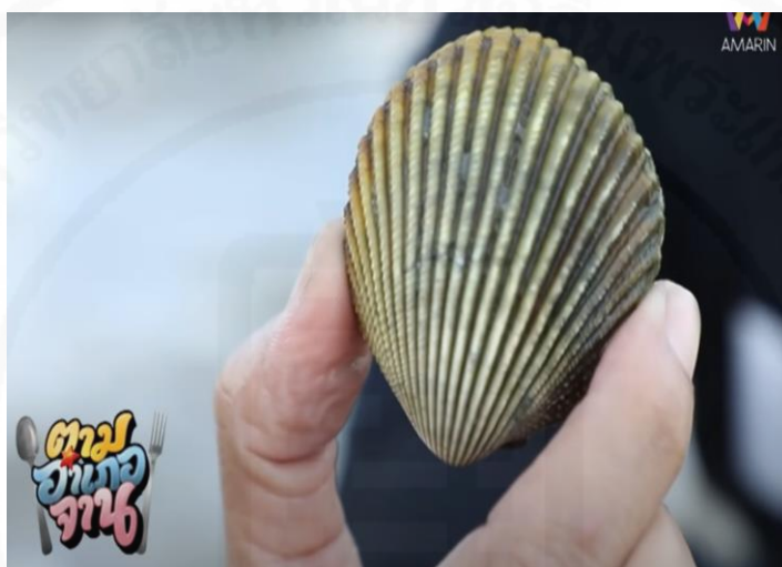
ภาพที่ 1 หอยแครงนกเขาที่หาได้จากอ่าวพังงา

(“ตามอำเภอจาน” : ตอนที่ 17 ตามหาวัตถุดิบ ที่มีชื่อว่า หอยแครงนกเขา ออกอากาศ 2 พ.ค. 63)