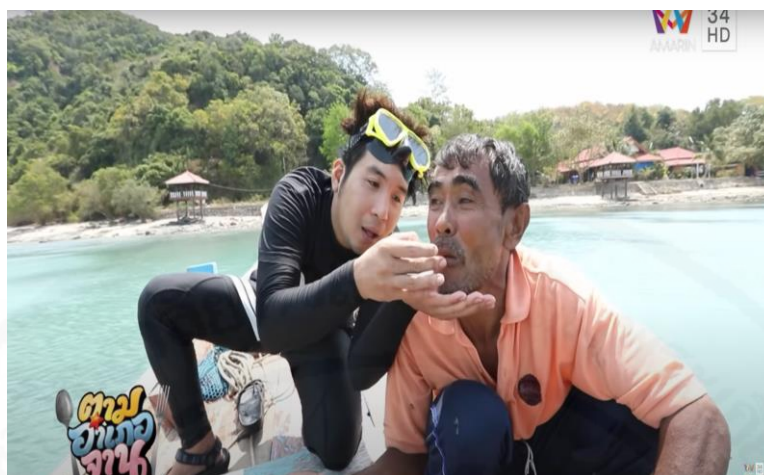
ภาพที่ 40 พิธีกรป้อนหอยเม่นให้ชาวบ้าน