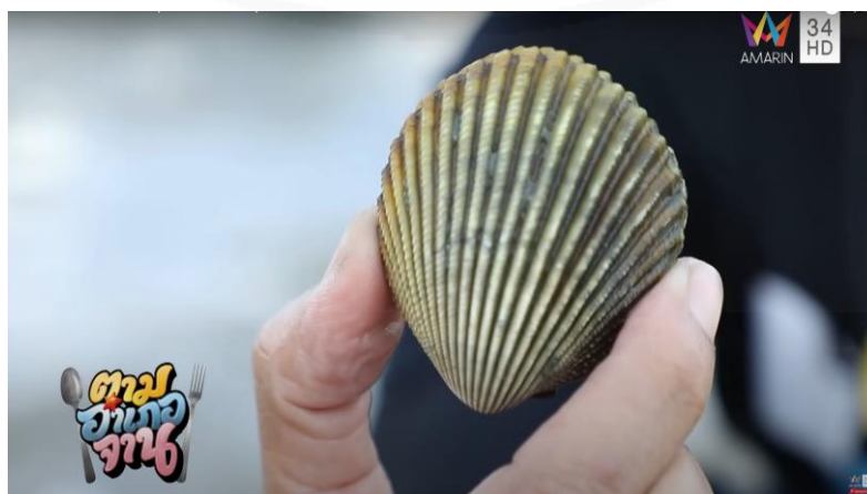
ภาพที่ 28 หอยแครงนกเขา

(“ตามอำเภอจาน” : ตอนที่ 17 ตามหาวัตถุดิบ ที่มีชื่อว่า หอยแครงนกเขา ออกอากาศ 2 พ.ค. 63)