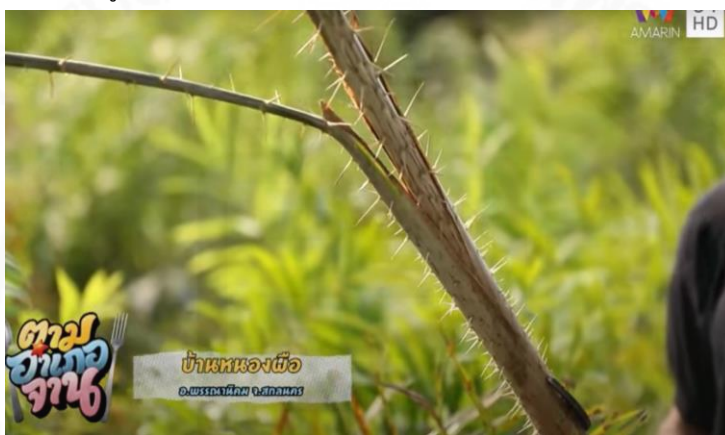
ภาพที่ 9 หวายที่ชาวบ้านปลูกในสวน

(“ตามอำเภอจาน” : ตอนที่ 7 ลุยหาวัตถุดิบแหลมคม “หวาย-หน่อเส้า” ออกอากาศ 22 ก.พ.63)