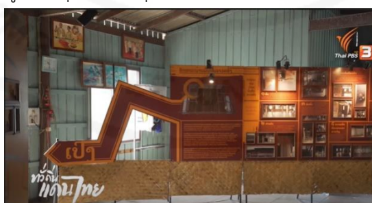
ภาพที่ 40 ศูนย์เรียนรู้ของกลุ่มชาติพันธุ์ลาวครึ่งแห่งบ้านโคก