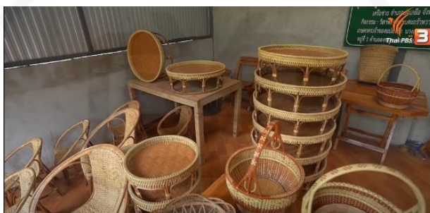
ภาพที่ 19 ผลิตภัณฑ์ที่ทำจากหวายฝาด