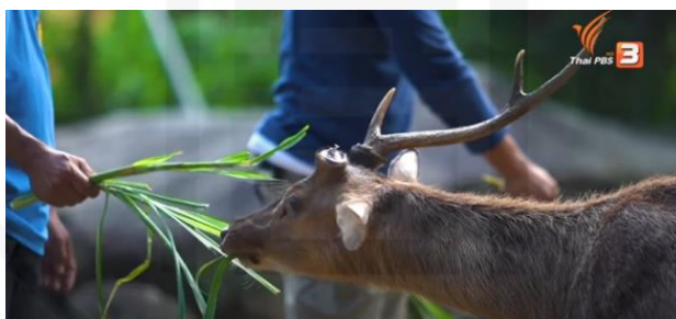
ภาพที่ 23 ป้อนหญ้าให้กวาง