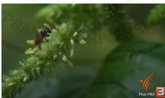
ภาพที่ 7 ผึ้งชาญณรงค์