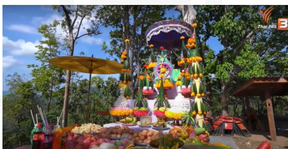
ภาพที่ 32 งานสร้างน้ำพระธาตุเจ้าเจดีย์ศรี