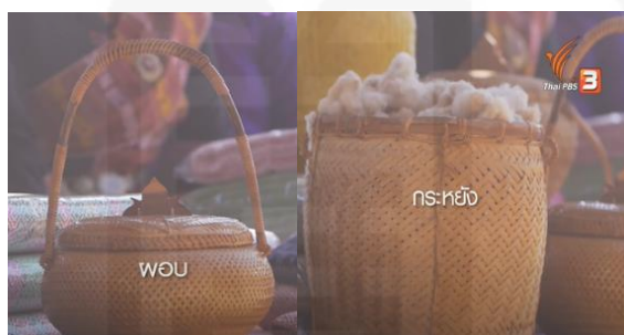
ภาพที่ 15 กระทบกับผอบของภูไท