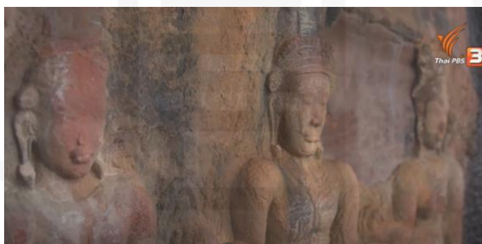
ภาพที่ 21 ภาพแกะสลักนูนต่ำ