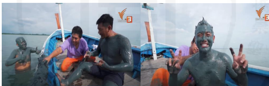
ภาพที่ 30 สปาโคลน