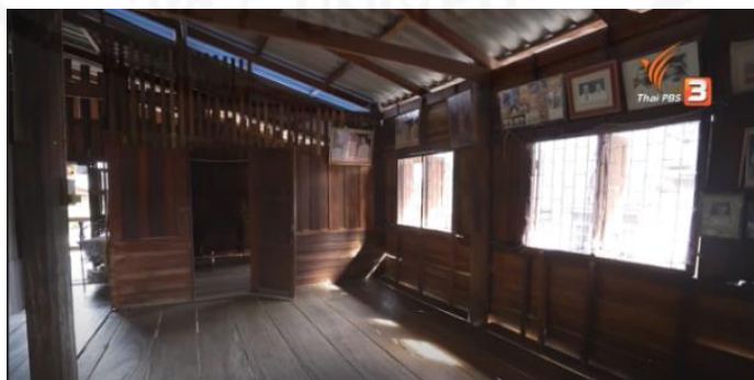
ภาพที่ 1 บ้านเรือนโบราณ