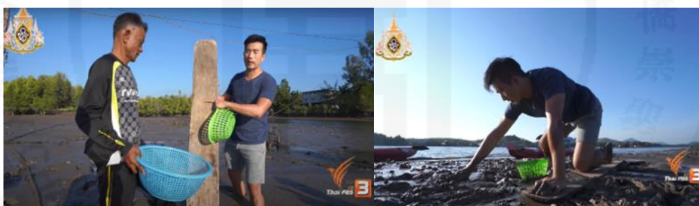
ภาพที่ 18 กระตังถีบ (กระดานเลื่อนหาหอย)