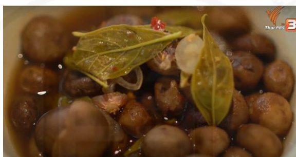
ภาพที่ 3 แกงเห็ดเผาะ