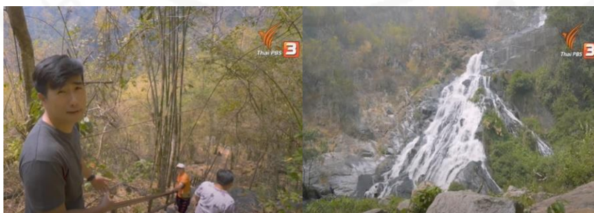
ภาพที่ 31 น้ำตกเต่าดำ