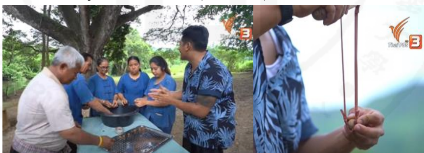
ภาพที่ 35 การทำกิจกรรมปลูกป่าด้วยการยิงกระสุนเมล็ดพันธุ์พืช

ที่มา: https://www.youtube.com/watch?v=nQdoLmzvFX8