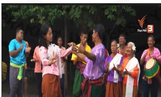
ภาพที่ 12 การเดินรำเหย่ย