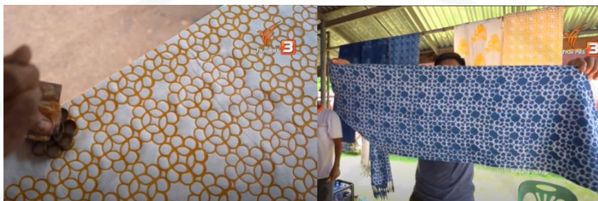
ภาพที่ 42 ลวดลายดอกจิก

ที่มา: https://www.youtube.com/watch?v=s3pnOtC0D9w