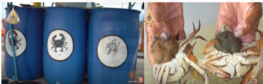
ภาพที่ 38 ธนาคารปู