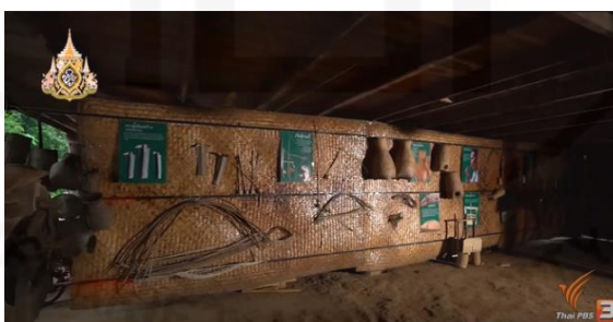
ภาพที่ 41 โฮมสเตย์เชิงวัฒนธรรม