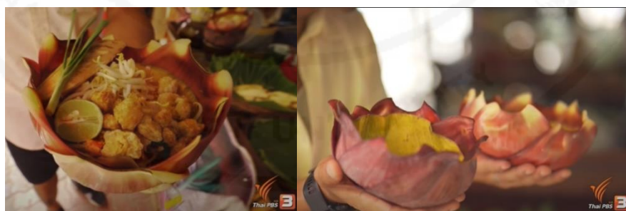
ภาพที่ 39 กระทงที่เอาไว้ใส่อาหารแทนจานกระดาษจานพลาสติก