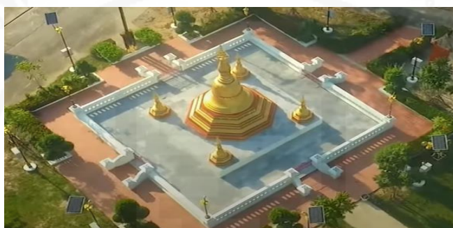
ภาพที่ 8 เจดีย์มูเตา