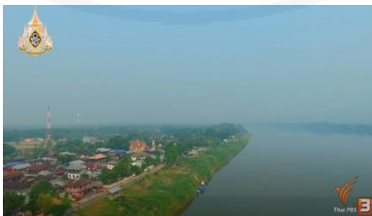
ภาพที่ 24 ชุมชนของบ้านหอคำ จังหวัดบึงกาฬ