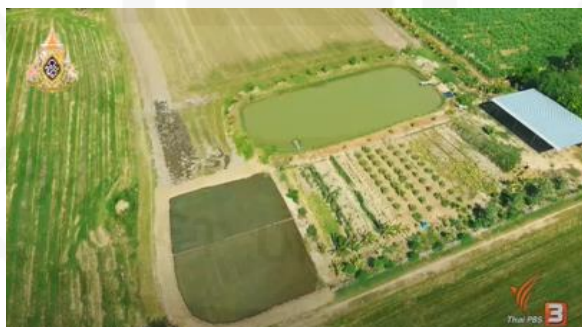
ภาพที่ 34 แนวคิดเรื่องโคกหนองนาโมเดล

ที่มา: https://www.youtube.com/watch?v=Rcia0W7JEkw