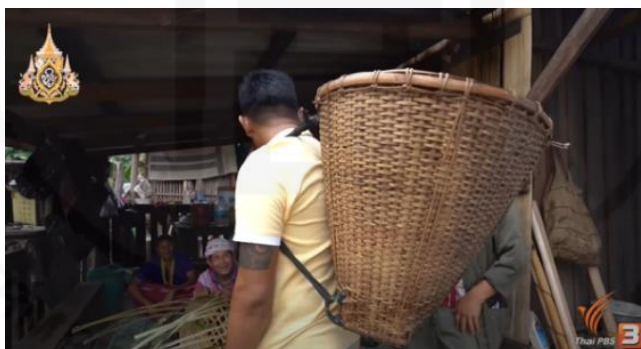
ภาพที่ 16 งานจักสาน