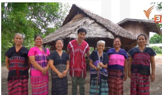
ภาพที่ 27 ชุดการแต่งกายของชาวปกากะญอ