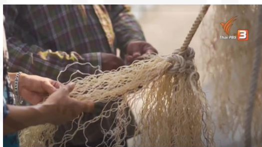
ภาพที่ 37 ทำซั้ง