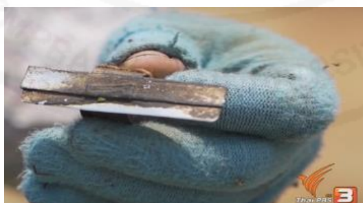
ภาพที่ 17 เล็บเก็บเมี่ยง