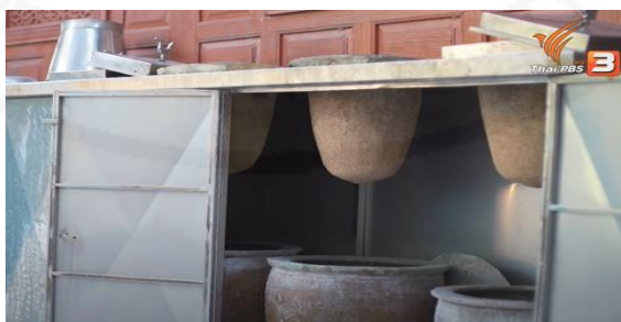
ภาพที่ 29 เครื่องกรองน้ำโบราณ