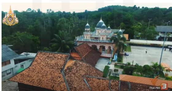
ภาพที่ 26 มัสยิดนัจมุดดิน