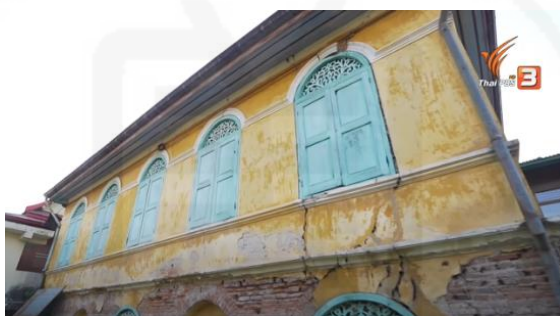
ภาพที่ 11 ภูมิพระอาจารย์มุนนาค