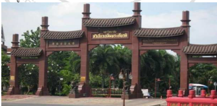
มหาวิทยาลัยหัวเฉียวเฉลิมพระเกียรติ. 2557 : ออนไลน์.