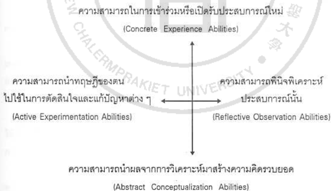
ภาพที่ 1 ความสามารถในการเรียนรู้ของโคลบ (Kolb)

ความสามารถในการเรียนรู้ทั้ง 4 ลักษณะดังกล่าว แตกต่างหรือตรงข้ามกันเป็นคู่ ๆ ดังภาพต่อไปนี้