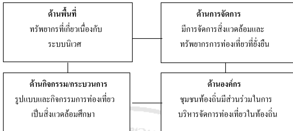
ภาพที่ 2-1 แผนภูมิองค์ประกอบหลักของการท่องเที่ยวเชิงนิเวศ

ทั้งนี้ องค์ประกอบทั้ง 4 ด้านนี้ อาจมีความสมบูรณ์แตกต่างกัน หากแต่ขาดหรือปราศจากด้านใดด้านหนึ่งไปความสมบูรณ์จะลดน้อยลง และอาจต้องปรับเปลี่ยนเป็นการท่องเที่ยวรูปแบบอื่นไป ที่สำคัญคือ การท่องเที่ยวเชิงนิเวศ ไม่ได้ถูกจำกัดด้วยปริมาณหรือกำหนดว่าต้องเป็นการท่องเที่ยวขนาดใหญ่หรือขนาดเล็ก เพราะนักท่องเที่ยวไม่ว่าจะกลุ่มเล็กๆ หรือกลุ่มใหญ่ ก็สามารถทำหลายสิ่งแวดล้อมได้เช่นกัน หากแต่ขึ้นอยู่กับรูปแบบกิจกรรมและขนาดที่เหมาะสมกับพื้นที่ รวมถึงการจัดการที่ดี มีการรักษาสิ่งแวดล้อมอย่างมีประสิทธิภาพ มีการประสานความเข้าใจกับนักท่องเที่ยวและให้ประโยชน์ที่เหมาะสมตามความคาดหวังของนักท่องเที่ยว และตอบสนองนักท่องเที่ยวได้ทุกกลุ่ม ทุกระดับ