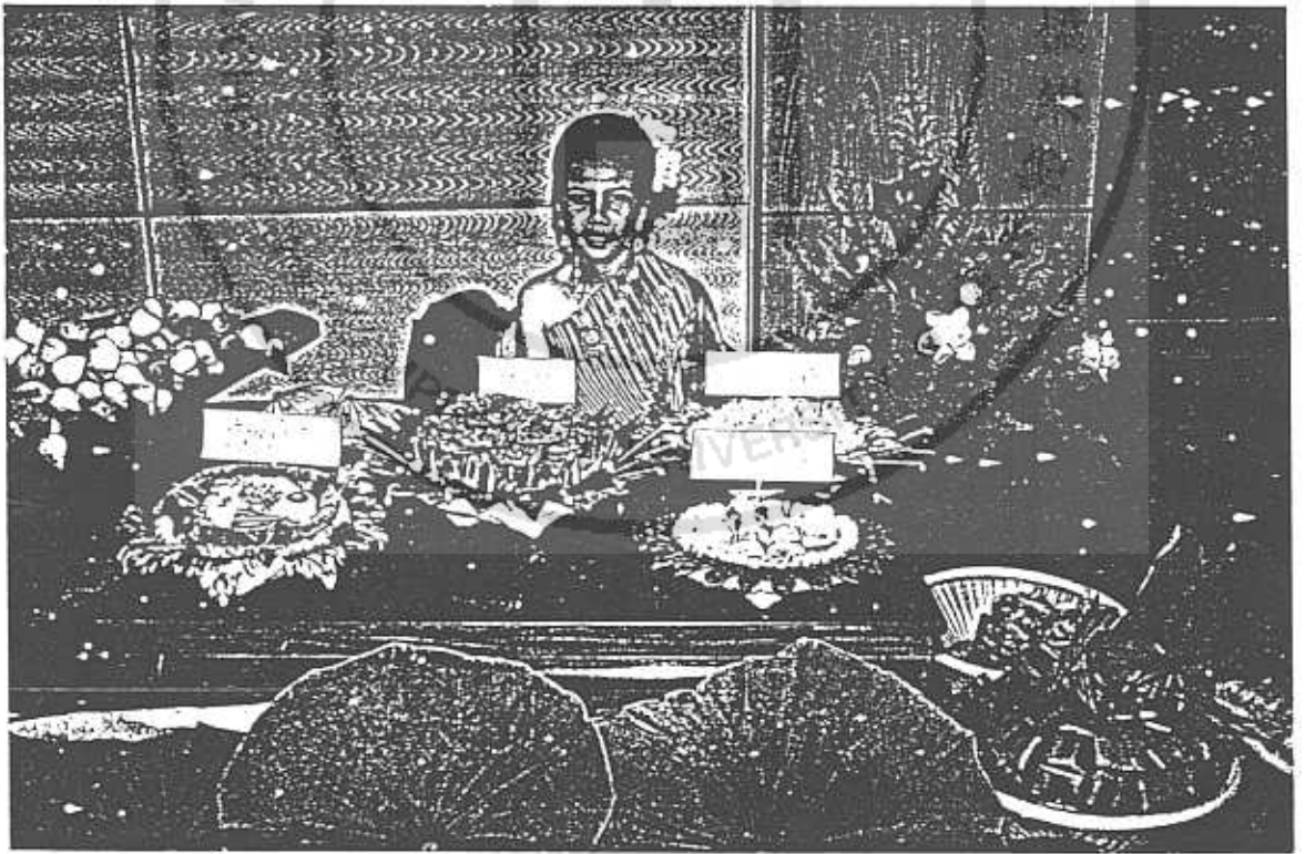
ภาพที่ ๓๙ : ข้าวห่อใบบัว ขนมสาขบัว และขนมกง อำเภอบางพลี