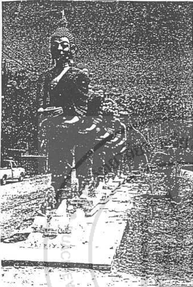
ภาพที่ ๓๖ : รูปปั้นพระกำลังบิณฑบาตร บริเวณหน้าวัดบางพลีใหญ่กลาง