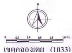
แผนที่เขตคลองเตย (สำนักงานสถิติแห่งชาติ. 2544)