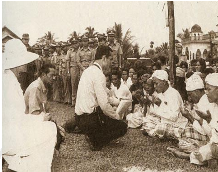
ภาพที่ 5-1 การปฏิบัติพระองค์ต่อราษฎร