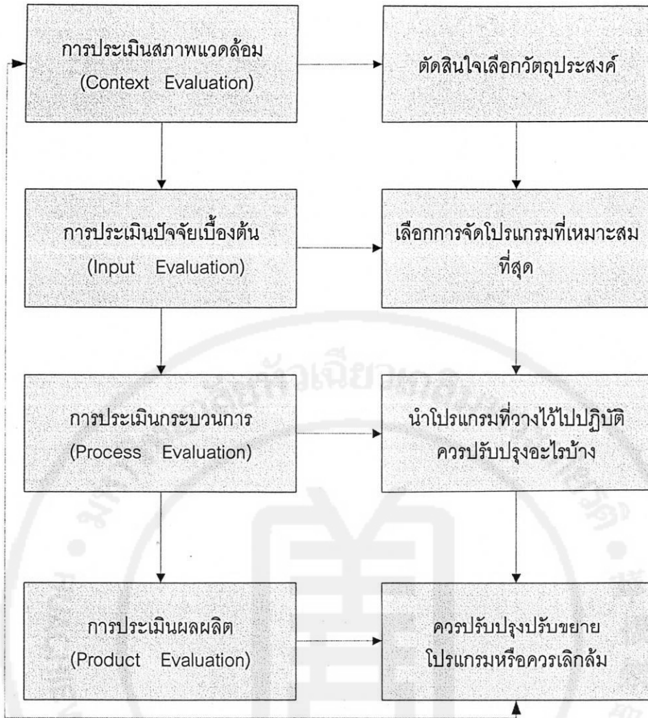
ภาพประกอบ 1 แสดงความสัมพันธ์ระหว่างการประเมินกับการตัดสินใจในแบบจำลองซิปป์