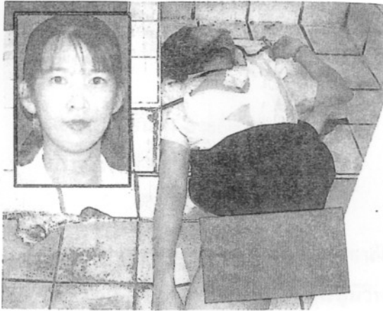
มาตุคาม ▶ นักศึกษามหาวิทยาลัย ศรีสะเกษ หนีงานอดิเรก สำคัญจากการหนีไปรับ อาสา ๒๒๒ (เกาหลี) และ ถูกร่างไปปล่อยตามท้อง สนามภายในซอยสาย ๕๒๒ ย่านวังจันทน์ ตำรวจจับ เพื่อนชายที่ตกใจจึง ฉวยและนำส่งโรงพยาบาล