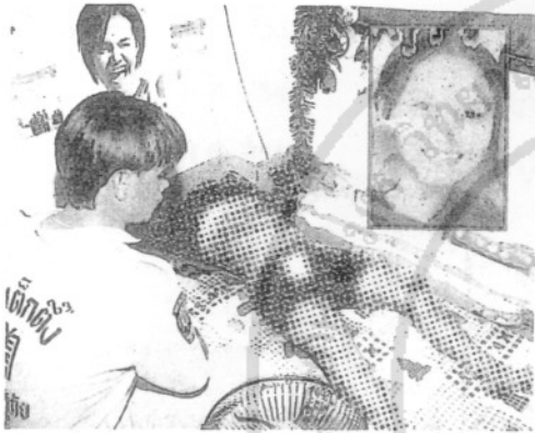
▲ ค่ายปรีศานา น.ร. ๒๒๒ (๒๒๒) ตำรวจจับผู้ต้องหาที่หนีงานอดิเรก และปล่อยปละละเลย ลาทิ้งชั่วคราวของครอบครัว ๖๘ ลาวหลบหนีไปรับอาสาสมัคร และหนีไปอยู่ตามท้องสนาม