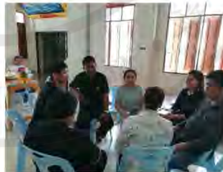
รูปที่ 2 การประชุมปรึกษาหารือและติดตามการดำเนินงานเมื่อวันที่ 28 พฤษภาคม 2560

สื่อสารแบบมีส่วนร่วมกับสมาชิกชมรมผู้สูงอายุ_ ชมรมผู้สูงอายุตำบลศีรชะจรเข้้น้อย เป็นจุดเริ่มต้นที่ได้สื่อสารเรื่อง "การคัดแยกชยะ" "ชยะสร้างรายได้" และ "ธนาการชยะออมทรัพย์" การสื่อสารช่วยขยายประเด็นเรื่อง