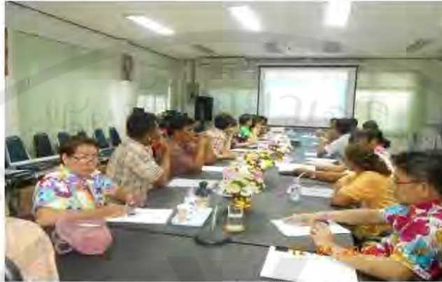
รูปที่ 1 การประชุมระดมสมองเพื่อจัดตั้งธนาคารขยะออมทรัพย์

ของการระดมสมอง คือ การจัดการขยะในชุมชนด้วยรูปแบบธนาคารขยะออมทรัพย์ รูปแบบกิจกรรมธนาคาร การมีส่วนร่วมจัดการขยะในด้านต่าง ๆ คือ มีส่วนร่วมตัดสินใจ มีส่วนร่วมวางแผน มีส่วนร่วมดำเนินการ มีส่วนร่วมรับผลประโยชน์ และมีส่วนร่วมประเมินผล