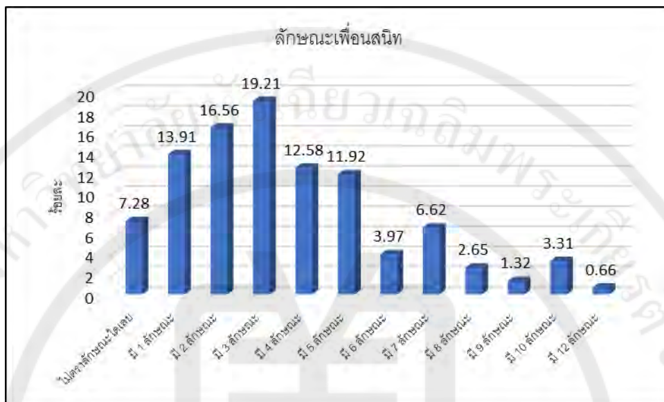
แผนภูมิที่ 4.3 แสดงลักษณะของเพื่อนสนิท

3. ประสบการณ์ด้านการได้รับการสงเคราะห์และคุ้มครองสวัสดิภาพ ได้แก่ เคยเป็นเด็กที่ได้รับการสงเคราะห์ และเคยได้รับการคุ้มครองสวัสดิภาพ (ตารางที่ 4.3)