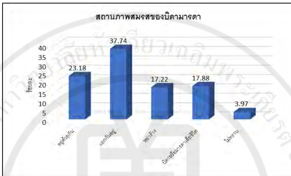
แผนภูมิที่ 4.2 แสดงสถานภาพสมรสของบิดามารดา

2. ลักษณะของเพื่อนสนิท ได้แก่ ลักษณะพฤติกรรมเสี่ยงของเพื่อนสนิทที่เด็กและเยาวชนมีความสนิทสนมด้วย (ตารางที่ 4.2)