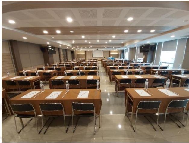
รูปที่ 9 ห้องสัริธาร

3. ห้องพิมานชล ขนาดห้อง 290 ตารางเมตร กว้าง 13.5 เมตร ยาว 17 เมตร สูง 2.5 เมตรจัดห้องประชุมแบบ Classroom รองรับผู้เข้าร่วมประชุมได้ 180 คน ส่วนจัดห้องประชุมแบบ Theater รองรับผู้เข้าร่วมประชุมได้ 250 คน ค่าบริการ ครึ่งวัน ราคาค่าเช่า 7,000 บาท 8.00 - 12.00 น. เกินเวลา 13.00 น. คิดชั่วโมงละ 1,000 บาท เต็มวัน ราคาค่าเช่า 9,000 บาท 8.00 - 17.00 น. เกินเวลา 18.00 น. คิดชั่วโมงละ 1,000 บาท ช่วงเย็น ราคาค่าเช่า 15,000 บาท 18.00 - 24.00 น. เกินเวลา 01.00 น. คิดชั่วโมงละ 1,000 บาท