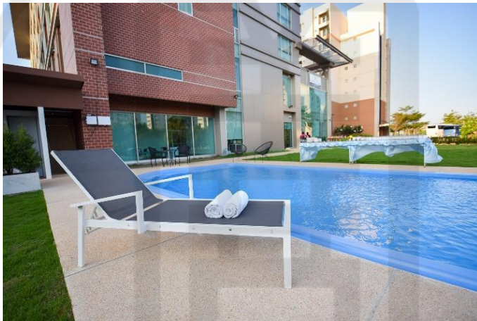
รูปที่ 12 สระว่ายน้ำ

สระว่ายน้ำ เป็นสระว่ายน้ำกลางแจ้ง สวยสะอาดแบบโรงแรม 4 ดาว เหมาะแก่การพักผ่อนสบาย อบอุ่น และบรรยากาศดีมาก ร่มรื่น มองเห็นวิวสระว่ายน้ำจากห้องพัก