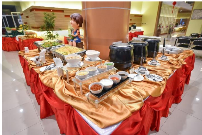
รูปที่ 13 ห้องอาหาร