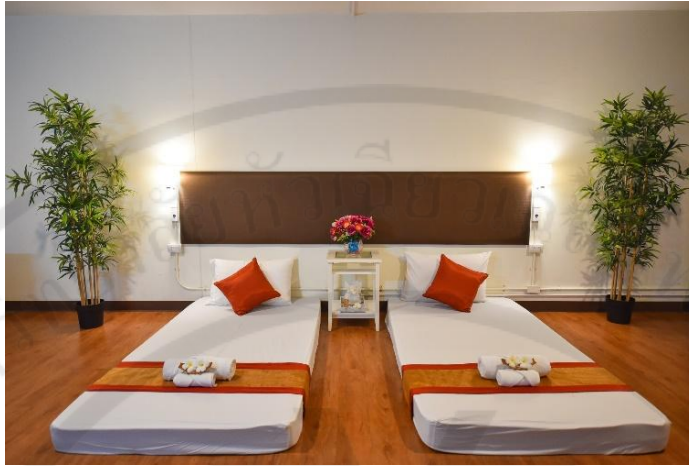
รูปที่ 14 ห้องสปา

มีบริการสปาทั้งในและนอกสถานที่ สำหรับการปรนนิบัติด้วยสปา การปรับสมดุลกายภาพบำบัด การบำบัดแบบองค์รวม รวมถึงการฝึกแบบส่วนตัวกิจกรรมเพื่อสุขภาพอื่น ๆ สำหรับทรีทเมนท์