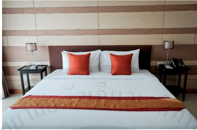
รูปที่ 3 ห้องซูพีเรีย Superior Room (SUP)