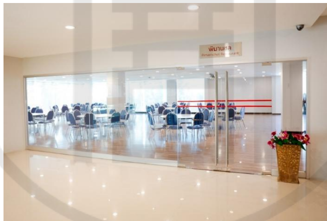
รูปที่ 10 ห้องพิมานชล

3. ห้องพิมานชล ขนาดห้อง 290 ตารางเมตร กว้าง 13.5 เมตร ยาว 17 เมตร สูง 2.5 เมตรจัดห้องประชุมแบบ Classroom รองรับผู้เข้าร่วมประชุมได้ 180 คน ส่วนจัดห้องประชุมแบบ Theater รองรับผู้เข้าร่วมประชุมได้ 250 คน ค่าบริการ ครึ่งวัน ราคาค่าเช่า 7,000 บาท 8.00 - 12.00 น. เกินเวลา 13.00 น. คิดชั่วโมงละ 1,000 บาท เต็มวัน ราคาค่าเช่า 9,000 บาท 8.00 - 17.00 น. เกินเวลา 18.00 น. คิดชั่วโมงละ 1,000 บาท ช่วงเย็น ราคาค่าเช่า 15,000 บาท 18.00 - 24.00 น. เกินเวลา 01.00 น. คิดชั่วโมงละ 1,000 บาท