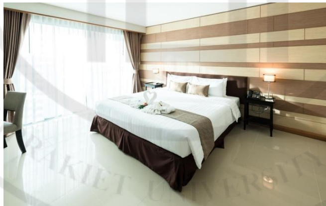
รูปที่ 5 ห้องเอ็กซ์คลูซีฟสวีท Executive Suite (EXS)