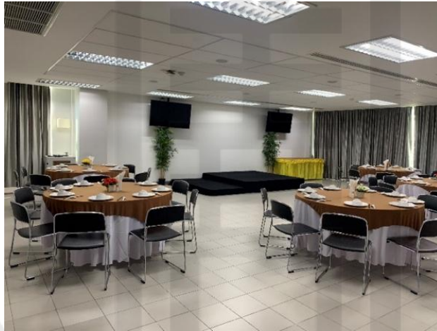
รูปที่ 8 ห้องสิริวารี

1. ห้องสิริวารี ขนาดห้อง 67 ตารางเมตร กว้าง 8 เมตร ยาว 84 เมตร สูง 2.5 เมตร การจัดห้องประชุมแบบ Classroom รองรับผู้เข้าร่วมประชุมได้ 50 คน ส่วนการจัดห้องประชุมแบบ Theater รองรับผู้เข้าร่วมประชุมได้ 60 – 70 คน ค่าเช่า ครึ่งวัน ราคาเช่า 3,000 บาท เวลา 8.00 -12.00 น. เกินเวลา 13.00 น. คิดชั่วโมงละ 1,000 บาท เต็มวัน ราคาเช่า 7,000 บาท เวลา 8.00 -17.00 น. เกินเวลา 18.00 น. คิดชั่วโมงละ 1,000 บาท ช่วงเย็น ราคาเช่า 9,000 บาท เวลา 18.00 - 24.00 น. เกินเวลา 01.00 น. คิดชั่วโมงละ 1,000 บาท