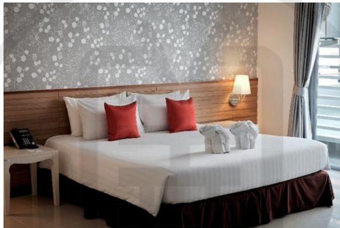
รูปที่ 4 ห้องดีลักซ์ Deluxe Room (DLX)