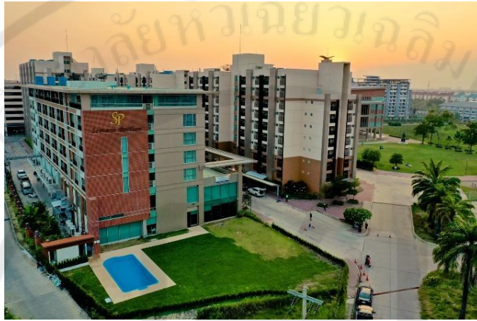
รูปที่ 1 ศูนย์ฝึกปฏิบัติศรีวารี พาวิลเลียน 1

บริการ มีความรู้ความสามารถทางวิชาการและวิชาชีพด้านการโรงแรมและธุรกิจบริการที่พักแรม การปฏิบัติการบริการและสามารถนำความรู้ประสบการณ์ฝึกงาน ไปปรับใช้ในการทำงานได้อย่างเหมาะสม พร้อมก็สามารถประกอบอาชีพในธุรกิจโรงแรม ธุรกิจอื่น และยังเป็นที่ยอมรับของมหาวิทยาลัยหัวเฉียวเฉลิมพระเกียรติ ซึ่งตั้งอยู่ในมหาวิทยาลัยหัวเฉียวเฉลิมพระเกียรติ แห่งที่ 2 (มฉก. 2) ซอยวัดศรีวารีน้อย ถนนบางนา-ตราด กม.18 ตำบลบางโฉลง อำเภอบางพลี สมุทรปราการ 10540 โทรศัพท์ 02-713-8181 โทรสาร 02-713-8187 เว็บไซต์ www.srivareepavilion.com