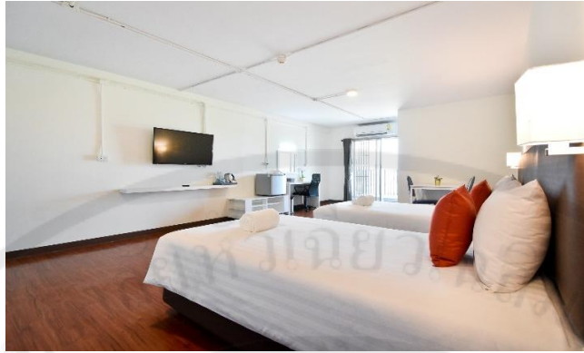
รูปที่ 6 ห้องสแตนดาร์ด Standard Room (STD)

2. ศูนย์ฝึกปฏิบัติศรีวารีย์ พาวิลเลียน (ตึก SP2) มีทั้งหมด 66 ห้อง ห้องสแตนดาร์ด Standard Room (STD)