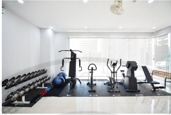
รูปที่ 11 ห้องฟิตเนส

สระว่ายน้ำ เป็นสระว่ายน้ำกลางแจ้ง สวยสะอาดแบบโรงแรม 4 ดาว เหมาะแก่การพักผ่อนสบาย อบอุ่น และบรรยากาศดีมาก ร่มรื่น มองเห็นวิวสระว่ายน้ำจากห้องพัก