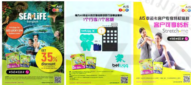
图 1-7 关于优惠和特权的信息

AIS 举办促销活动，以促进针对中国游客的 SIM 卡销售，当以 160、299、599 的价格购买旅行 SIM 卡时，中国游客可以享受来自 AIS 合作商家的优惠，而且将有特权购买 AIS 与合作伙伴合作的产品或服务，如下：“曼谷海洋生物馆”是一个地下水族馆在暹罗百丽宫百货公司，中国游客喜欢参观、“杜莎夫人蜡像馆”是一家蜡像馆拥有众多知名人物的独家制作权、“Bellugg 服务”是一种服务从机场到游客酒店的行李运送服务、“Let's Relax 和 Stretch me 服务”是一种按摩服务，有两种类型是水疗按摩和放松按摩服务，中国游客非常喜欢泰国的按摩、“Beauty buffet 和 Beauty cottage 商店”是一家化妆品店，是中国人更喜欢回国购买的产品，并“Auntie Ann 和 Mister Donut 饼店”等。