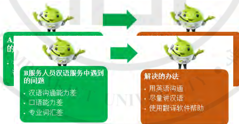
图 2-1 A 汉语服务人员遇到的问题和解决的办法

从图 2-1 中可知，A 汉语服务人员遇到的问题是游客讲得太快，听不清楚和难以理解而选择解决的办法是使用程序来帮助翻译交流中的语言。