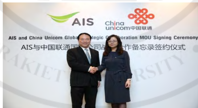
图 1-8 AIS 公司集团宣布与中国主要移动运营商中国联通进行双边合作

2019 年 3 月 29 日，AIS 公司集团宣布与中国主要移动运营商中国联通进行双边合作，(如图 1-8 所示) 以增强针对国内外用户的服务能力，通过共同扩大泰国和中国之间的网络服务范围它为来自两国的客户提供广泛的服务。包括标准的售后服务为希望连接到中国的网络的企业客户提供服务，并进入中国大市场，它另外还可以为希望连接到泰国网络的中国用户提供支持。这将提高 AIS 公司集团的区域服务竞争力，从而更有效地为国内外客户提供服务。在 AIS 公司集团与中国联通的合作下，包括国际连通性，数据中心，云，物联网，旅游大数据，移动游戏服务和支付网关等。