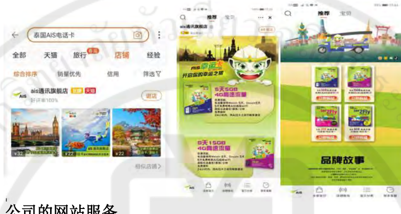
图 1-4 应用程序淘宝上的 AIS 官方商店页面

目前 AIS 电信公司已经通过中文网站电子商务和社交媒体为中国游客扩展了分销渠道和 SIM 卡促销。这将为中国游客带来极大的便利,因为中国游客可以轻松访问产品信息。网站开设了询问和回相关产品、付款和交付等问题的渠道。AIS 移动通讯公司扩大了对中国游客 SIM 卡的分销渠道,建立了中国电子商务网站和与中国游客沟通的中国社交媒体。AIS 的线上服务项目如下:淘宝、微信、微博等。