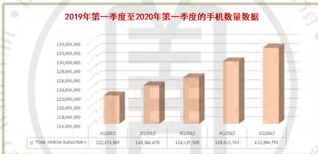
图 1-1 2019 年第一季度至 2020 年第一季度的手机数量数据

在 2020 年第一季度，泰国的移动电话用户数量稳步增长。拥有 132,594,791 手机号码，与在 2019 年第一季度相比，手机数量仅为 122,173,569 增长了 7.86%。服务用户数量的增加，这部分原因是泰国广播及电信委员会(NBTC)拍卖了不同频段的频谱，以提供不同频段的频谱导航，并开发技术并提高向用户提供服务网络的效率。