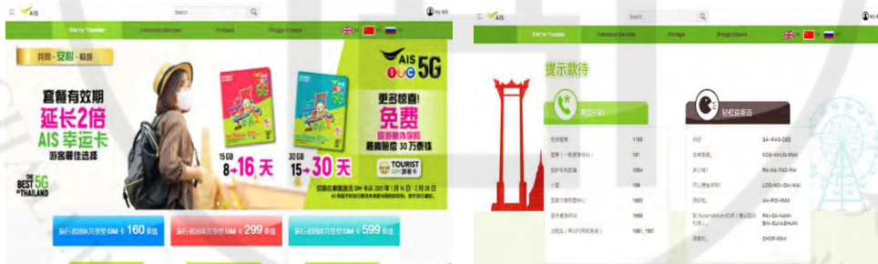
图 1-5 在泰国 AIS 移动通讯的网站

AIS 公司的中文网站上为中国游客提供了有关电话卡的信息,上网后可以选择英语,俄语和中文。如果选择中文,则所有信息都显示中文。在中文网站的内容中包含关于互联网速度的信息、套餐价格、优惠、SIM 卡注册方法和微信充值方法等。在 AIS 网站上显示各种服务费。例如电话费、网上费、发短信和回国电话等,以及在网站页面上还显示泰国的紧急电话号码,以便在紧急情况时通知中国游客。网站上还有简短的泰语词汇,帮助来泰国中国游客使用。