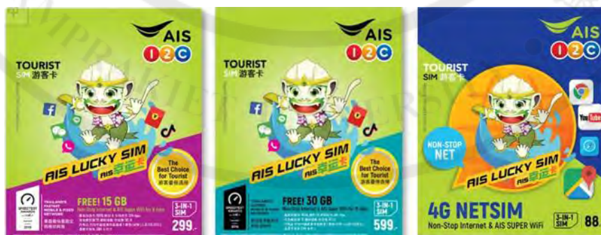
图 1-3 关于 SIM 游客卡

泰国有大量中国游客来泰国旅游,因此 AIS 已为中国游客发布了旅行者专用 SIM 卡产品,为使中国游客在泰国期间尽享通信便利。AIS 有多种套餐满足游客在泰国期间的通讯需要,还有针对中国游客的优惠,呼叫中国大陆和中国香港的特价话费仅为 1 泰铢/分钟,分为 5 种类型。如下:游客 SIM 卡 49 泰铢/384kbps 的互联网、游客 SIM 卡 160 泰铢/5GB、游客 SIM 卡 299 泰铢/15GB、游客 SIM 卡 599 泰铢/30GB 并联网 SIM 卡 88 泰铢/1 Mbps 等。