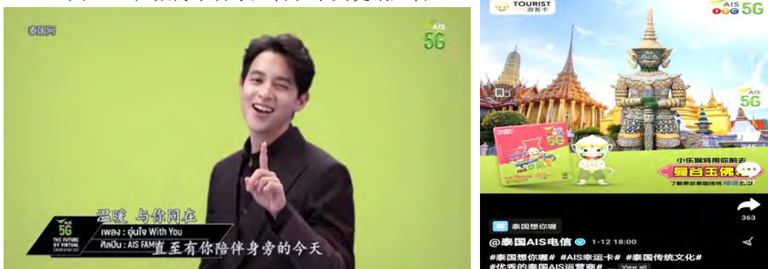
图 1-6 在微博中音乐广告和中文促销广告

AIS 的中文网页在微博上有一个视频是 AIS 移动通讯公司的音乐广告。该广告说明 AIS 移动通讯公司已开通了 5G 服务。视频中显示中文字幕,方便中国客户了解广告的内容。此外 AIS 移动通讯公司在微博上还刊登了一个简短的中文广告,以向中国游客宣传 SIM 卡类型。展示方法将通过强调泰国独特性或泰国旅游景点,例如、泰国的寺庙、泰国大海和泰国甜点等。