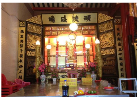
ภาพที่ 6 องค์ไต้ซือเอี้ยะ

ที่มา: Zhang Xiaojing (กัลยาณี) ถ่ายเมื่อวันที่ 8 พฤษภาคม 2556 ที่ศาลเจ้าไต้ฮงกง