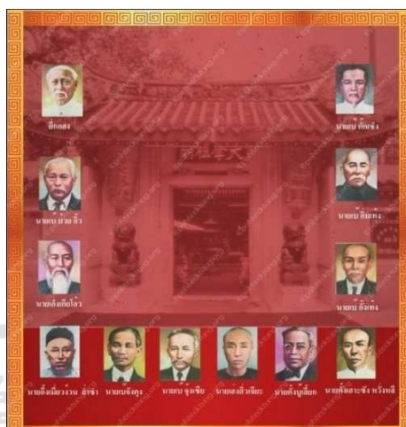
ภาพที่ 2 กลุ่มพ่อค้าชาวจีนโพ้นทะเล 12 คนซึ่งร่วมกันก่อตั้ง “คณะเก็บศพไต้ฮงกง”