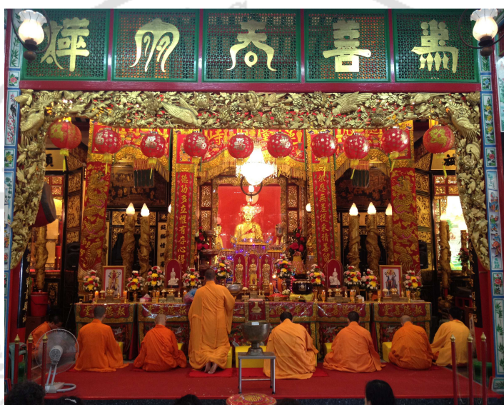
ภาพที่ 9 พิธีสวด “พะเก่ง”