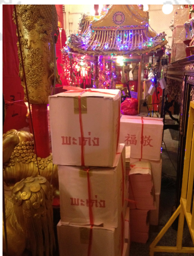
ภาพที่ 10 กล่องใบพะเก่ง

ที่มา: Zhang Xiaojing (กัลยาณี) ถ่ายเมื่อวันที่ 7 กุมภาพันธ์ 2557 ที่ศาลเจ้าไต้ฮงกง