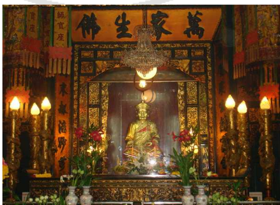
ภาพที่ 4 รูปจำลองหลวงปู่ใต้ฮง