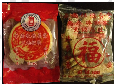
ภาพที่ 19 ขนมจันอับ

ที่มา: Zhang Xiaojing (กัลยาณี) ถ่ายเมื่อวันที่ 31 มกราคม 2557 ที่มูลนิธิป่อเต็กตึ้ง