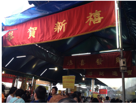
ที่มา: Zhang Xiaojing (กัลยาณี) ถ่ายเมื่อวันที่ 31 มกราคม 2557 ที่มูลนิธิป่อเต็กตึ๊ง