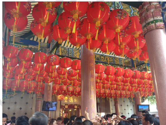
ที่มา: Zhang Xiaojing (กัลยาณี) ถ่ายเมื่อวันที่ 31 มกราคม 2557 ที่มูลนิธิป่อเต็กตึ๊ง