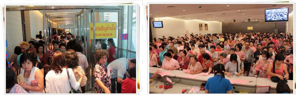
ภาพที่ 17 ภาพบรรยากาศผู้ที่มาลงชื่อทำบุญ "พะเก่ง"