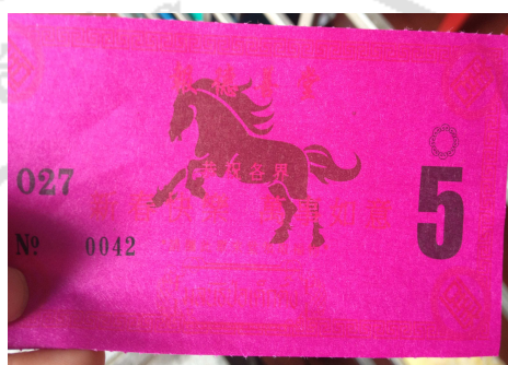
ภาพที่ 18 ตัวแลกขนมจันอับ