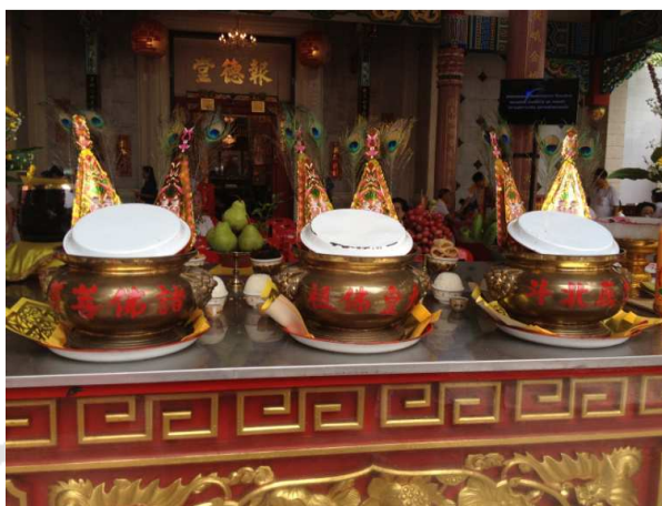
ภาพที่ 11 กระจ่างรูปใช้ในงานกินเจ