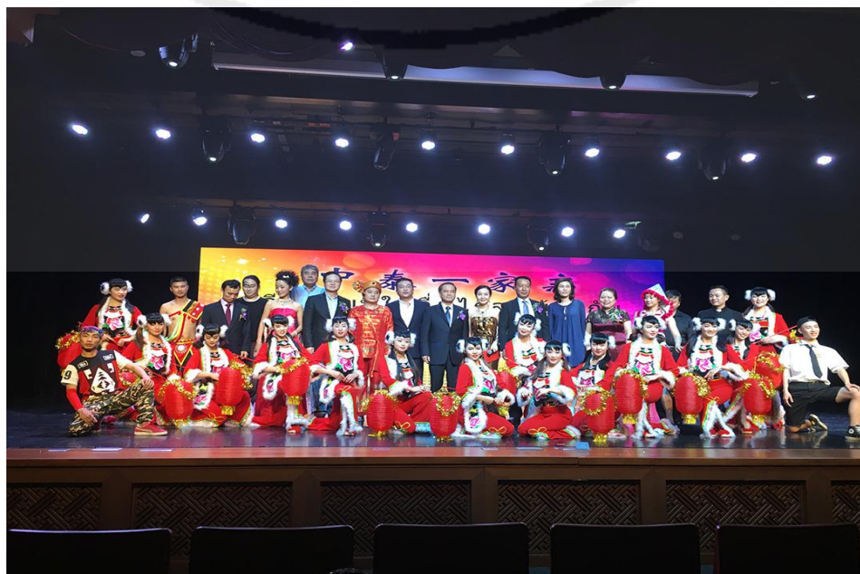
ภาพที่ 2 การจัดงานแสดงศิลปะประจำจีน “จีน-ไทย ใช้อื่นไกล พี่น้องกัน”

จากการสัมภาษณ์แสดงให้เห็นว่า สมาคมธุรกิจปักกิ่งมีการสืบทอดวัฒนธรรมจีน เชิงศิลปะในสังคมไทย ซึ่งได้เชิญสถาบันการศึกษาที่มีชื่อเสียงด้านการแสดงของจีนมาแสดงที่ ประเทศไทย เพื่อส่งเสริมการแลกเปลี่ยนวัฒนธรรมทั้งไทยและจีน การแสดงการเต้นระเบ่าครั้งนี้ มี ระเบ่าของมณฑลยูนนาน เช่น ระเบ่านกยูงมงคล ยังมีระเบ่าที่สืบทอดวัฒนธรรมวันตรุษจีน เช่นระเบ่า โคมแดง ระเบ่าเหล่านี้มีความหมายเป็นสิริมงคล แสดงให้เห็นว่ากิจกรรมวัฒนธรรมด้านการแสดงที่ สมาคมฯ จัดขึ้นมาได้สืบทอดวัฒนธรรมการแสดงอันยิ่งใหญ่ของจีนซึ่งเป็นชุดการแสดงที่สื่อ ความหมายที่ดีให้กับผู้ชมทั้งที่เป็นคนจีนและคนไทยเชื้อสายจีนด้วย