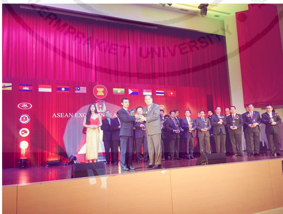
ภาพที่ 7 การเข้าร่วมกิจกรรมของสมาคมส่งเสริมการค้าอาเซียน

จากการสัมภาษณ์แสดงให้เห็นว่าสมาคมนักธุรกิจปักกิ่ง ประเทศไทยเคยเข้าร่วมกิจกรรม และได้รางวัลดีเด่นของสมาคมส่งเสริมการค้าอาเซียน ซึ่งเป็นสมาคมของกลุ่มคนไทยและชาวต่างประเทศ แสดงว่าสมาคมฯ นอกจากมีความสัมพันธ์อันดีกับสมาคมฯ ชาวจีนหรือว่าชาวไทย เชื่อสายเงินในประเทศไทยแล้ว ยังมีความสัมพันธ์อันดีกับสมาคมฯ ของกลุ่มคนไทยและชาวต่างประเทศ ซึ่งส่งผลต่อการส่งเสริมการทำธุรกิจระหว่างกันมากยิ่งขึ้น