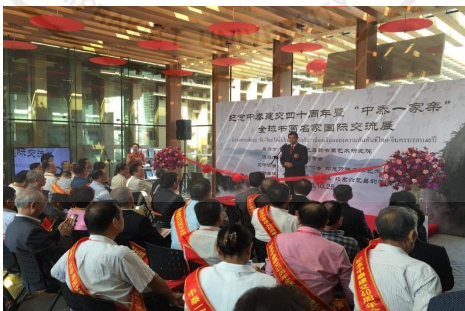
ภาพที่ 3 บรรยากาศการจัดนิทรรศการศิลปะ “จีน-ไทย ใช้อื่นไกล พี่น้องกัน”

จากการสัมภาษณ์แสดงให้เห็นว่า สมาคมธุรกิจปักกิ่ง ประเทศไทยมีการจัดนิทรรศการศิลปะจีน ได้เชิญนักวาดพู่กันจีนที่มีชื่อเสียงมาแสดงและแลกเปลี่ยนความคิดเห็นอีกด้วย ทำให้คนไทยที่นิยมภาพวาดและพู่กันจีนเข้ามาร่วมด้วย แสดงให้เห็นว่าการจัดนิทรรศการศิลปะจีนได้ส่งเสริมการเผยแพร่วัฒนธรรมจีนโบราณให้คนไทยได้รู้จัก