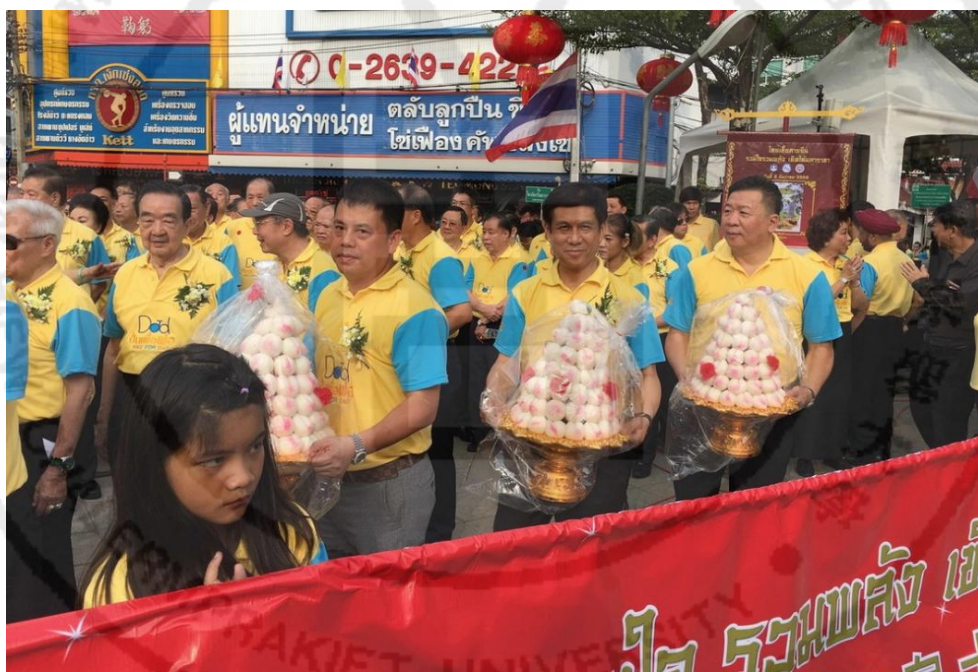
ภาพที่ 4 งานเทศกาลไหมหาราชา เฉลิมพระชนมพรรษา 88 พรรษา