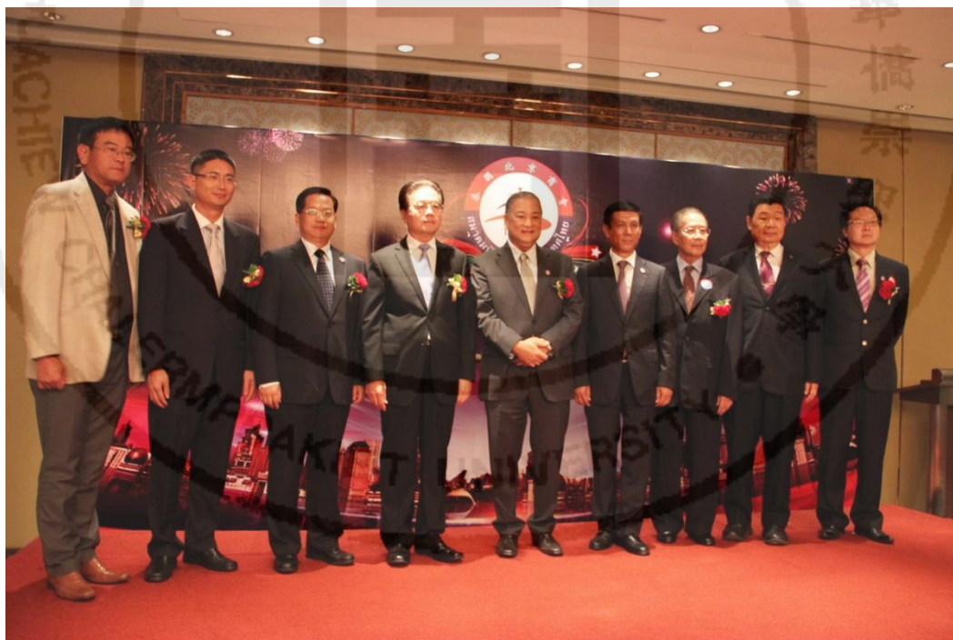
ภาพที่ 10 งานเฉลิมฉลองการก่อตั้งสมาคมนักธุรกิจปักกิ่ง ประเทศไทยครบรอบ 1 ปี

สมาคมนักธุรกิจปักกิ่ง ประเทศไทย ได้เดินทางไปเยือนผู้นำของรัฐบาลไทย ดังที่ Qi Ming รองเลขาธิการฝ่ายภาษาจีนของสมาคมนักธุรกิจปักกิ่ง ประเทศไทย (21 กรกฎาคม 2559 : สัมภาษณ์) ได้ให้สัมภาษณ์เกี่ยวกับความสัมพันธ์ระหว่างสมาคมนักธุรกิจปักกิ่ง ประเทศไทยกับรัฐบาล ไทย-จีนไว้ว่า