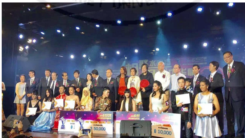
ภาพที่ 1 การจัดกิจกรรมการประกวดการแข่งขันร้องเพลงจีนรุ่นเยาวชน

จากการสัมภาษณ์แสดงให้เห็นว่า สมาคมนักธุรกิจปักกิ่ง ประเทศไทยมีการจัดกิจกรรมการประกวดการแข่งขันร้องเพลงจีนรุ่นเยาวชน ผู้สมัครเข้าประกวดต้องใช้ภาษาจีนกลาง (แมนดาริน) ในการขับร้องเท่านั้น ส่วนการเลือกเพลงจีน ผู้ประกวดได้เลือกเพลงที่นิยมของคนไทย เช่นเถียนมีมี พ่อจ๋าย่าร้องให้ เป็นเพลงจีนที่เกือบคนไทยทุกคนร้องได้ และเนื้อเพลงได้สืบทอดวัฒนธรรมจีน แสดงให้เห็นว่าสมาคมฯ มีการจัดกิจกรรมที่สืบทอดด้านภาษาจีนกลาง และวัฒนธรรมเพลงจีนอีกด้วย