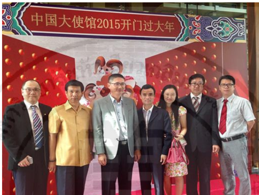
ภาพที่ 5 กิจกรรมงานเฉลิมฉลองวันตรุษจีนของสถานเอกอัครราชทูตสาธารณรัฐประชาชนจีนประจำราชอาณาจักรไทย

สรุปได้ว่าสมาคมนักธุรกิจปักกิ่ง ประเทศไทยมีการเข้าร่วมกิจกรรมเชิงวัฒนธรรมที่จัดขึ้นโดยองค์กรจีน หรือสมาคมฯ จีนอื่น ๆ ในประเทศไทย กิจกรรมเหล่านี้มีการสืบทอดวัฒนธรรมจีนในด้านศิลปะ ด้านประวัติศาสตร์ ด้านอาหารการกิน ด้านการแต่งกาย ด้านวิธีการฉลองวันสำคัญของสาธารณรัฐประชาชนจีน