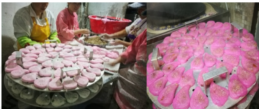
ภาพที่ 23 การจัดเตรียมของเซ็งไหว้ในเทศกาลเซ็งเม้งของชาวจีนแต้จิ๋ว

เซ็งเม้ง และมีกับข้าวที่บรรพบุรุษชอบ ด้วยอาหารน้ำ 1 อย่าง เป็น หุปลาฉลามเป็นอาหารที่คุณพ่อชอบ...”