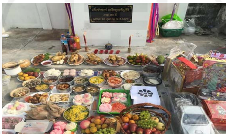
ภาพที่ 18 การจัดวางของเซ่นไหว้แบบชุดใหญ่ของชาวไทยเชื้อสายแต้จิ๋ว

“...ส่วนกรณีการไหว้ที่สุสานจากบรรพบุรุษที่ทำกันมาเราก็ทำกันต่อได้แก่ ข้าวสวย 3 ถ้วย ชา 5 ถ้วย ส้ม 5 ลูก หากจะมีของหวานก็ควรเลือกเป็น 5 ชั้น หรือ 5 ชนิด เช่นกัน อันเป็นตัวแทนของธาตุทั้ง 5 คือ ดิน น้ำ ทอง ไม้ ไฟ ครบ สำหรับการตกแต่งสุสานนั้นอาจใช้กระดาษม้วนสายรุ้ง โดยสุสานคนเป็นให้ใช้สายรุ้งสีแดง ส่วนสุสานคนตายสามารถใช้สายรุ้งสีอะไรก็ได้แต่ห้ามปักธงลงบนหลังเต่า เพราะถือว่าเป็นการทิ่มแทงหลุมและบางความเชื่อถือว่าเป็นการทำให้หลังคาบ้านของบรรพบุรุษเสียหาย แล้วมีการไหว้เจ้าที่เป็นการให้เกียรติและขอบคุณที่ช่วยคุ้มครองดูแลครับ...”