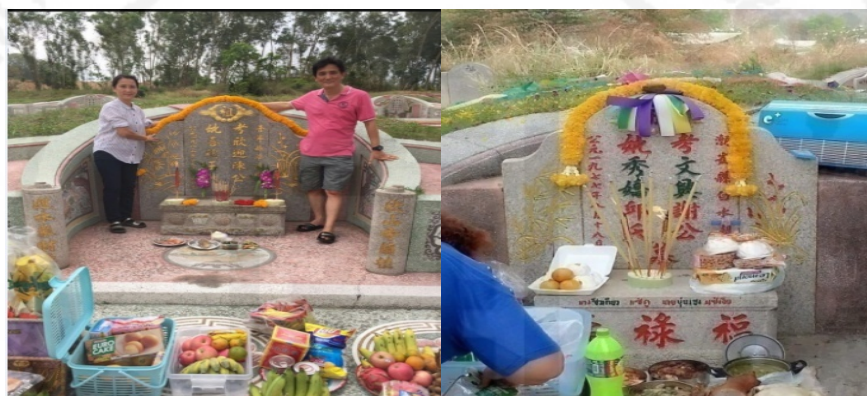
ภาพที่ 17 รูปแบบการจัดวางของเซ่นไหว้ในเทศกาลเซ็งเม้งของแต่ละบ้าน

“...สำหรับการวางของไหว้เซ็งเม้ง เช่น อาหาร เช่น เส้นหมี่ สำหรับาย ฟองเต้าหู้ เห็ดหอม และวุ้น กุยช่าย ขนมเทียน ขนมถ้วยฟู ขนมอี๋ ขนมขง ขนมเทียน ผลไม้ เช่น สาลี่ องุ่น กล้วยดิบสีเขียว เหล้าหรือน้ำดื่ม ข้าวสวย ฐูป เทียน ดอกไม้สด กระดาษเงิน กระดาษทอง อย่างไรก็ตาม จริง ๆ แล้วไม่ได้มีแบบแผนอย่างเดียว ขึ้นอยู่กับธรรมเนียมปฏิบัติของแต่ละบ้าน แบบนี้เป็นรูปแบบของการจัดวางที่บ้านสืบทอดกันมาค่ะ...”