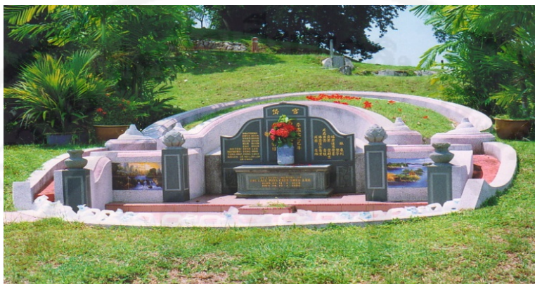
ภาพที่ 39 การปลูกหญ้ารอบ ๆ สุสานบรรพบุรุษ

รอบ ๆ สุสานบรรพบุรุษ ข้อเท็จจริงแล้วไม่ใช่ปลูกดอกไม้มีรากของ ไม้ใหญ่จะขอนไชลงใต้ดินและแผ่อก มีความหมายด้านผู้สาว ถ้า ปลูกหญ้าจะดีกว่า...”