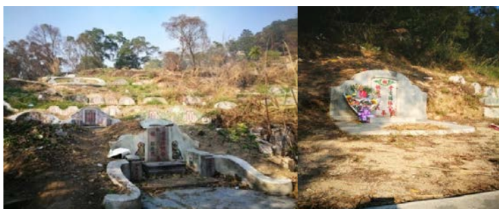
ภาพที่ 28 สุสานบนภูเขาในเมืองซัวเถา

“...เทศกาลเซ็งเม้งไม่ใช่แค่ปิดกวาดหลุมศพอย่างเดียว การไหว้สุสานบรรพบุรุษในเทศกาลเซ็งเม้งเป็นประเพณีและวัฒนธรรมสำคัญมากสำหรับแต่จิว ยังสืบทอดกันมาจนถึงปัจจุบันนี้ เพียงแต่ว่าพิธีการเซ่นไหว้จะเรียบง่ายกว่าสมัยก่อน มีรูปแบบทั้งการไหว้ของแต่ละครอบครัว และการไหว้ที่จัดโดยองค์กรและหมู่คณะต่าง ๆ โดยผู้คนจะพากันไปไหว้สุสานของวีรบุรุษที่สละชีพเพื่อญาติพี่น้อง ได้มาพบกัน โดยมีกิจกรรมปรับแต่งฮวงซุ้ยสวยงาม ปิดกวาด ดายหญ้า ถอนหญ้าบนหลุมศพ ปรับพื้นและซ่อมแซมฮวงซุ้ย เช่น การเติมดินหรือปรับให้หลุมศพโค้งมนหรือดินที่เซาะลงมาเก็บให้เรียบร้อย มีการปลูกต้นไม้มงคลเพื่อแสดงความไว้อาลัย ถ้ารุ่นเราไม่ทำแบบอย่างหรือไม่ได้บอกรุ่นหลัง ๆ เขาไม่เข้าใจ แม้ว่ารุ่นเก่า ๆ ก็พูดคุยไม่มีสาระสำคัญเกี่ยวกับมรดกทางวัฒนธรรมและการพัฒนาได้กลายเป็นที่หรูหรา (Luxury)...”