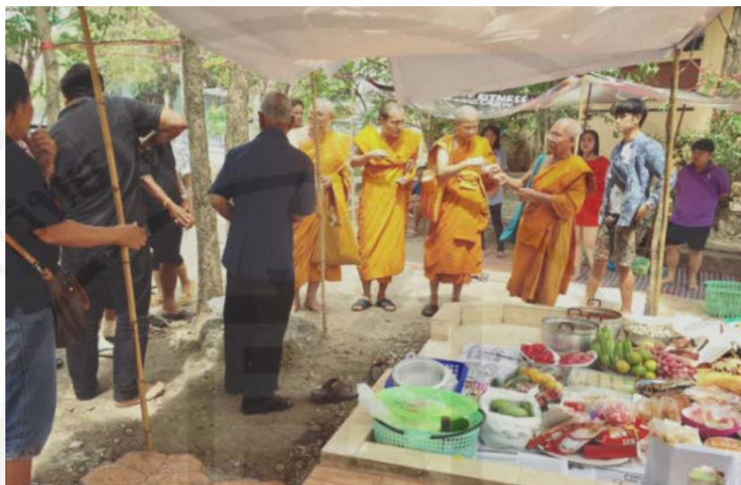
ภาพที่ 5 ความเชื่อเกี่ยวกับบรรพบุรุษและศาสนาพุทธคู่กัน

“...ฉันนับถือศาสนาพุทธ เพราะศาสนาพุทธเป็นศาสนาที่ดี สอนเราเป็นคนดี ช่วยเหลือชีวิตของเรานั้นดีขึ้น แต่ตอนโตขึ้นได้เรียนรู้มากขึ้น...”