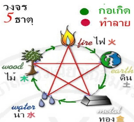
ภาพที่ 32 หง่อเห็ง หรือปฏิกิริยา 5 ธาตุ (五行)