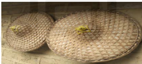
ภาพที่ 37 เครื่องประดับ Li kwai ที่ใช้ในเทศกาลเซ็งเม้ง