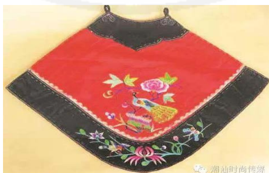
ภาพที่ 38 ชุดแต่งกายของเด็กหญิงของจีนแต่จี