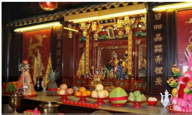
ภาพที่ 10 ความเชื่อจิตวิญญาณและเทพเจ้า

“...ชาวแต่จิวมีความเชื่อของตัวเอง พวกเราเชื่อว่ามีเทพเจ้าแห่งฟ้า เทพเจ้าแห่งดิน เทพเจ้าบรรพบุรุษ จะคอยปกป้องและคุ้มครองพวกเราให้อยู่ดีมีสุข ดังนั้นเมื่อถึงวันสำคัญเราก็จะจัดพิธีบูชาฟ้า บูชาดิน และบูชาบรรพบุรุษ ขอบุคคลที่พวกเขาคุ้มครองเรามาตลอดแล้วจะมีชีวิตหลังความตาย...”