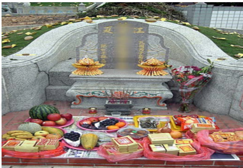
ภาพที่ 30 การจัดตั้งสิ่งของเซ่นไหว้ในเทศกาลเซ็งเม้ง เมืองฉัวเถา สาธารณรัฐประชาชนจีน