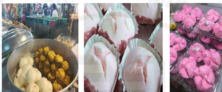
ภาพที่ 13 การจัดเตรียมของเซ่นไหว้สำหรับประกอบพิธีกรรมเซ็งเม้งของชาวไทยเชื้อสายแต้จิ๋ว

“...รูป เทียน เครื่องกระดาษประเภทเงินทอง ของใช้ กล้วย ดอกไม้ อาหารคาว หวาน ตามความเชื่อประเพณีของชาวไทยเชื้อสายแต้จิ๋วส่วนใหญ่เป็นขนมถ้วยฟู ฮวกก้วย และขนมอี๋ ผลไม้ เช่น องุ่น กล้วยหอม สับปะรด แอปเปิ้ล เกล็ดด ขนุน ทับทิม ส้ม สาเล่ ลินจี ลำไย น้ำชา ข้าวสวย และเนื้อสัตว์...”