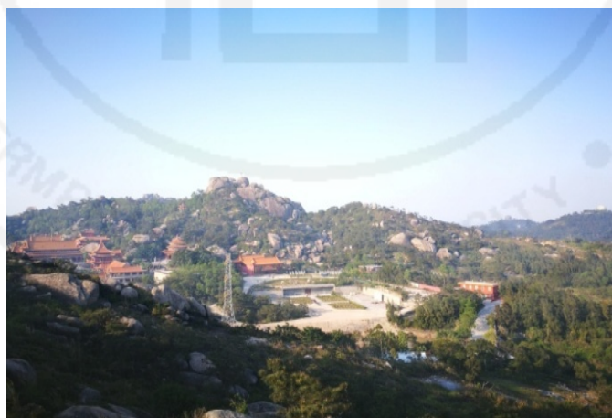
ภาพที่ 9 ความเชื่อเรื่องฮวงจุ้ย มีภูเขาอยู่ด้านหลังสุสาน ชิงหยิน (青云岩)