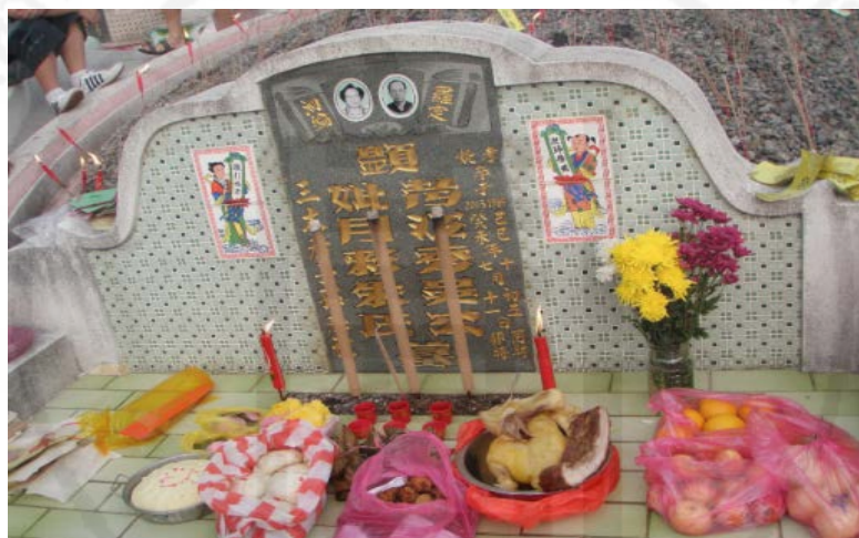
ภาพที่ 31 การจัดวางของเซ่นไหว้ของชาวแต้จิ๋วในเมืองซัวเถาตามธรรมเนียมที่นิยมในอดีต

องุ่น กล้วยดิบสีเขียว ข้าวสวย ฐูป เทียน ดอกไม้สด กระดาษเงิน กระดาษทอง ฯลฯ แต่ปัจจุบันบางบ้านก็หันมาเลือกชนิดที่ลูกหลานชอบด้วย ซึ่งธรรมเนียมจะต้องขอน้ำ 1 อย่าง เช่น แกงจืด โดยต้องไปหลุมฝังศพของบรรพบุรุษโดยมีการช่อมแซมสุสาน ตัดหญ้าวัชพืช และชาวจีนอยู่ต่างแดนจะกลับมาเช่นไหว้เซ็งเม็งกัน เพื่อแสดงความเคารพนับถือบรรพบุรุษของตนเองจะได้ไม่ลืมที่บ้านเกิดของตน...”