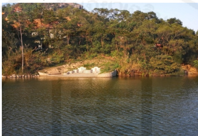
ภาพที่ 8 ความเชื่อฮวงจุ้ย มีน้ำอยู่ด้านหน้าสุสาน (Fengshui 风水)

“...ทุกบ้านจะเคยมีการฝังศพครั้งที่ 2 ที่บ้านเราจะหาหมอดูฮวงจุ้ย เพื่อเลือกสถานที่ที่เหมาะสมกับบรรพบุรุษ ต้องเลือกที่สวยงาม เช่น ด้านหน้ามีน้ำ หลังมีภูเขา ประกอบพิธีการในการฝังศพครั้งที่ 2 ต้องการเช่นไหว้ช่วงเทศกาลเซ็งเม้ง...”