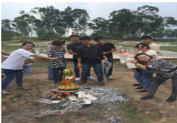
ภาพที่ 15 เสรีพิธีเผาเครื่องกระดาดเงินกระดาดทอง