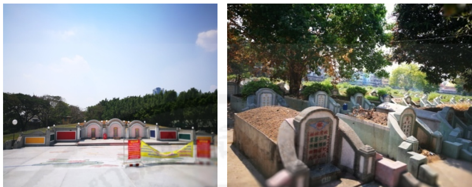
ภาพที่ 14 สุสานหรือหลุมศพที่ทำความสะอาดแล้ว