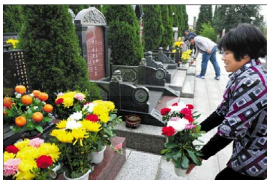
ภาพที่ 36 การแต่งกายในเทศกาลเซ็งเม้งของผู้หญิงจีนแต่จิว

“...บางคนคิดว่าเมื่อไปที่หลุมฝังศพต้องสวมใส่เสื้อผ้าสีดำ ถ้าใส่สีแดงหรือสีเหลืองและสีสดใสอื่น ๆ ก็ถือว่าไม่เคารพนับถือบรรพบุรุษ การเซ่นไหว้ที่หลุมฝังศพไม่ควรสวมใส่เสื้อผ้าสีแดงและสีเขียว บางคนคิดว่าเทศกาลเซ็งเม้งไม่ได้ซื้อรองเท้าเพราะ “รองเท้า” และ “ชว้จิว” (หมายความว่า สิ่งไม่ดี) ซื้อรองเท้าจะกระตุ้นความชั่วร้ายให้ความเป็นจริงจะมีผลกระทบทางลบสามารถนำทางโชคร้ายมาหาตัวเองในช่วงเทศกาลเซ็งเม้งอย่าซื้อรองเท้าเด็ดขาด ในแต่จิวผู้หญิงส่วนใหญ่จะใส่เครื่องประดับทุกคน เช่น กระเป๋า แว่นตา พัด ร่ม กระเป๋าต่างค์ อาจไปรวมถึงเสื้อคลุม รองเท้า รองเท้าบูท สร้อย แหวน กำไล หรือพวกเครื่องเงิน เครื่องชั้นเงิน ซ้อนส้อม เป็นต้น...”