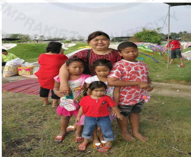
ภาพที่ 22 การแต่งกายแบบชาวบ้านในพิธีกรรมเทศกาลเซ็งเม้งของผู้หญิงชาวไทยเชื้อสายแต้จิ๋ว

“...ชาวบ้านทั่วไปของกลุ่มสายเลือดชาวไทยเชื้อสายแต้จิ๋วหรือรุ่น หลัง ๆ พวกนี้ไม่ค่อยสนใจการแต่งกายเท่าไร ในช่วงเดือนมีนาคม หรือเมษายนร้อนมาก ๆ ชาวบ้านบางคนก็ใส่ชุด T-shirt หรือชุด ชาวดำแบบง่าย ๆ การเซ่นไหว้ในเทศกาลเซ็งเม้ง ทั้งผู้ชายและ ผู้หญิงต้องใส่ชุดขาวหรือชุดสีดำ แต่บางคนใส่ชุดสีแดงเพราะไม่ถือว่าเป็นพิธีกรรมเศร้าโศก การไปเที่ยวนอกบ้านยังถือเป็นโอกาสดี สำหรับชาวบ้านทั่วไปของชาวไทยเชื้อสายแต้จิ๋ว...”