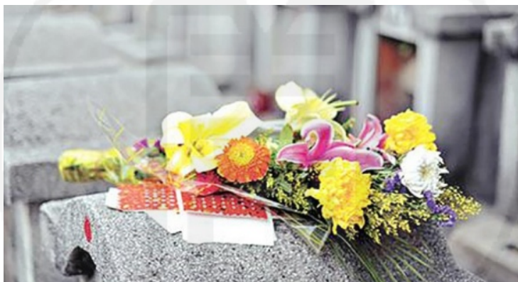
ภาพที่ 33 ก๊วยจั่ว (挂纸) ที่สุสาน (墓园)

(粿品) เช่น ฮวกก้วย (发粿) แป๊ะก้วย (麦粿) และจูซังเปี้ย (珠葱饼) ที่เหลือก็มีน้ำชา เหล้า ผลไม้ ดอกไม้สด รวมทั้งอาหารอื่น ๆ ที่ผู้ตายตอนยังมีชีวิตอยู่เคยชอบกินด้วยซึ่งแล้วแต่จะจัดและขาดไม่ได้สำหรับหลาย ๆ ครอบครัว คือ หอยแครงลวก แต่ที่บ้านดิฉันได้ทำการเช่นไหว้อีกครั้ง ณ ที่บ้านที่อาศัยด้วย ซาแซ ใช้สำหรับไหว้เจ้าหรือผีไม่มีญาติ การเช่นไหว้ลูกหลานควรไปพร้อมหน้ากัน ทุกปีควรจะต้องนำดินใส่หลังฮวงจู้ย ผลไม้ทุกชนิดที่นำไปไหว้ต้องให้มีชื่อเป็นมงคลและมีนัยว่ารุ่งเรืองเฟื่องฟู...”