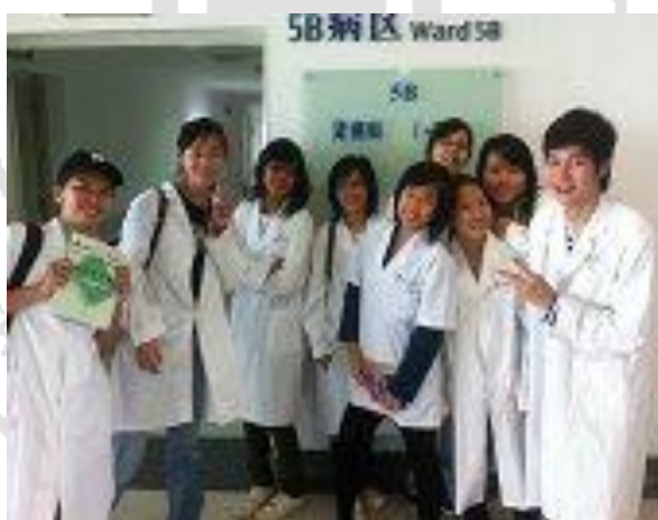
ภาพที่ 20 ดูงาน

นักศึกษาไปศึกษาดูงานที่โรงพยาบาลสุ่กวง ระหว่างที่ศึกษาอยู่ที่มหาวิทยาลัยการแพทย์แผนจีนเซี่ยงไฮ้