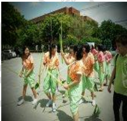
นักศึกษาชั้นปี 1 ร่วมกันจัดกิจกรรมส่งเสริมศิลปวัฒนธรรมไทยในงานสืบสานประเพณีสงกรานต์ ปี พ.ศ. 2556