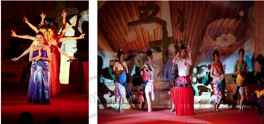
ภาพที่ 17 การแสดงบนเวที ปี พ.ศ. 2553