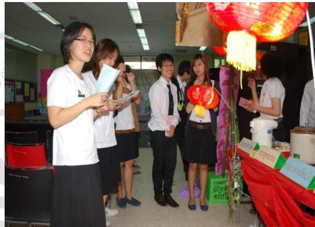
ภาพที่ 14 การแสดงในงานวันแพทย์จีน ปี 2556