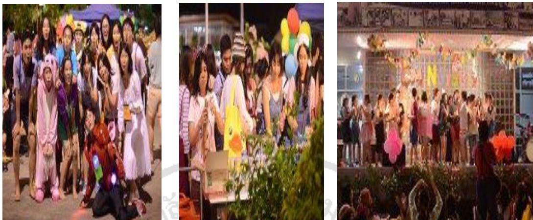
ภาพที่ 19 Thanks P

นักศึกษาชั้นปีที่ 1 (รหัส 56) ร่วมกันจัดเลี้ยงและการแสดงบนเวทีเพื่อขอบคุณรุ่นพี่ เมื่อวันที่ 29 สิงหาคม 2556 ณ ลานหน้าอาคารชิน โสภณพนิช