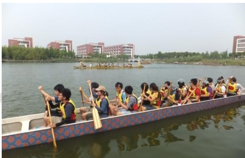
ภาพที่ 16 แข่งเรือมังกร

นักศึกษาคณะกรรมการแพทย์แผนจีนมหาวิทยาลัยหัวเฉียวเฉลิมพระเกียรติ ไม่ว่าจะศึกษาที่คณะกรรมการแพทย์แผนจีน มหาวิทยาลัยหัวเฉียวเฉลิมพระเกียรติ หรือไปศึกษาในประเทศจีน เนื่องจากการเรียนและศึกษาวิชาความรู้แล้วยังมีการทำกิจกรรมต่าง ๆ เช่น การแข่งเรือมังกรในเทศกาลสารทขนมจ้าง และกิจกรรมที่อนุรักษ์ประเพณีไทย ดังภาพประกอบ