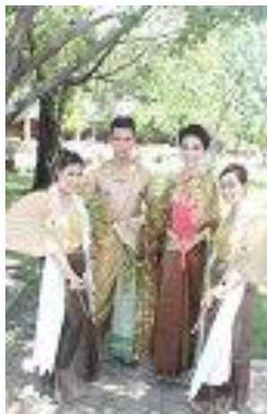
ภาพที่ 18 อนุรักษ์ประเพณีไทย