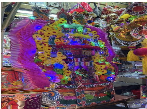
ถ่ายเมื่อวันที่ 21 กันยายน 2564 ที่ชุมชนเจริญไชย ย่านเยาวราช