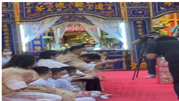
ภาพที่ 55 การถวายกิมจิวหิ้งจิวแก่บรรพชนในพิธีงเด็ก

ที่มา: LU XIAOHUI (ดวงกลม) ถ่ายเมื่อวันที่ 11 สิงหาคม 2564 ที่วัดบางพลีใหญ่ใน