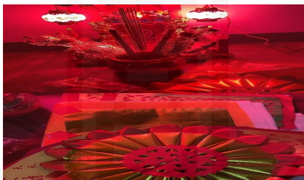
ภาพที่ 29 การเซ่นไหว้ที่จู่เอี้ย (บน) และกระดาษไหว้ที่ใช้ในพิธีเซ่นไหว้ (ล่าง)

ที่มา: LU XIAOHUI (ดวงกมล) ถ่ายเมื่อวันที่ 12 กุมภาพันธ์ 2564 ที่ร้านอาหารของย่านเยาวราช