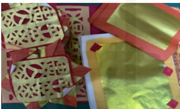
ที่มา: LU XIAOHUI (ดวงกมล) ถ่ายเมื่อวันที่ 14 มีนาคม 2564 ที่ร้านลิ้มเฮงฮวด

รูปแบบกระดาษไหว้ดวงวิญญาณจะไม่มี ความซับซ้อนเท่ากระดาษไหว้เจ้า ซึ่งส่วนใหญ่จะเป็นอ่วงแซจี้ กิมจิวหึ่งจิวและแบงค้งเต็ก สามรูปแบบนี้แฝงด้วยคติความเชื่อที่แตกต่างกัน ดังที่ผู้ที่มาซื้อกระดาษไหว้ในชุมชนเจริญไชยกกล่าวว่า