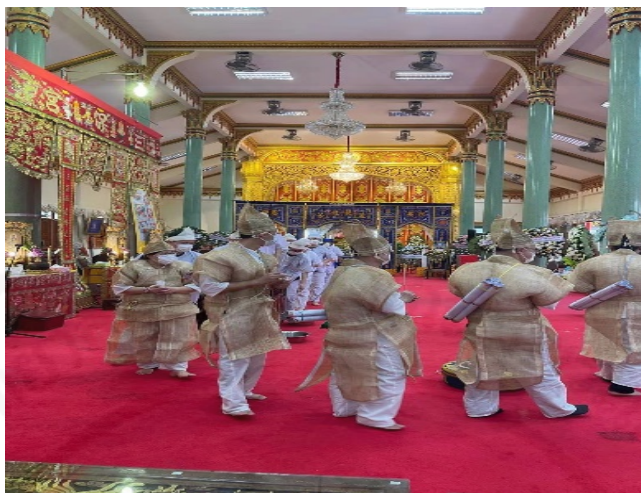
ถ่ายเมื่อวันที่ 11 สิงหาคม 2564 ที่วัดบางพลีใหญ่ใน