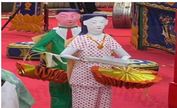
ภาพที่ 19 รูปแบบคนรับชาย-หญิงที่ใช้ในพิธีงเด็ก

ที่มา: LU XIAOHUI (ดวงกมล) ถ่ายเมื่อวันที่ 11 สิงหาคม 2564 ที่วัดบวรนิเวศวิหาร