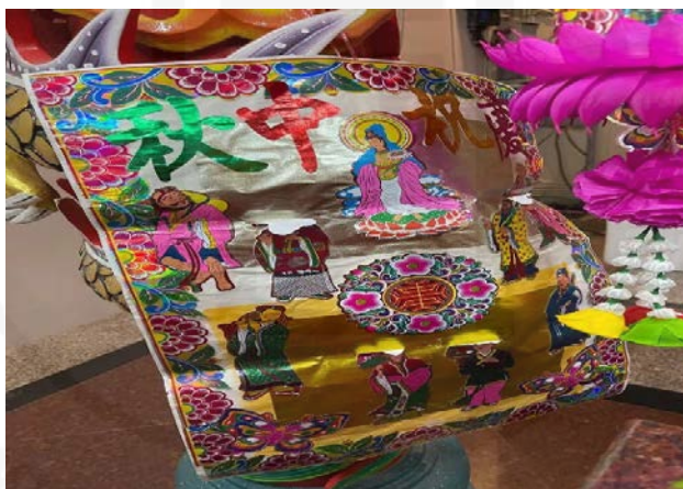
ถ่ายเมื่อวันที่ 21 กันยายน 2564 ที่ชุมชนเจริญไชย ย่านเยาวราช