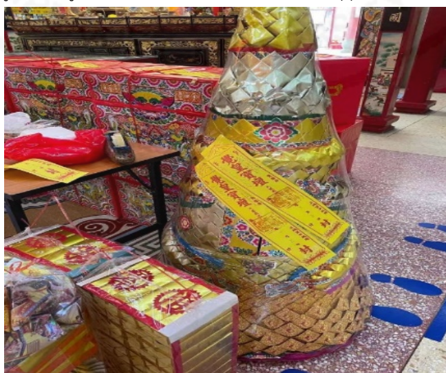
ภาพที่ 43 การอุทิศภูเขาเงินภูเขาทองและหีบห่อเสื้อผ้าแก่บรรพบุรุษ

ที่มา: LU XIAOHUI (ดวงกมล) ถ่ายเมื่อวันที่ 22 สิงหาคม 2564 ที่ศาลเจ้าไต้ฮงกง