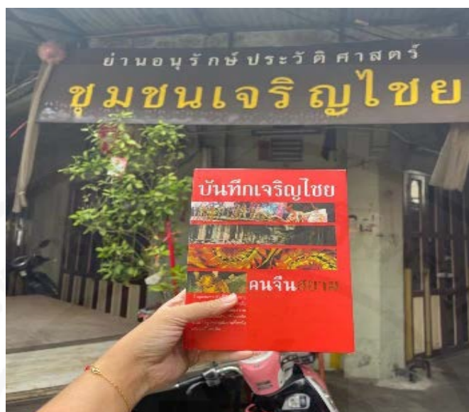
ภาพที่ 85 หนังสือเรื่อง “บันทึกเจริญไชย คนจีนสยาม”

ที่มา: LU XIAOHUI (ดวงกลม) ถ่ายเมื่อวันที่ 14 มีนาคม 2564 ที่ชุมชนเจริญไชย