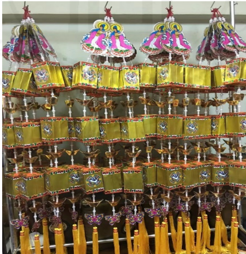
21 กันยายน 2564 ที่ชุมชนเจริญไชย ย่านเยาวราช