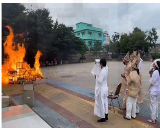
ถ่ายเมื่อวันที่ 11 สิงหาคม 2564 ที่วัดบางพลีใหญ่ใน