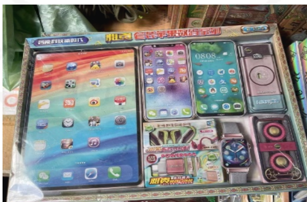
ที่มา: LU XIAOHUI (ดวงกมล) ถ่ายเมื่อวันที่ 14 มีนาคม 2564 ที่ร้านลิ้มเฮงฮวด