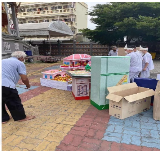
ที่มา: LU XIAOHUI (ดวงกมล) ถ่ายเมื่อวันที่ 11 สิงหาคม 2564 ที่วัดบางพลีใหญ่ใน