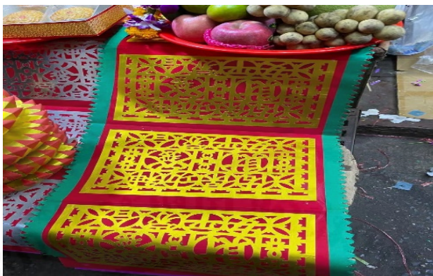
ถ่ายเมื่อวันที่ 21 กันยายน 2564 ที่ร้านก้างซังฮง