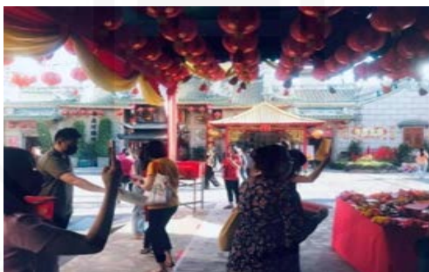
ภาพที่ 66 การใช้หิ้งเตี้ยมาปิดตัว

ที่มา: LU XIAOHUI (ดวงกลม) ถ่ายเมื่อวันที่ 12 กุมภาพันธ์ 2564 ที่วัดมังกรกมลาวาส