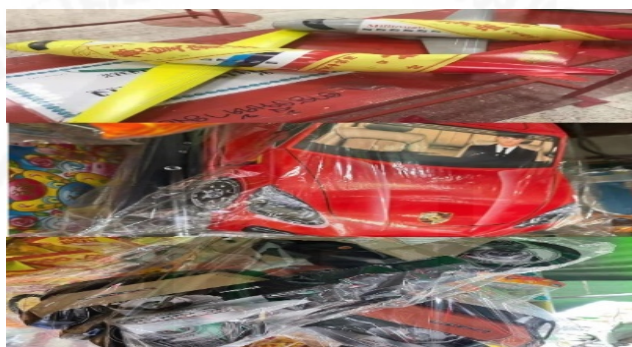
ภาพที่ 22 รูปแบบยานพาหนะแบบสมัยใหม่ เครื่องบิน รถยนต์ และรถมอเตอร์ไซด์