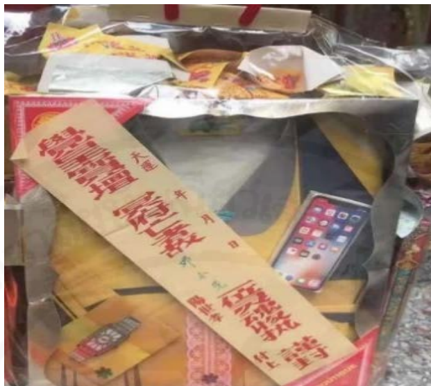
ภาพที่ 39 การติดใบเขียนชื่อของผู้รับและผู้ส่ง

ถ่ายเมื่อวันที่ 4 เมษายน 2564 ที่สุสานแต่จีว