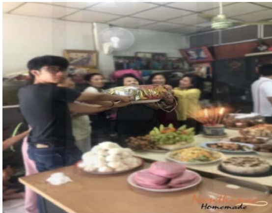
ที่มา: Nanthinee Homemade ถ่ายเมื่อวันที่ 6 มกราคม 2563