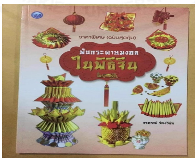
ภาพที่ 84 หนังสือเกี่ยวกับการพับกระดาษไหว้