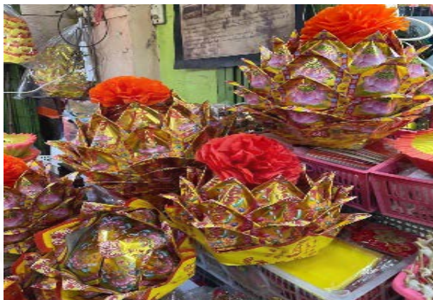
ภาพที่ 10 กระดาษไหว้เจ้า “ดอกบัว”

ที่มา: LU XIAOHUI (ดวงกมล) ถ่ายเมื่อวันที่ 2 สิงหาคม 2564 ที่ร้านกังซังฮง