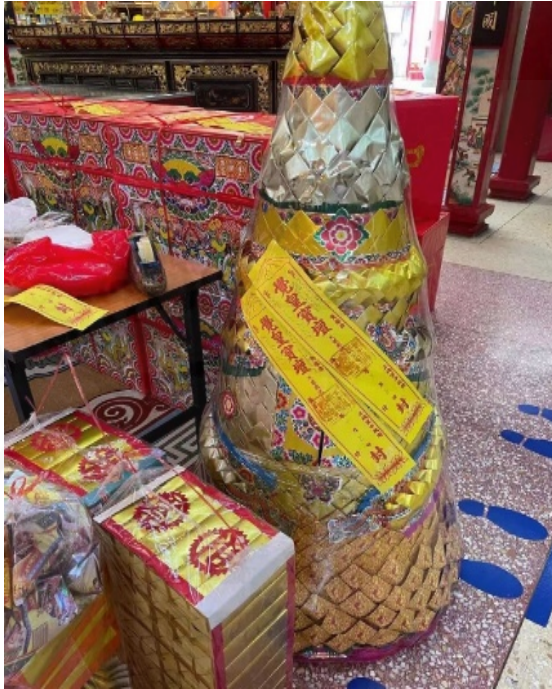
ถ่ายเมื่อวันที่ 22 สิงหาคม 2564 ที่ศาลเจ้าใต้ฮ่องกง