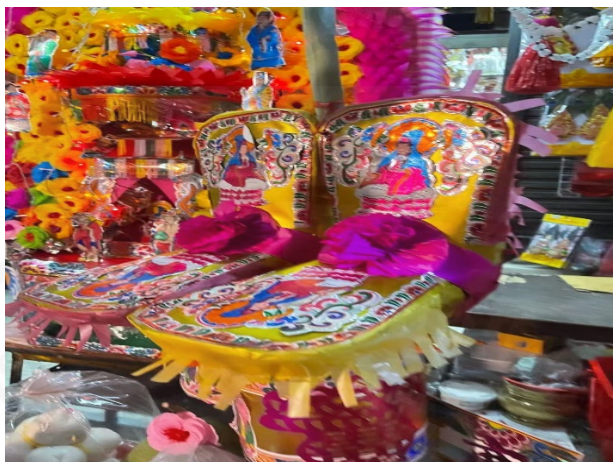
ภาพที่ 51 กระจาดข้าวพระจันทร์ ตัวป้อเกี้ยว