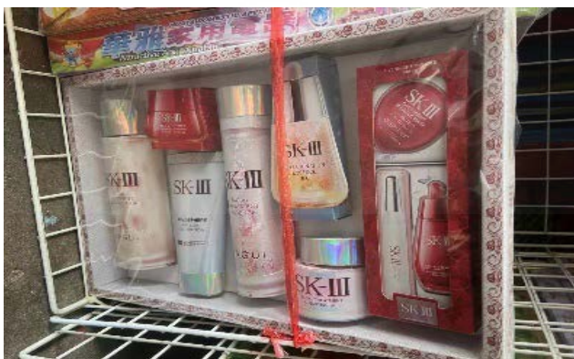
ภาพที่ 25 รูปแบบผลิตภัณฑ์ดูแลผิว เอสเค-ทรี

ที่มา: LU XIAOHUI (ดวงกมล) ถ่ายเมื่อวันที่ 9 มิถุนายน 2564 ที่ร้านตั้งเคี้ยวมัน