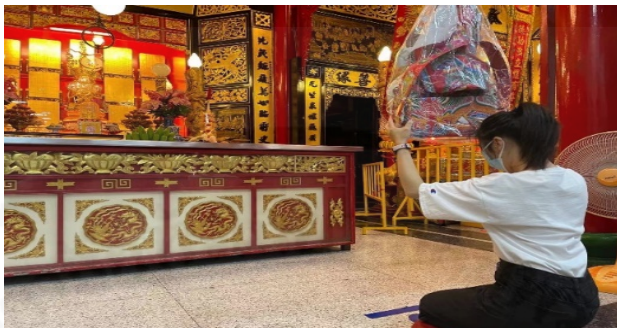
ภาพที่ 41 การถวายกระดาษไหว้ “เพ้า” แก่โต๊ะสี่เอี้ย