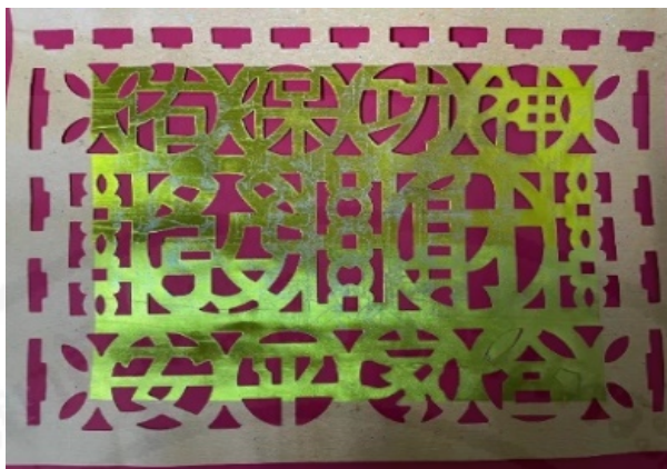
ภาพที่ 11 ภาษาจีนที่เขียนว่าเทพเจ้าคุ้มครองและความร่ำรวยเงินทอง