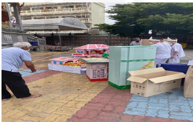
ถ่ายเมื่อวันที่ 11 สิงหาคม 2564 ที่วัดบางพลีใหญ่ใน