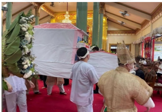
11 สิงหาคม 2564 ที่วัดบางพลีใหญ่ใน