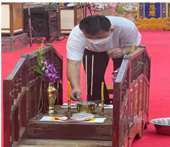
ที่มา: LU XIAOHUI (ดวงกมล) ถ่ายเมื่อวันที่ 11 สิงหาคม 2564 ที่วัดบางพลีใหญ่ใน