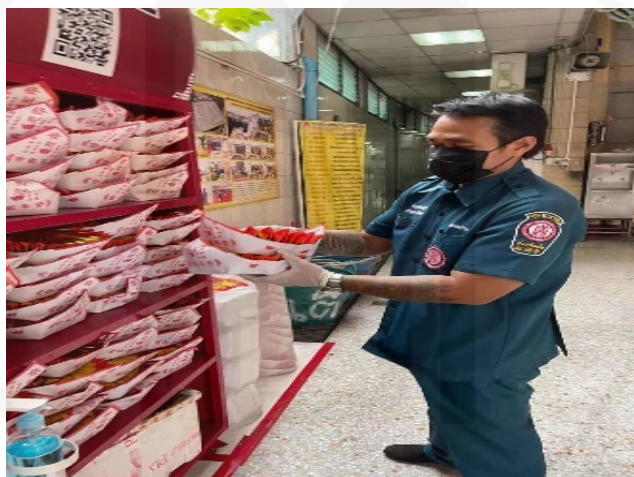
ภาพที่ 74 เจ้าหน้าที่ของศาลเจ้าไต้ฮงกงเตรียมกระดาษไหว้

ถ่ายเมื่อวันที่ 14 มิถุนายน 2564 ที่ศาลเจ้าไต้ฮงกง