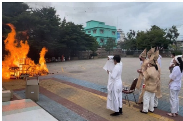
ถ่ายเมื่อวันที่ 11 สิงหาคม 2564 ที่วัดบางพลีใหญ่ใน