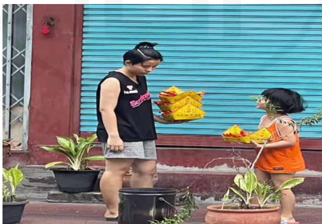
ภาพที่ 67 การให้ลูกหลานเข้าร่วมพิธีการเผากระดาษไหว้ในเทศกาลสารทจีน

ที่มา: LU XIAOHUI (ดวงกมล) 22 สิงหาคม 2564 ที่ย่านเยาวราช