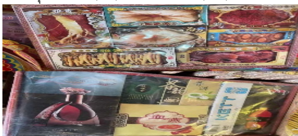
ภาพที่ 26 รูปแบบอาหารบำรุงร่างกาย (บน) และเครื่องดื่ม (ล่าง)

ที่มา: LU XIAOHUI (ดวงกมล) ถ่ายเมื่อวันที่ 14 มิถุนายน 2564 ที่ร้านตั้งเคี้ยวมัน