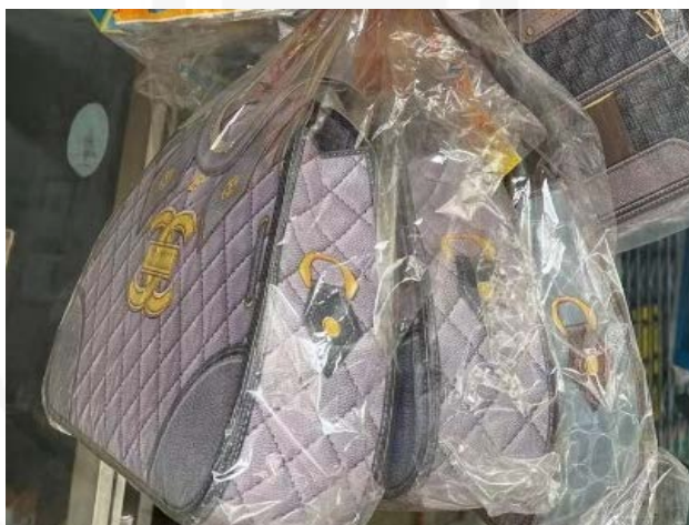
ภาพที่ 23 กระดาษไหว้ดวงวิญญาณ รูปแบบกระเป๋าชานเอล

ที่มา: LU XIAOHUI (ดวงกมล) ถ่ายเมื่อวันที่ 14 มิถุนายน 2564 ที่ร้านจิ๋วฮั่วฮะ