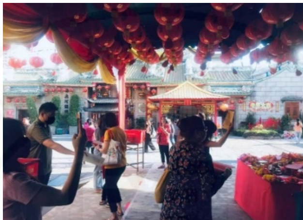
ภาพที่ 28 ผู้ศรัทธานำหิ้งเตี้ยมาปิดตัว

ที่มา: LU XIAOHUI (ดวงกมล) ถ่ายเมื่อวันที่ 12 กุมภาพันธ์ 2564 ที่วัดมังกรกมลาวาส