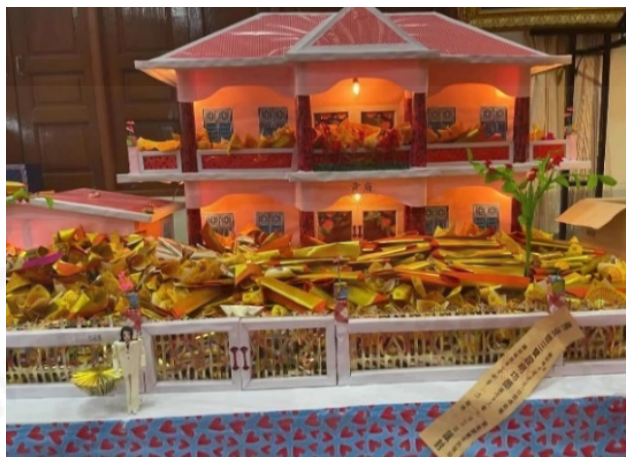
ถ่ายเมื่อวันที่ 11 สิงหาคม 2564 ที่วัดบางพลีใหญ่ใน