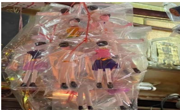
ภาพที่ 20 รูปแบบบุคคลที่ใช้ในพิธีการเผาตัวแทน