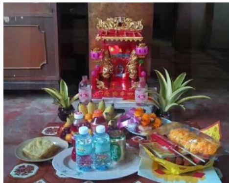
ที่มา: กิตติทัต สมุทรพัฒนานนท์ ถ่ายเมื่อวันที่ 4 เมษายน 2564