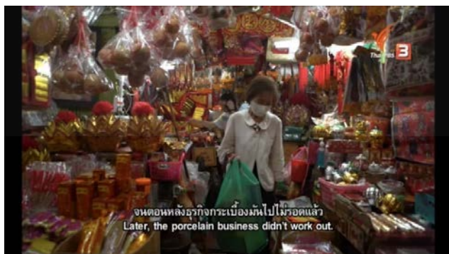
ภาพที่ 86 สถานีโทรทัศน์ที่มีเอสนำเสนอชุมชนกระดาดขาว