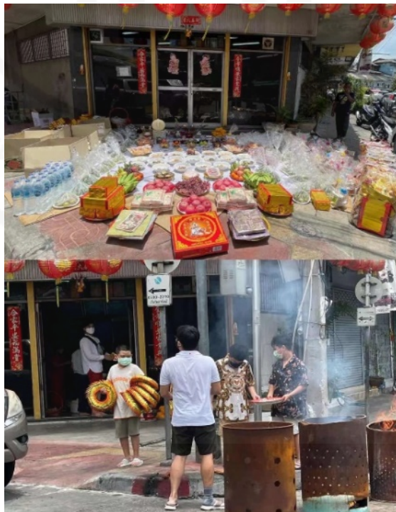
ที่มา: LU XIAOHUI (ดวงกมล) ถ่ายเมื่อวันที่ 22 สิงหาคม 2564 ที่ชุมชนเจริญไชย ย่านเยาวราช