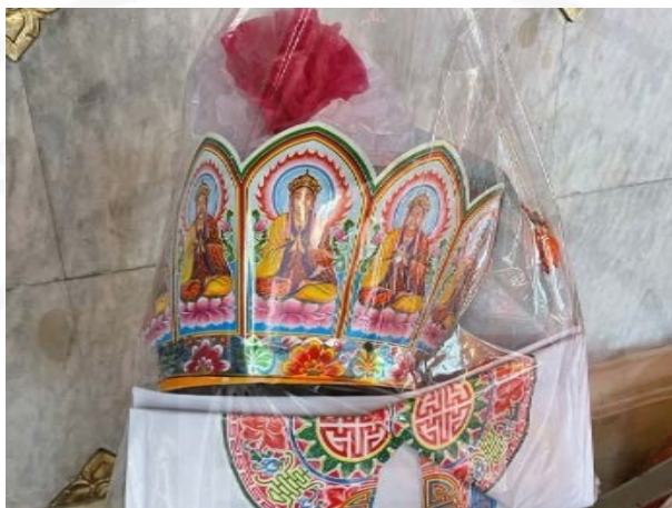
ภาพที่ 6 รูปลักษณะของพระพุทธรเจ้า 5 องค์