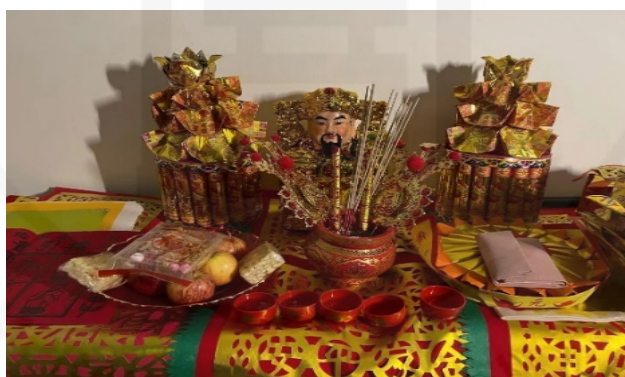
ภาพที่ 31 การเช่าไหว้เทพเจ้าไฉ่ซิงเอี้ยในช่วงเทศกาลตรุษจีน

ที่มา: LU XIAOHUI (ดวงกมล) ถ่ายเมื่อวันที่ 13 กุมภาพันธ์ 2564 ที่บ้านของชาวจีนชุมชนเจริญไชย