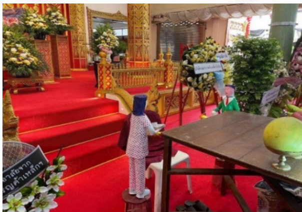
ภาพที่ 53 การวางคนรับใช้ชาย-หญิงไว้ที่หน้าโลงศพ