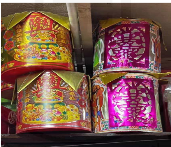
ภาพที่ 80 การใช้ภาพลักษณ์ของทรัพย์สินเงินทองในกระดาศไหว้ไฉ่สิ่งเอี้ย

ที่มา: LU XIAOHUI (ดวงกมล) ถ่ายเมื่อวันที่ 2 สิงหาคม 2564 ที่ร้านเจียมอะฮุ้นเส็ง