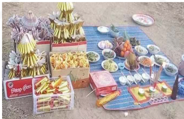
ภาพที่ 34 การใช้กระดาษไหว้ในการประกอบพิธีเซ่นไหว้ดวงวิญญาณไร้ญาติ