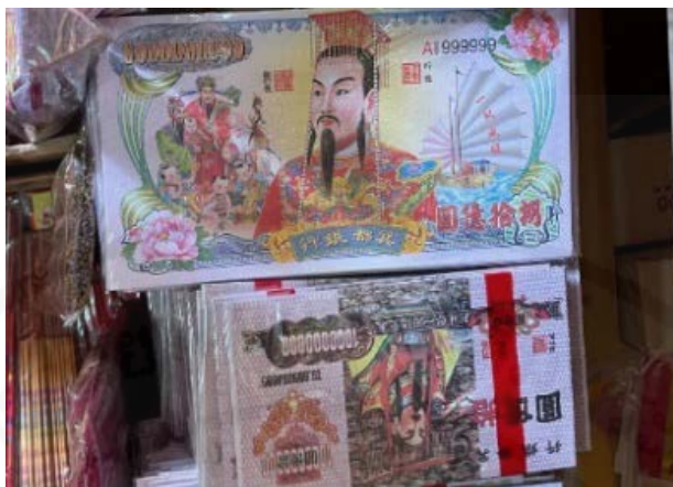
ที่มา: LU XIAOHUI (ดวงกมล) ถ่ายเมื่อวันที่ 9 มิถุนายน 2564 ที่ร้านอดิศักดิ์

ชาวจีนไม่ได้ใช้เพียงภาพลักษณะของเทพเจ้าเงินเท่านั้น แต่ยังใช้ภาพลักษณะของแปดเซียนอีกด้วย ซึ่งแปดเซียนเป็นเซียนจีนที่เกิดจากคติความเชื่อทางศาสนาเต๋า ความเชื่อเกี่ยวกับแปดเซียนได้รับความนิยมจากชาวจีนและคนไทยเชื้อสายจีนจนถึงปัจจุบัน ดังที่เจ้าของร้านกระดาษไหว้ในชุมชนเจริญไชยกกล่าวว่า