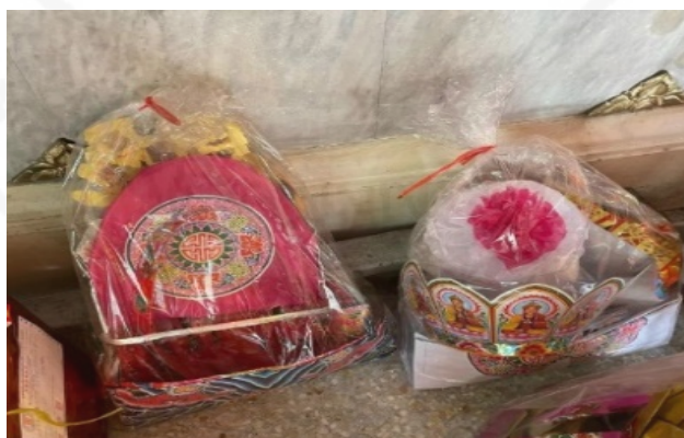
ที่มา: LU XIAOHUI (ดวงกมล) ถ่ายเมื่อวันที่ 29 กรกฎาคม 2564ที่ศาลเจ้าไต้ฮงกง