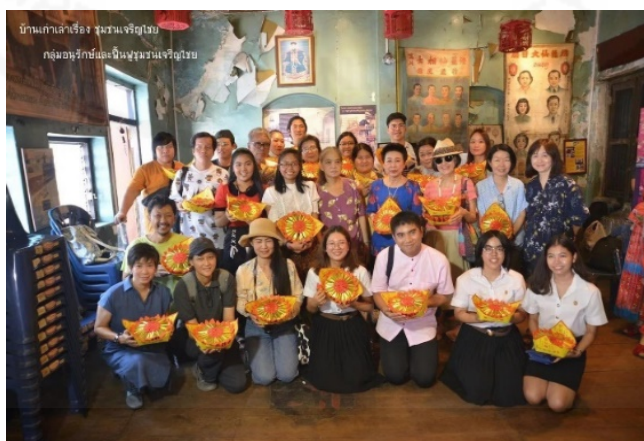
ที่มา: กลุ่มอนุรักษ์และฟื้นฟูชุมชนเจริญไชย ถ่ายเมื่อวันที่ 25 ตุลาคม 2562