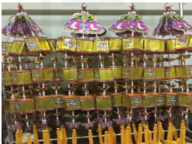
ภาพที่ 52 กระจาดข้าวเจ้าแม่กวอนอิมในเทศกาลพระจันทร์ อ่วงมิ่ง

ที่มา: LU XIAOHUI (ดวงกมล) 21 กันยายน 2564 ที่ชุมชนเจริญไชย ย่านเยาวราช