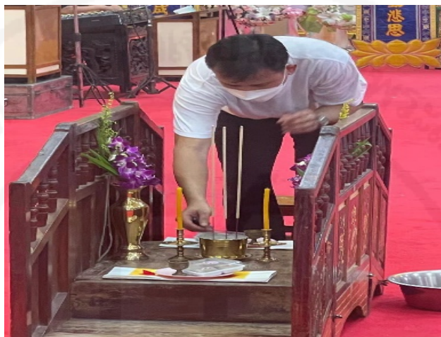
ภาพที่ 56 การใช้หนึ่งเดียวเช่นไหว้สะพานโอมะสงสาร