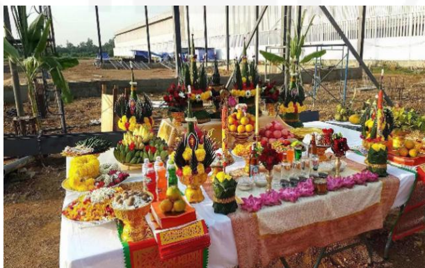
ภาพที่ 76 การใช้กระดาษไหว้และเครื่องสักการะบูชาแบบไทยในพิธียกเสาเอก