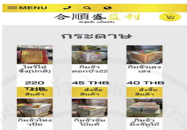
ภาพที่ 90 ร้านจำหน่ายกระดาษไหว้ขายกระดาษไหว้โดยผ่านเว็บไซต์