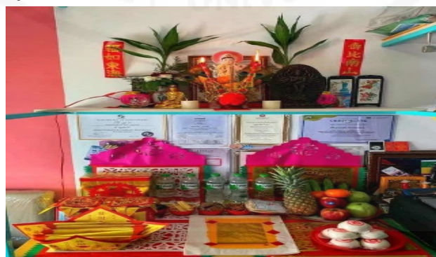
ภาพที่ 30 การใช้กระดาษไหว้ กิมเตี้ยว กิมเต้าหิ้งเต้า กระทงอ่วงป้อ เทียงเถ่าจี้ และหิ้งเตี้ยในการประกอบพิธีบูชาเจ้าแม่กวนอิม

ที่มา: ภูวดิษฐ์ ชื้อสกุล ถ่ายเมื่อวันที่ 12 กุมภาพันธ์ 2564 ที่บ้านของภูวดิษฐ์ ชื้อสกุล