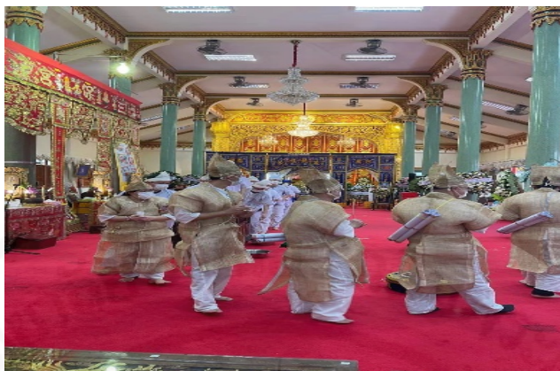
ที่มา: LU XIAOHUI (ดวงกลม) ถ่ายเมื่อวันที่ 11 สิงหาคม 2564 ที่วัดบางพลีใหญ่ใน