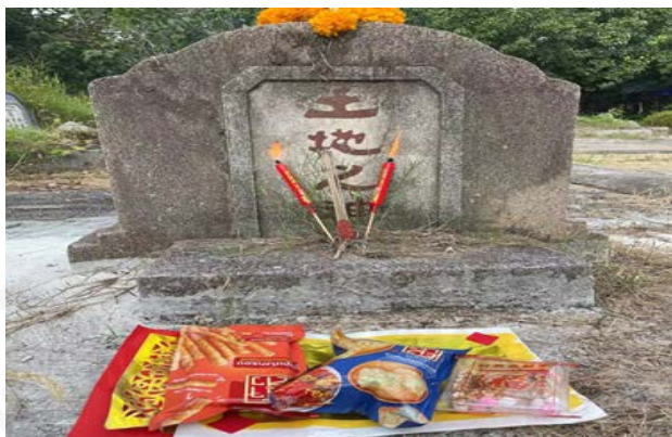
ที่มา: LU XIAOHUI (ดวงกลม) ถ่ายเมื่อวันที่ 4 เมษายน 2564 ที่สุสานแต่จีว