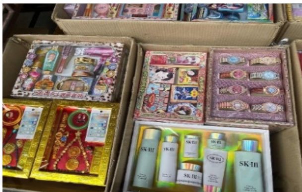
ภาพที่ 5 กระจาดข้าวดวงวิญญาณในสมัยปัจจุบัน