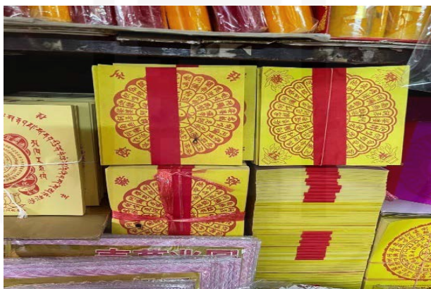
ภาพที่ 14 กระดาษไหว้ดวงวิญญาณ “อ่องแซจี้”