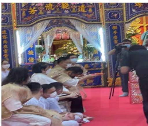
ที่มา: LU XIAOHUI (ดวงกมล) ถ่ายเมื่อวันที่ 11 สิงหาคม 2564 ที่วัดบางพลีใหญ่ใน