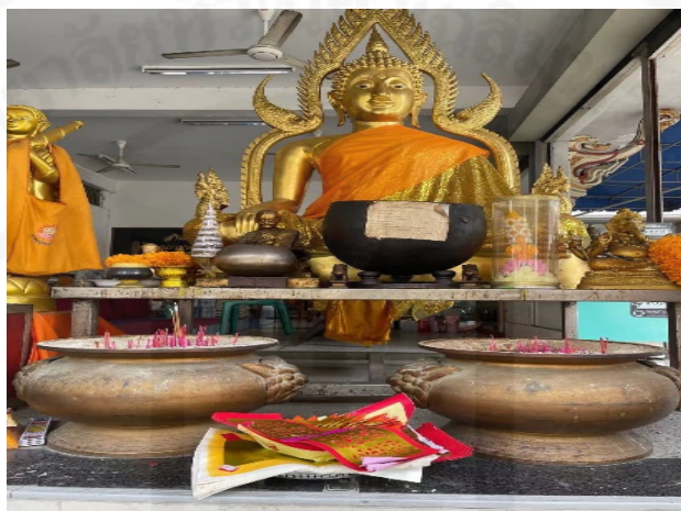
ภาพที่ 75 การใช้กระดาษไหว้ไปเซ่นไหว้บูชาเทพเจ้าไทย

ที่มา: LU XIAOHUI (ดวงกมล) ถ่ายเมื่อวันที่ 17 กันยายน 2564 ที่วัดคณิกาผล