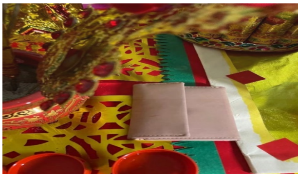
ภาพที่ 32 การวางไว้กระเป่าเงินบนเทียงเถ่าจี

ที่มา: LU XIAOHUI (ดวงกมล) ถ่ายเมื่อวันที่ 13 กุมภาพันธ์ 2564 ที่บ้านของชาวจีนชุมชนเจริญไชย