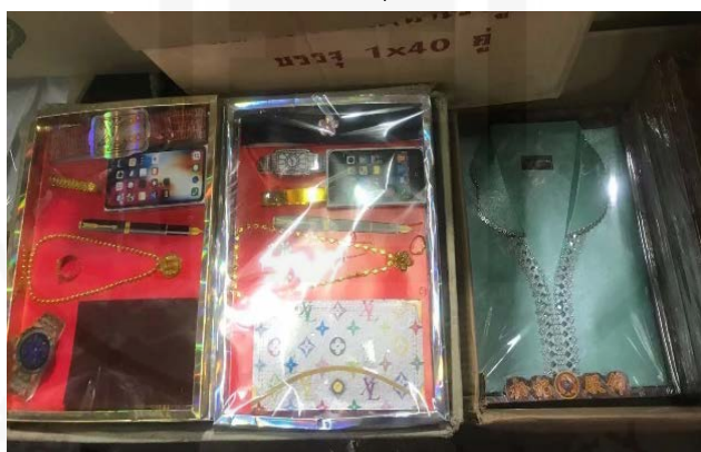
ภาพที่ 77 รูปแบบกระดาษไหว้ตามความนิยมในปัจจุบัน

ที่มา: LU XIAOHUI (ดวงกลม) ถ่ายเมื่อวันที่ 14 เมษายน 2564 ที่ร้านลิ้มเฮงฮวด