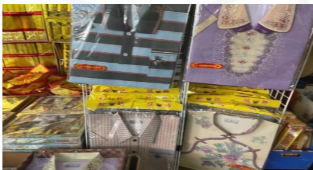
ภาพที่ 16 กระดาดไหว้ดวงวิญญาณ รูปแบบเสื้อผ้าชาย-หญิง

ที่มา: LU XIAOHUI (ดวงกลม) ถ่ายเมื่อวันที่ 2 สิงหาคม 2564 ที่ร้านชะชุ่นเส็ง (เอ๊ะยะหลี)