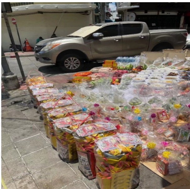
ภาพที่ 45 การอุทิศชุดกระดาษไหว้ดวงวิญญาณแก่ผีไร้ญาติ

ที่มา: LU XIAOHUI (ดวงกลม) ถ่ายเมื่อวันที่ 22 สิงหาคม 2564 ที่ชุมชนเจริญไชย ย่านเยาวราช