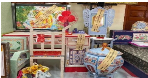
ภาพที่ 2 กระจาดข้าวต้มดวงวิญญาณที่ใช้ในพิธีกรรมงต๋อง

ที่มา: LU XIAOHUI (ดวงกลม) ถ่ายเมื่อวันที่ 11 สิงหาคม 2564 ที่วัดบางพลีใหญ่ใน