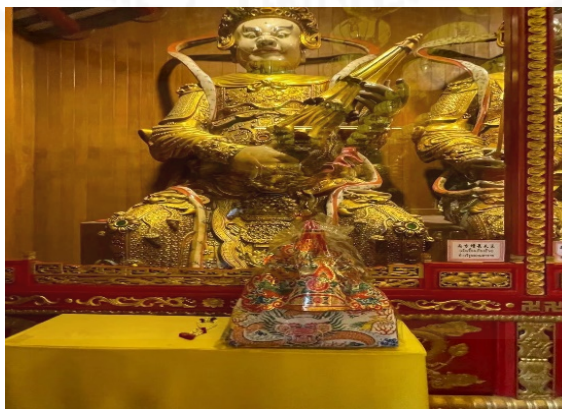
ที่มา: LU XIAOHUI (ดวงกมล) ถ่ายเมื่อวันที่ 17 กันยายน 2564 ที่วัดมังกรกมลาวาส