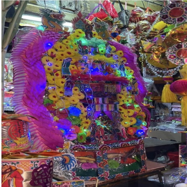
ถ่ายเมื่อวันที่ 21 กันยายน 2564 ที่ชุมชนเจริญไชย ย่านเยาวราช