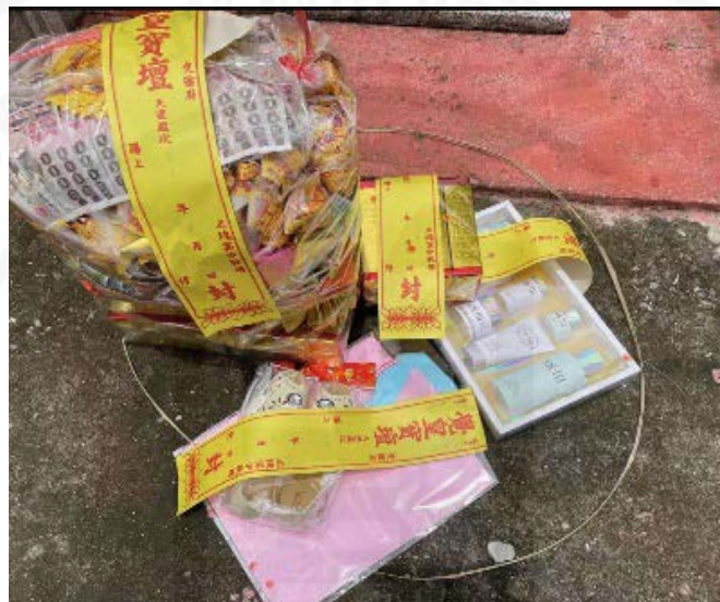
ที่มา: LU XIAOHUI (ดวงกลม) ถ่ายเมื่อวันที่ 4 เมษายน 2564 ที่สุสานแต่จีว