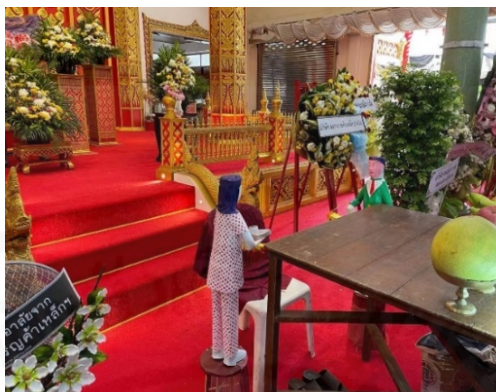
ถ่ายเมื่อวันที่ 11 สิงหาคม 2564 ที่วัดบางพลีใหญ่ใน