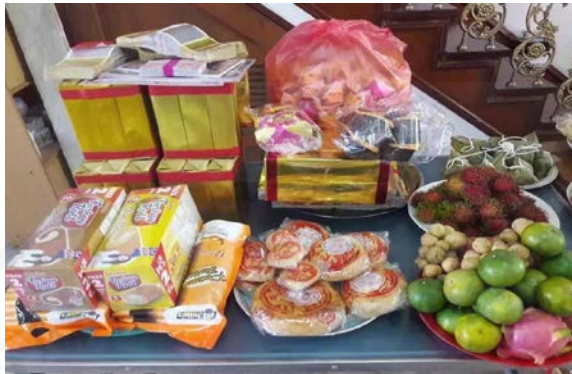
ที่มา: เฉลิมชัย ชัดดีโยทัยวงศ์ ถ่ายเมื่อวันที่ 21 มิถุนายน 2564