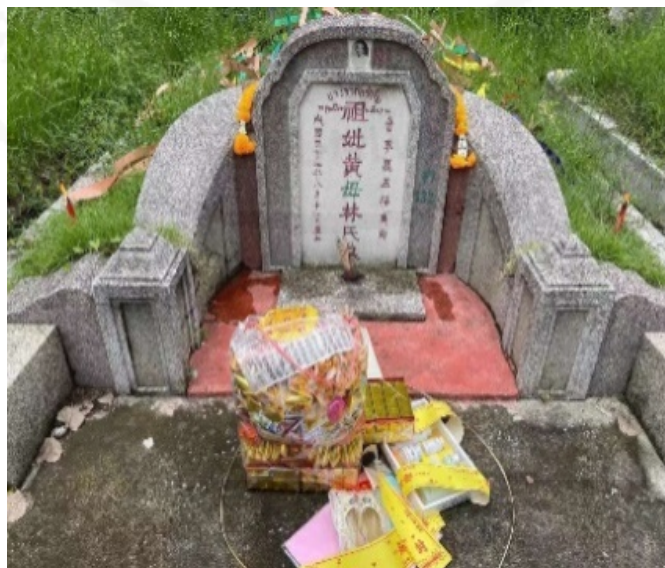
ที่มา: LU XIAOHUI (ดวงกลม) ถ่ายเมื่อวันที่ 4 เมษายน 2564 ที่สุสานแต่จีว