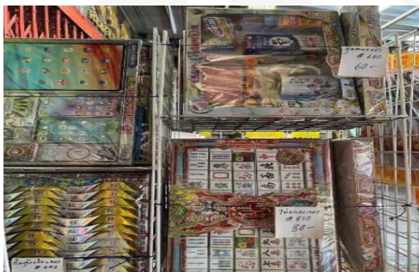
ภาพที่ 21 กระดาษไหว้ดวงวิญญาณ รูปแบบของใช้ชีวิตประจำวัน