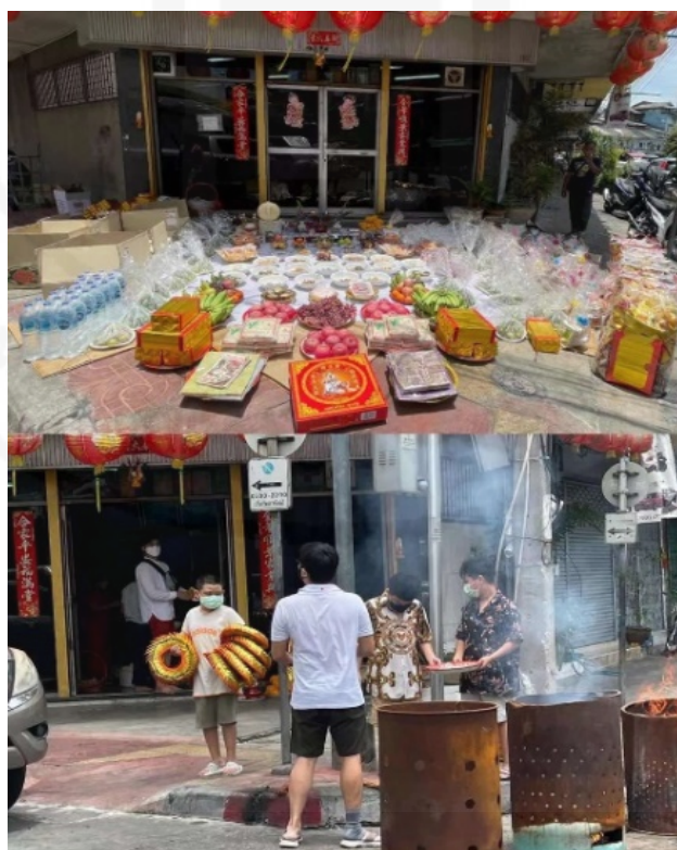
ภาพที่ 44 การเผากระดาษไหว้ให้แก่ดวงวิญญาณไร้ญาติ

ที่มา: LU XIAOHUI (ดวงกมล) ถ่ายเมื่อวันที่ 22 สิงหาคม 2564 ที่ชุมชนเจริญไชย ย่านเยาวราช