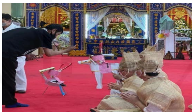
ถ่ายเมื่อวันที่ 11 สิงหาคม 2564 ที่วัดบางพลีใหญ่ใน