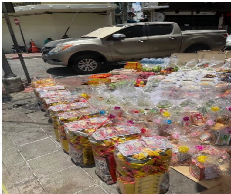
ถ่ายเมื่อวันที่ 22 สิงหาคม 2564 ที่ชุมชนเจริญไชย ย่านเยาวราช