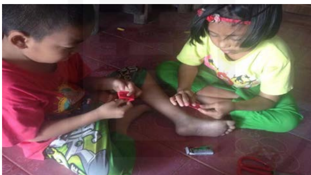
ที่มา: ปรีชา แสงอรุณ ถ่ายเมื่อวันที่ 26 กรกฎาคม 2564

ครอบครัวคนไทยเชื้อสายจีนเป็นสถานที่สอนให้สมาชิกในครอบครัวเข้าใจประเภทของ กระดาษไหว้และวิธีการใช้กระดาษไหว้ ดังที่ผู้มาซื้อกระดาษไหว้ให้สัมภาษณ์ว่า