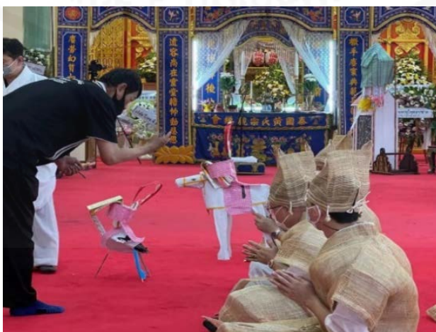
ภาพที่ 54 การใช้กระดาษม้าและนกในพิธีเชิญพระพุทธรเจ้า

ที่มา: LU XIAOHUI (ดวงกลม) ถ่ายเมื่อวันที่ 11 สิงหาคม 2564 ที่วัดบางพลีใหญ่ใน