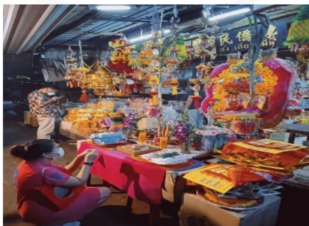
ภาพที่ 47 การจัดโต๊ะเช่นไหว้เทพเจ้าเจ้าแม่กวนอิมในเทศกาลไหว้พระจันทร์