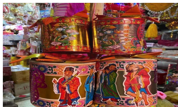
ถ่ายเมื่อวันที่ 21 กันยายน 2564 ที่ชุมชนเจริญไชย ย่านเยาวราช