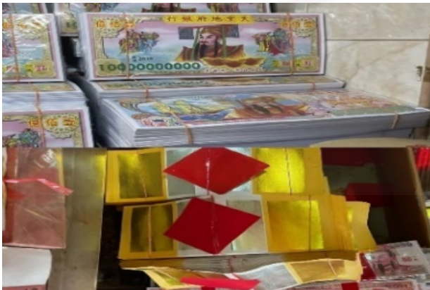
ภาพที่ 15 กระดาษไหว้ดวงวิญญาณ “แบงค้งเต็ก” (บน) และ “กิมจิวหังจิว” (ล่าง)

ที่มา: LU XIAOHUI (ดวงกมล) ถ่ายเมื่อวันที่ 9 มิถุนายน 2564 ที่ร้านบู๊เซ็ง