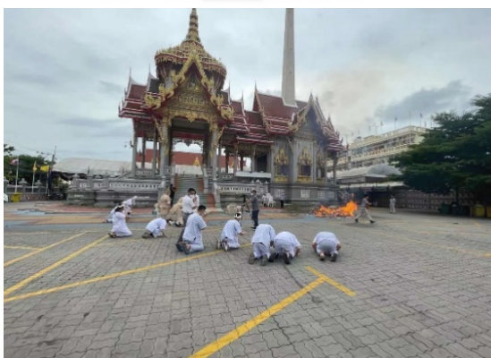
11 สิงหาคม 2564 ที่วัดบางพลีใหญ่ใน