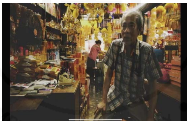
ภาพที่ 88 สารคดีที่นำเสนอวัฒนธรรมกระจาดข้าว

ที่มา : LU XIAOHUI (ดวงกมล) ค้นหาเมื่อวันที่ 17 กันยายน 2564 ที่ออนไลน์