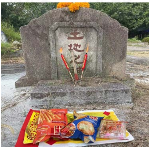
ที่มา: LU XIAOHUI (ดวงกมล) ถ่ายเมื่อวันที่ 4 เมษายน 2564 ที่สุสานแต่จิว