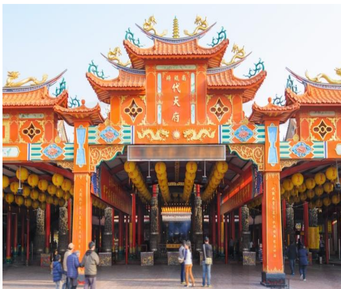
ภาพที่ 1 ศาลเจ้าหนานคุนเฉินใต้เทียนฟู (南鯤鯓代天府)

ที่มา: Baidu (ศาลเจ้าหนานคุนเฉินใต้เทียนฟู) ค้นมาเมื่อวันที่ 29 พฤษภาคม 2564