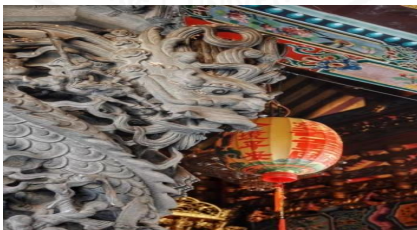
ที่มา: WANG QINGHUA (ญาติ) ถ่ายเมื่อวันที่ 24 พฤษภาคม 2564 ที่ศาลเจ้ามูลนิธิธรรมกัตัญญู (เสียนหลอใต้เทียนกง)