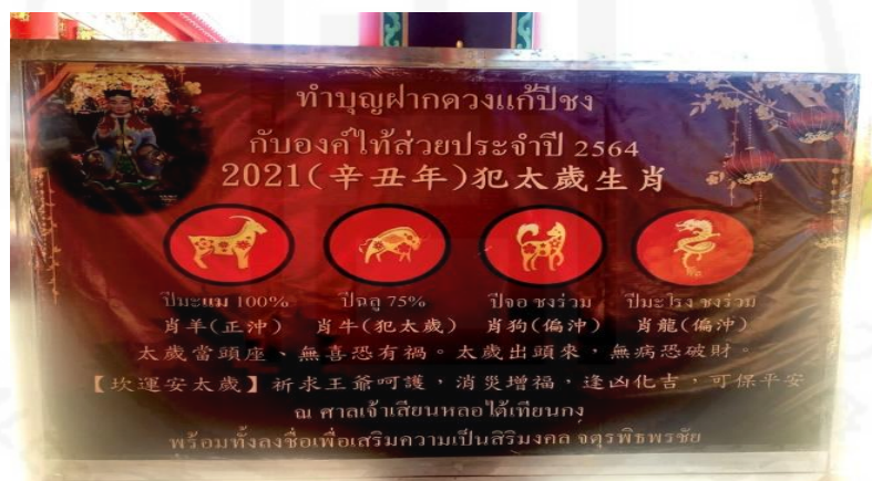
ภาพที่ 30 ป้ายคำแนะนำให้แก้ปีชง

ที่มา: WANG QINGHUA (ญาติ) ถ่ายเมื่อวันที่ 23 พฤษภาคม 2564 ที่ศาลเจ้ามูลนิธิธรรมกัตถุญ (เสียนหลอใต้เทียนกง)