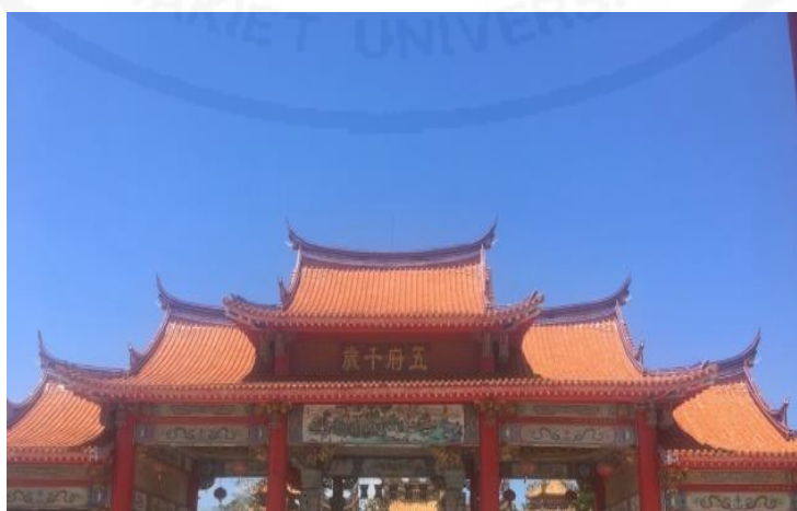
ภาพที่ 8 หลังคาของศาลเจ้า