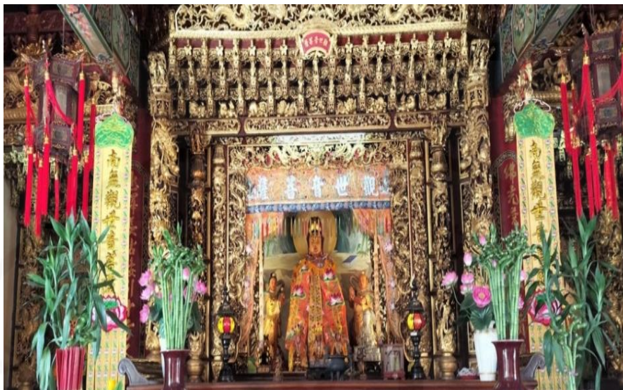
ภาพที่ 26 รูปเคารพของเจ้าแม่กวนอิม(观音)

ที่มา: WANG QINGHUA (ญาติ) ถ่ายเมื่อวันที่ 23 พฤษภาคม 2564 ที่ศาลเจ้ามูลินีธรรมกตัญญู (เสียนหลอใต้เทียนกง)