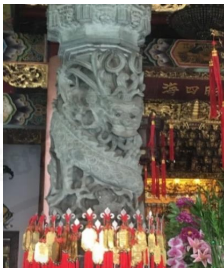
ภาพที่ 18 เสามังกรสี่เทา

ที่มา: WANG QINGHUA (ญาติ) ถ่ายเมื่อวันที่ 29 มิถุนายน 2564 ที่ศาลเจ้ามูลนิธิธรรมกัตัญญู (เสียนหลอใต้เทียนกง)