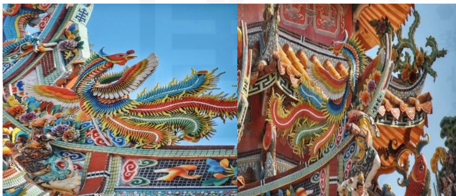
ที่มา: WANG QINGHUA (ญาติ) ถ่ายเมื่อวันที่ 24 พฤษภาคม 2564 ที่ศาลเจ้ามูลนิธิธรรมกัตัญญู (เสียนหลอใต้เทียนกง)