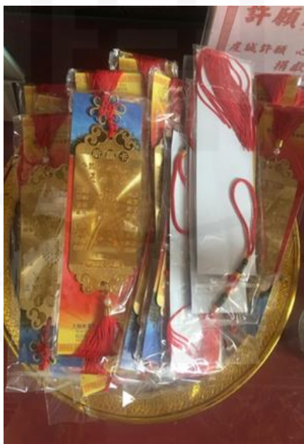
ภาพที่ 46 การ์ดสวดมนต์ของเทพเจ้าอู่ฟู่เซียนส่วย (เทพเจ้า 5 พระองค์)

ที่มา: WANG QINGHUA (ญาติ) ถ่ายเมื่อวันที่ 26 กันยายน 2564 ที่ศาลเจ้ามูลนิธิธรรมกัตถุณู (เสียนหลอใต้เทียนกง)