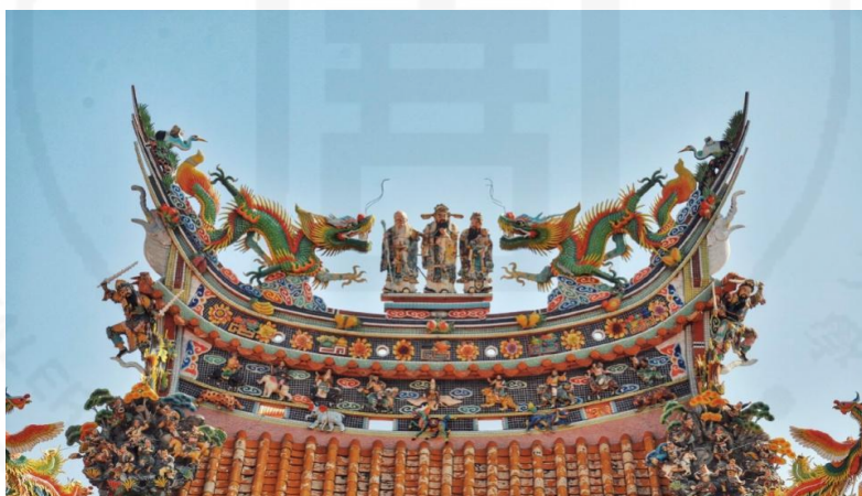
ภาพที่ 11 หลังคาของวิหาร

ที่มา: WANG QINGHUA (ญาติ) ถ่ายเมื่อวันที่ 24 พฤษภาคม 2564 ที่ศาลเจ้ามูลนิธิธรรมกตัญญู (เสียนหลอใต้เทียนกง)