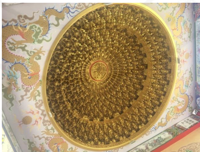
ที่มา: WANG QINGHUA (ญาติ) ถ่ายเมื่อวันที่ 23 พฤษภาคม 2564 ที่ศาลเจ้ามูลินิธรรมกัตัญญู (เสียนหลอใต้เทียนกง)