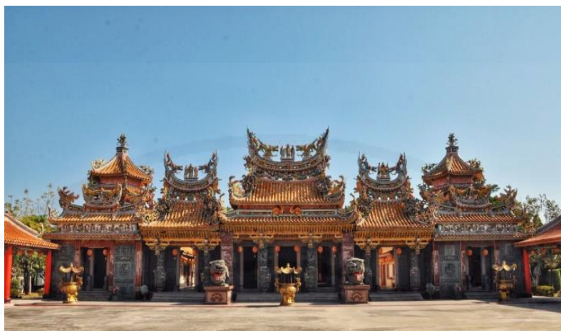
ภาพที่ 10 วิหารที่ประดิษฐานเทพเจ้าทุกองค์

ที่มา: WANG QINGHUA (ญาติ) ถ่ายเมื่อวันที่ 24 พฤษภาคม 2564 ที่ศาลเจ้ามูลนิธิธรรมกตัญญู (เสียนหลอใต้เทียนกง)