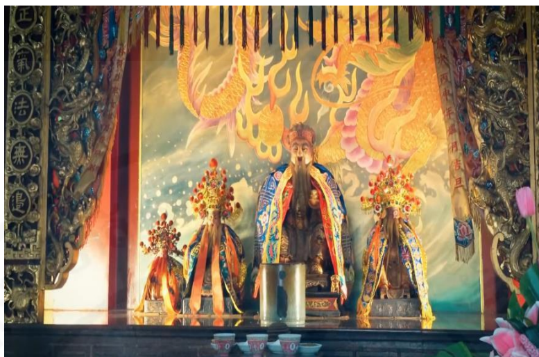
ภาพที่ 27 รูปเคารพของเทพเจ้าแป๊ะกง (福德正神)