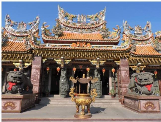
ที่มา: WANG QINGHUA (ญาติ) ถ่ายเมื่อวันที่ 23 พฤษภาคม 2564 ที่ศาลเจ้ามูลินิธรรมกัตัญญู (เสียนหลอใต้เทียนกง)

การตกแต่งศิลปะบนฝ้าเพดานภายในศาลเจ้าแห่งนี้มีรูปร่างเหมือนรถเก๋งหรือที่เรียกกันทั่วไปว่า “หลังคารถเก๋ง” โดยมีรูปร่างที่เป็นเอกลักษณ์และยังได้กลายเป็นจุดเด่นทางสถาปัตยกรรมแบบจีนใต้หวันที่เป็นเอกลักษณ์ของศาลเจ้า ดังภาพที่ 16 ส่วนของระเบียงทางเดินและวิหารใหญ่ที่บูชาเทพเจ้าก็จะมีหลังคารูปทรงเป็นแบบนี้ด้วย