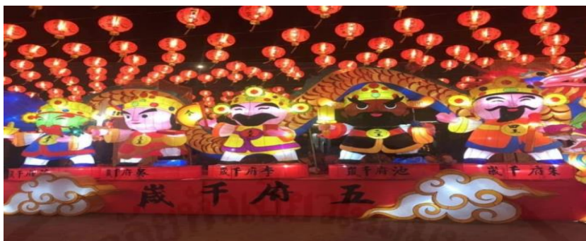
ภาพที่ 36 โคมไฟเป็นรูปเคารพของเทพเจ้าห้าพระองค์