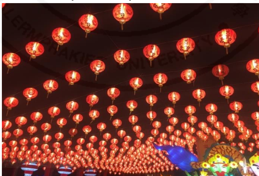
ที่มา: WANG QINGHUA (ญาติ) ถ่ายเมื่อวันที่ 31 มกราคม 2565 ที่ศาลเจ้ามูลนิธิธรรมกัตถุญ (เสียนหลอใต้เทียนกง)