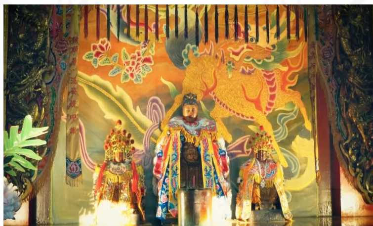
ภาพที่ 28 รูปเคารพของพระแม่บังเกิดเกล้า (注生娘娘)

ที่มา: WANG QINGHUA (ญาติ) ถ่ายเมื่อวันที่ 23 พฤษภาคม 2564 ที่ศาลเจ้ามุณีธรรมกตัญญู (เสียนหลอใต้เทียนกง)