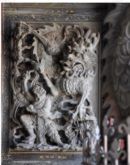
ภาพที่ 19 แกะสลักหิน