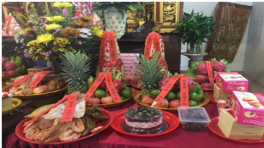
ที่มา: WANG QINGHUA (ญาติ) ถ่ายเมื่อวันที่ 6 มิถุนายน 2564 ที่ศาลเจ้ามูลนิธิธรรมกัตถุญญ (เสียนหลอใต้เทียนกง)

วันเกิดของเทพเจ้าอู่ฟูเซียนส้วย (เทพเจ้า 5 พระองค์) จะมีขั้นตอนการไหว้ 3 ขั้นตอน คือ ขั้นตอนที่หนึ่ง ผู้มาบูชาจะต้องเริ่มจากการไปไหว้ท้องฟ้า (拜天宮) ก่อน เพื่อเป็นการบอกกล่าวกับเทพเจ้าที่อยู่บนสรวงสวรรค์ โดยบอกกล่าวว่าเป็นวันเกิดของเทพเจ้าอู่ฟูเซียนส้วย ขั้นตอนที่สอง ผู้เข้าร่วมพิธีกรรมต้องเตรียมสิ่งของสำหรับไหว้บูชาเทพเจ้าและนำของไหว้ต่าง ๆ ที่เตรียมไว้ไปวาง