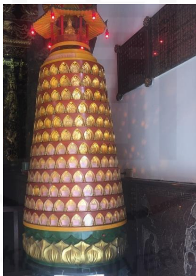
ภาพที่ 31 ดวงไฟบูชาเทพเจ้าไท่ส่วยเอี้ย

ที่มา: WANG QINGHUA (ญาติ) ถ่ายเมื่อวันที่ 26 กันยายน 2564 ที่ศาลเจ้ามูลนิธิธรรมกัตถุญ (เสียนหลอใต้เทียนกง)