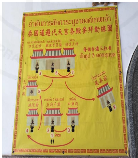
ที่มา: WANG QINGHUA (ญาติ) ถ่ายเมื่อวันที่ 30 มกราคม 2565 ที่ศาลเจ้ามูลนิธิธรรมกัตถุญญ (เสียนหลอใต้เทียนกง)