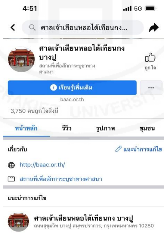
ภาพที่ 47 เพจเฟซบุ๊ก (Facebook) ของศาลเจ้ามูลนิธิธรรมกัตถุญ (เสียนหลอใต้เทียนกง)