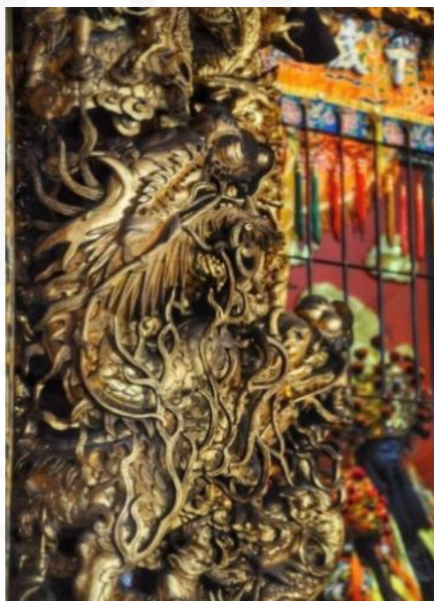
ภาพที่ 17 เสามังกรสีทอง

ที่มา: WANG QINGHUA (ญาติ) ถ่ายเมื่อวันที่ 26 พฤษภาคม 2564 ที่ศาลเจ้ามูลนิธิธรรมกตัญญู (เสียนหลอใต้เทียนกง)