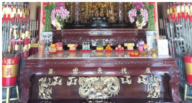
ที่มา: WANG QINGHUA (ญาติ) ถ่ายเมื่อวันที่ 29 มิถุนายน 2564 ที่ศาลเจ้ามูลนิธิธรรมกัตัญญู (เสียนหลอใต้เทียนกง)