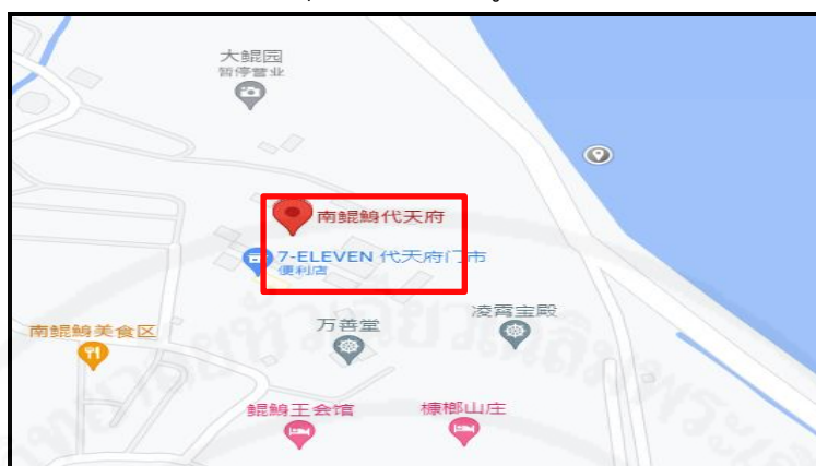
ภาพที่ 2 แผนที่สังเขปของศาลเจ้าหนานคุนเฉินใต้เทียนฟู่ (南鯤鯓代天府)

ที่มา: Baidu (ศาลเจ้าหนานคุนเฉินใต้เทียนฟู่) ค้นมาเมื่อวันที่ 29 พฤษภาคม 2564