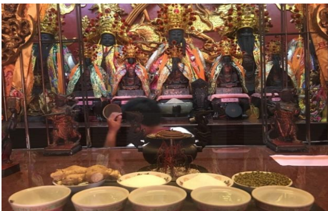
ถ่ายเมื่อวันที่ 23 พฤษภาคม 2564 ที่ศาลเจ้ามูลนิธิธรรมกัตัญญู (เสียนหลอใต้เทียนกง)