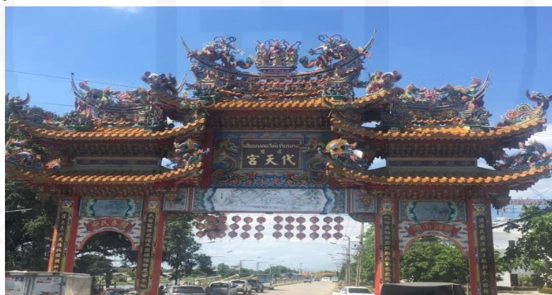
ภาพที่ 5 ประตูหนึ่งที่เข้าไปศาลเจ้า

ถ่ายเมื่อวันที่ 23 พฤษภาคม 2564 ที่ศาลเจ้ามูลนิธิธรรมกัตัญญ (เสียนหลอใต้เทียนกง)