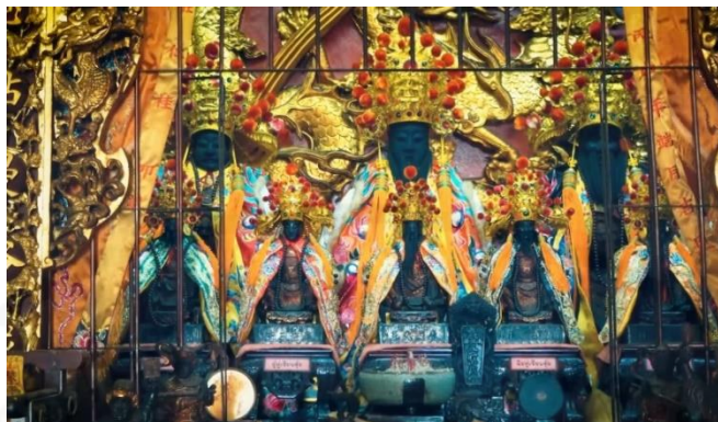
ที่มา: WANG QINGHUA (ญาติ) ถ่ายเมื่อวันที่ 29 มิถุนายน 2564 ที่ศาลเจ้ามูลนิธิธรรมกัตัญญู (เสียนหลอใต้เทียนกง)