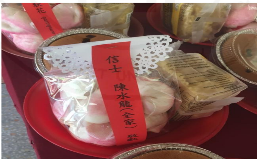
ภาพที่ 38 ขนมลูกท้อที่ได้จัดบูชาของศาลเจ้าเนื่องในวันเกิดของเทพเจ้าอู่ฟู่เซียนส่วย

ที่มา: WANG QINGHUA (ญาติ) ถ่ายเมื่อวันที่ 6 มิถุนายน 2564 ที่ศาลเจ้ามูลนิธิธรรมกตัญญู (เสียนหลอใต้เทียนกง)