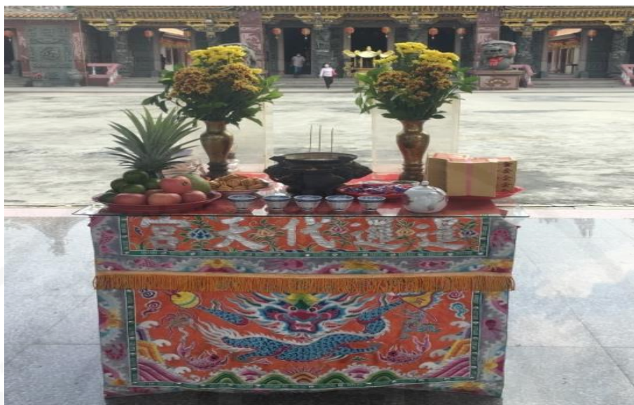
ที่มา: WANG QINGHUA (ญาติ) ถ่ายเมื่อวันที่ 6 มิถุนายน 2564 ที่ศาลเจ้ามูลนิธิธรรมกัตถุญญ (เสียนหลอใต้เทียนกง)