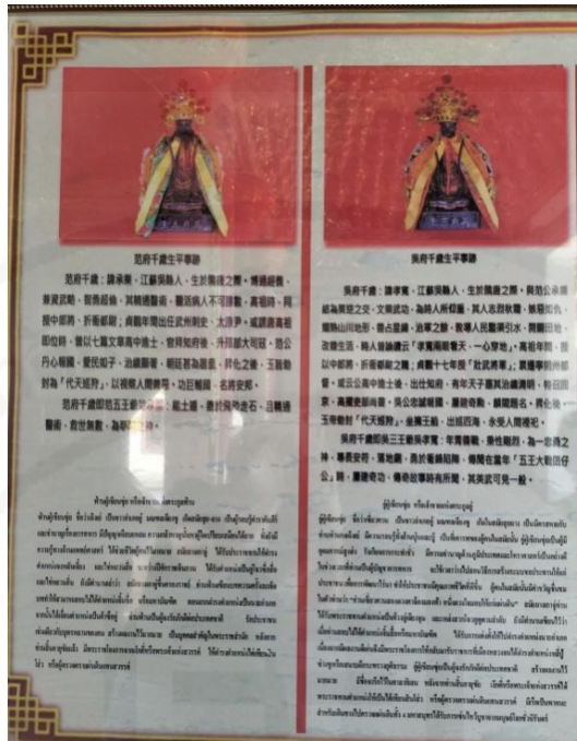
ที่มา: WANG QINGHUA (ญาติ) ถ่ายเมื่อวันที่ 24 พฤษภาคม 2564 ที่ศาลเจ้ามูลนิธิธรรมกัตถุญญ (เสียนหลอใต้เทียนกง)