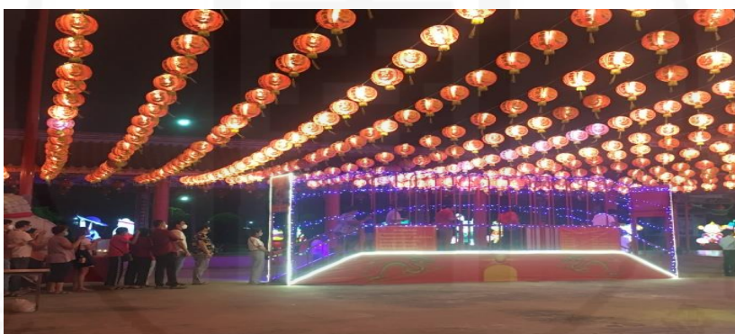
ถ่ายเมื่อวันที่ 31 มกราคม 2565 ที่ศาลเจ้ามูลนิธิธรรมกัตัญญู (เสียนหลอใต้เทียนกง)

ตั้งที่ นายโหว (คนใต้หวัน) ผู้ดูแลศาลเจ้า ได้กล่าวว่า