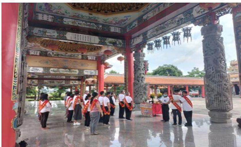
ภาพที่ 43 ผู้ศรัทธาเข้าร่วมพิธีกรรมในวันเกิดของเทพเจ้า

ที่มา: WANG QINGHUA (ญาติ) ถ่ายเมื่อวันที่ 6 มิถุนายน 2564 ที่ศาลเจ้ามูลนิธิธรรมกตัญญู (เสียนหลอใต้เทียนกง)