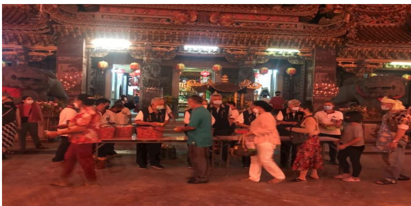
ถ่ายเมื่อวันที่ 31 มกราคม 2565 ที่ศาลเจ้ามูลนิธิธรรมกัตัญญู (เสียนหลอใต้เทียนกง)