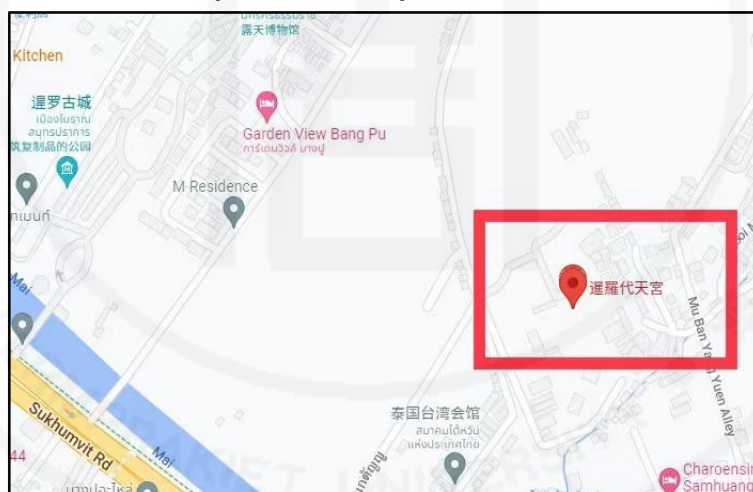
ภาพที่ 4 แผนที่สังเขปของศาลเจ้ามูลนิธิธรรมกัตัญญ (เสียนหลอใต้เทียนกง)