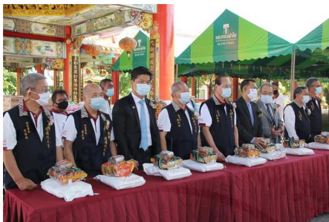
ภาพที่ 44 เจ้าหน้าที่กำลังแจกสิ่งของให้กับชาวบ้านและผู้ยากไร้