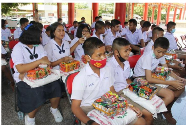
ภาพที่ 45 ผู้ได้รับสิ่งของจากศาลเจ้า