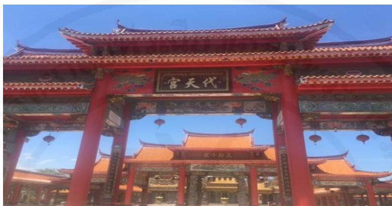
ภาพที่ 6 ประตูสองที่เข้าไปศาลเจ้า

ที่มา: WANG QINGHUA (ญาติ) ถ่ายเมื่อวันที่ 23 พฤษภาคม 2564 ที่ศาลเจ้ามูลนิธิธรรมกตัญญู (เสียนหลอใต้เทียนกง)