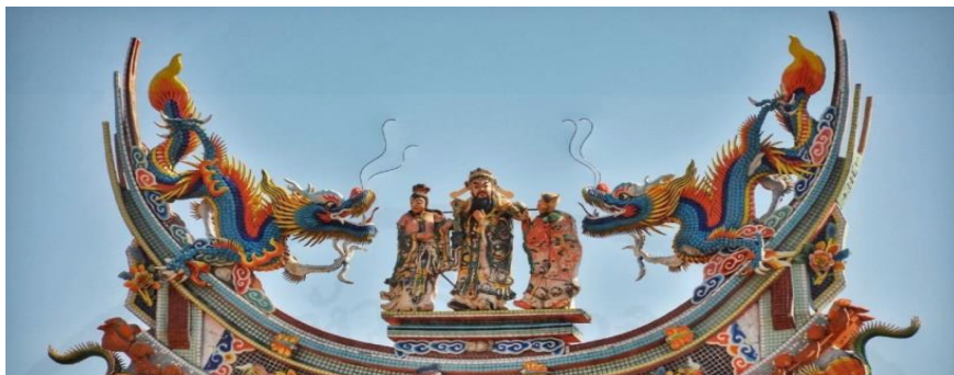
ที่มา: WANG QINGHUA (ญาติ) ถ่ายเมื่อวันที่ 24 พฤษภาคม 2564 ที่ศาลเจ้ามูลนิธิธรรมกัตัญญู (เสียนหลอใต้เทียนกง)